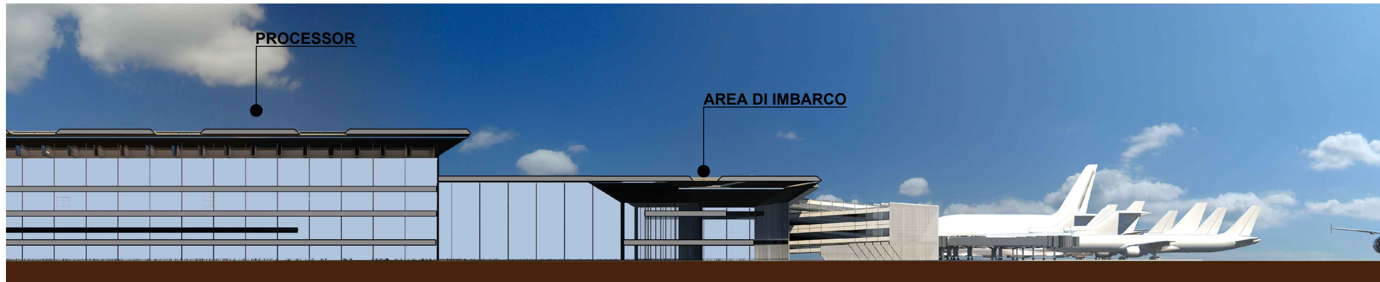
PROFILO SUD 02 - SEZIONE 02