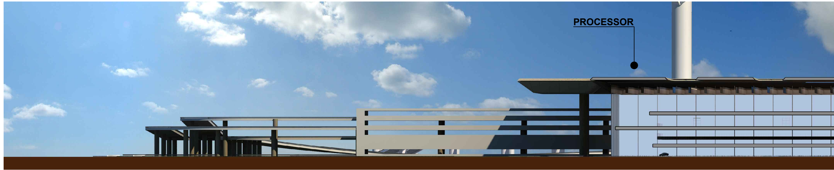
PROFILO SUD 02 - SEZIONE 01