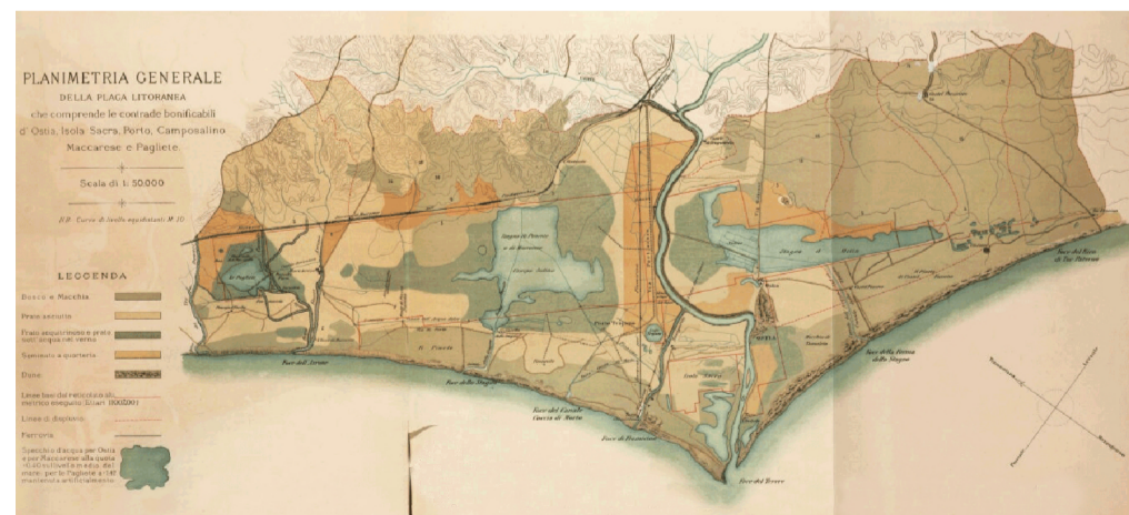
Cartografia storica dello Stagno di Maccarese e Stagno di Ostia (G. Ameduni, 1880)

Secondo tale logica, il tracciato della linea ferroviaria Roma-Genova viene assunto quale matrice del territorio della bonifica, le cui strade e canali presentano una giacitura parallela o ortogonale a detto asse; all'interno della maglia regolare così determinata, che trova nei filari di eucalipti la sua rappresentazione tridimensionale, il sistema edilizio è organizzato secondo una articolata quanto peraltro rigido abaco di soluzioni.