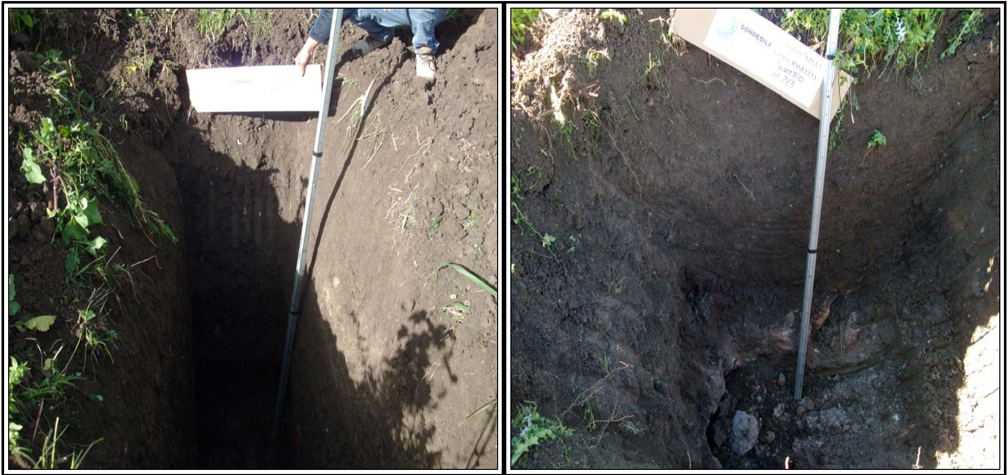
Pozzetti 213 – 214b