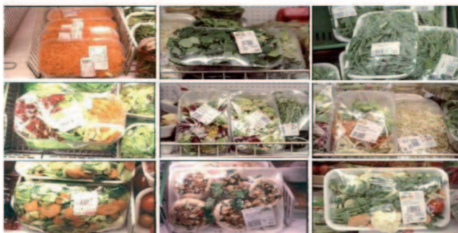
Fig. 1 - Prodotti di IV gamma nelle confezioni più comuni

Questi prodotti pronti al consumo rispondono al bisogno del consumatore di ridurre i tempi di preparazione dei pasti ed il volume degli scarti di cucina, ma sono piuttosto fragili, perché il sistema di lavorazione non consente di stabilizzarli biologicamente.