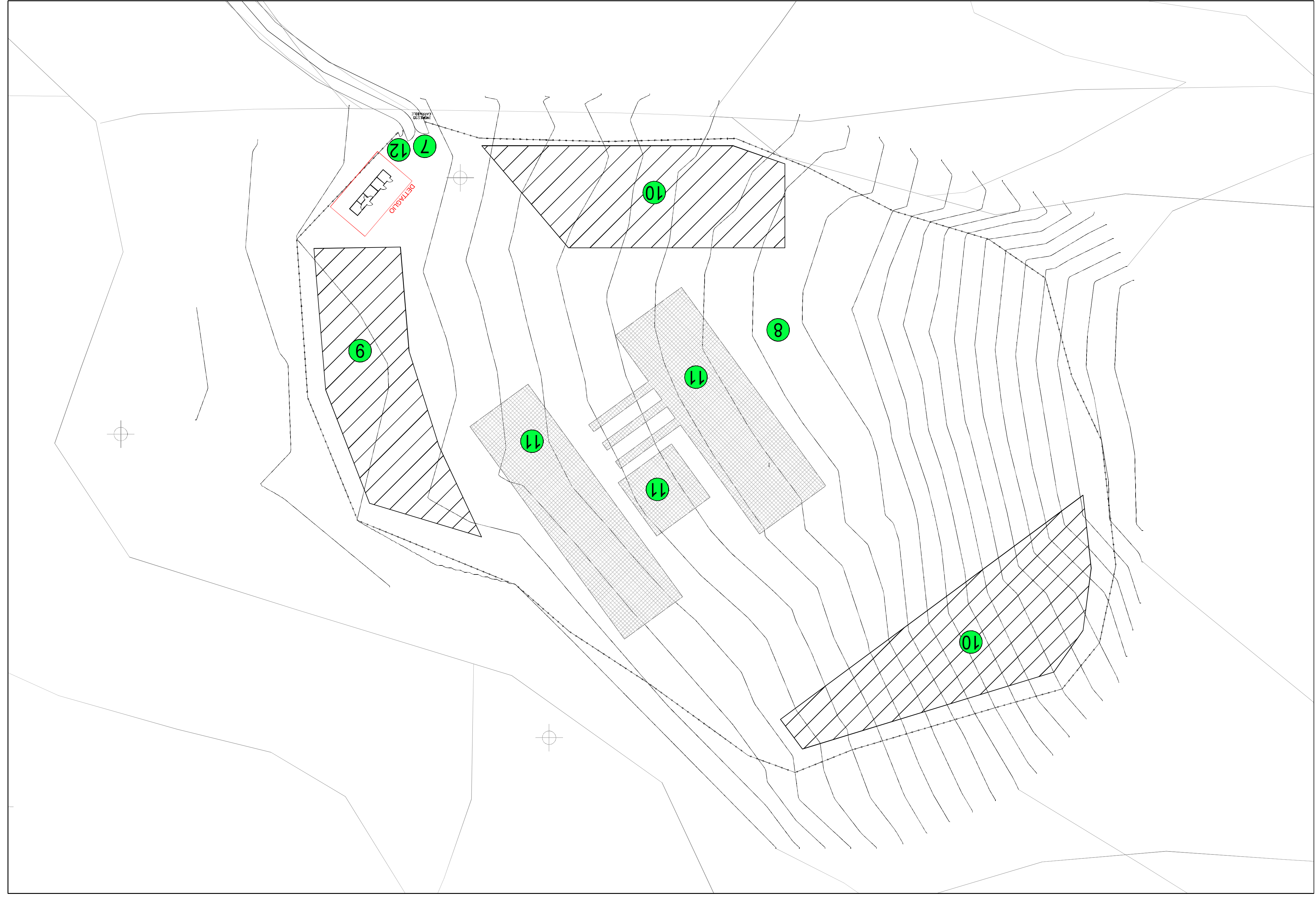
CANTIERE DELL'AREA LUCIGNANO 2 - 1:500