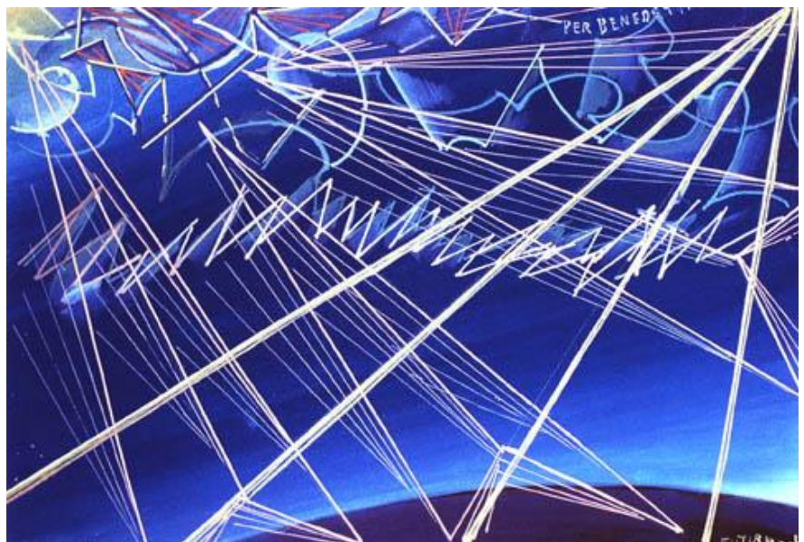
GIACOMO BALLA (1871-1958) TRASFORMAZIONE DI FORME 1918