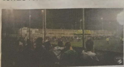
È atteso un gran pubblico per assistere alla Coppa di mezza estate