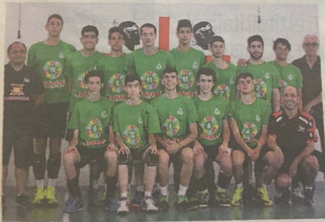
La selezione sarda maschile che parteciperà al Trofeo delle Regioni