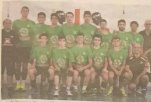
La selezione sarda maschile che parteciperà al Trofeo delle Regioni