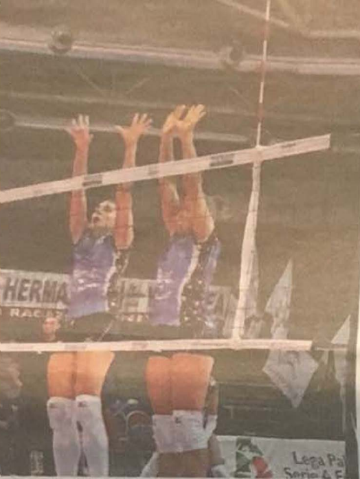
esione della pallavolo sarda