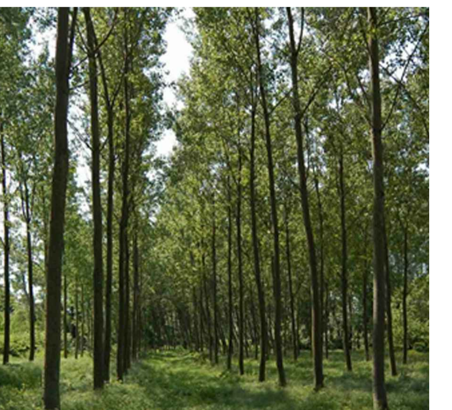
Dopo 10 anni