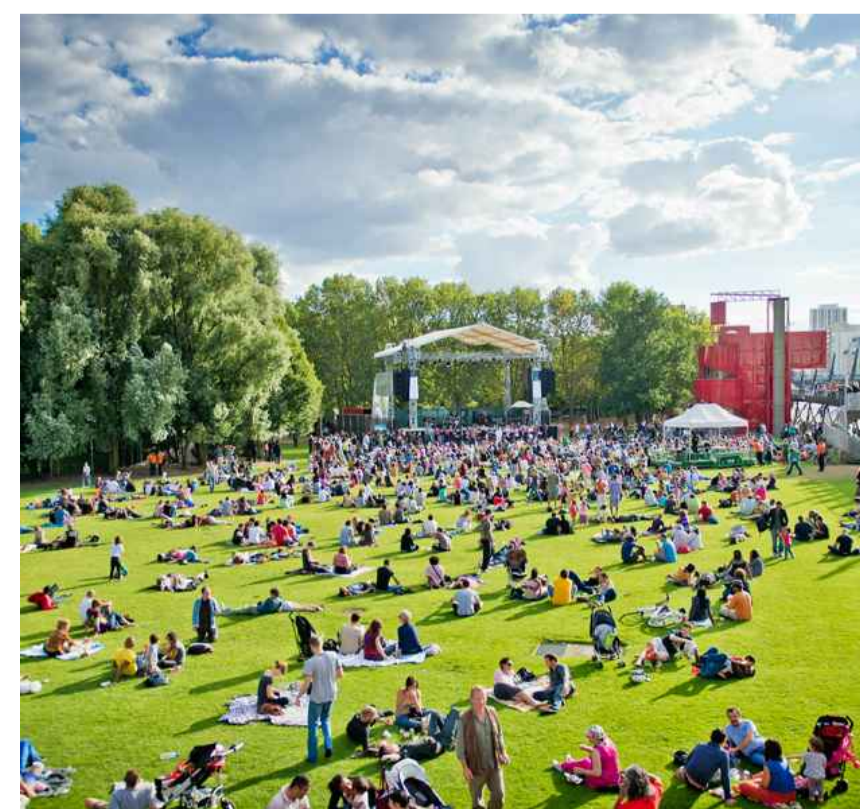
GRANDI EVENTI ALL'APERTO Parc de la Villette, Bernard Tschumi