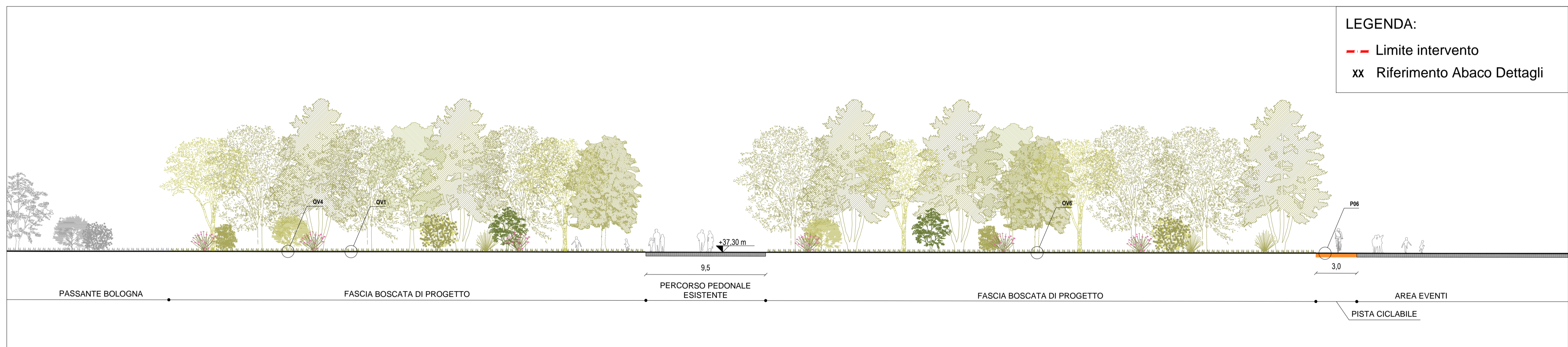
STRALCIO 1 SCALA 1:200

LEGENDA: - - Limite intervento xx Riferimento Abaco Dettagli