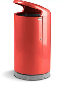
Cestino in acciaio zincato tipo mod. Single fox