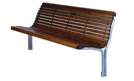
Panca con schienale in acciaio zincato e legno tipo mod. Contour