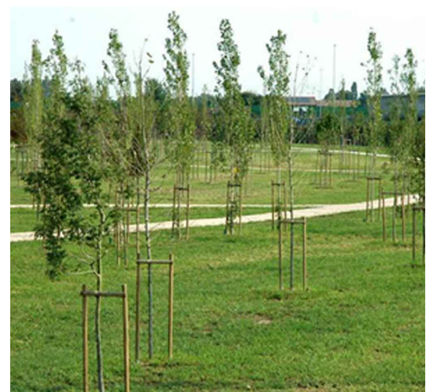
NUOVA FORESTAZIONE Anno di messa a dimora