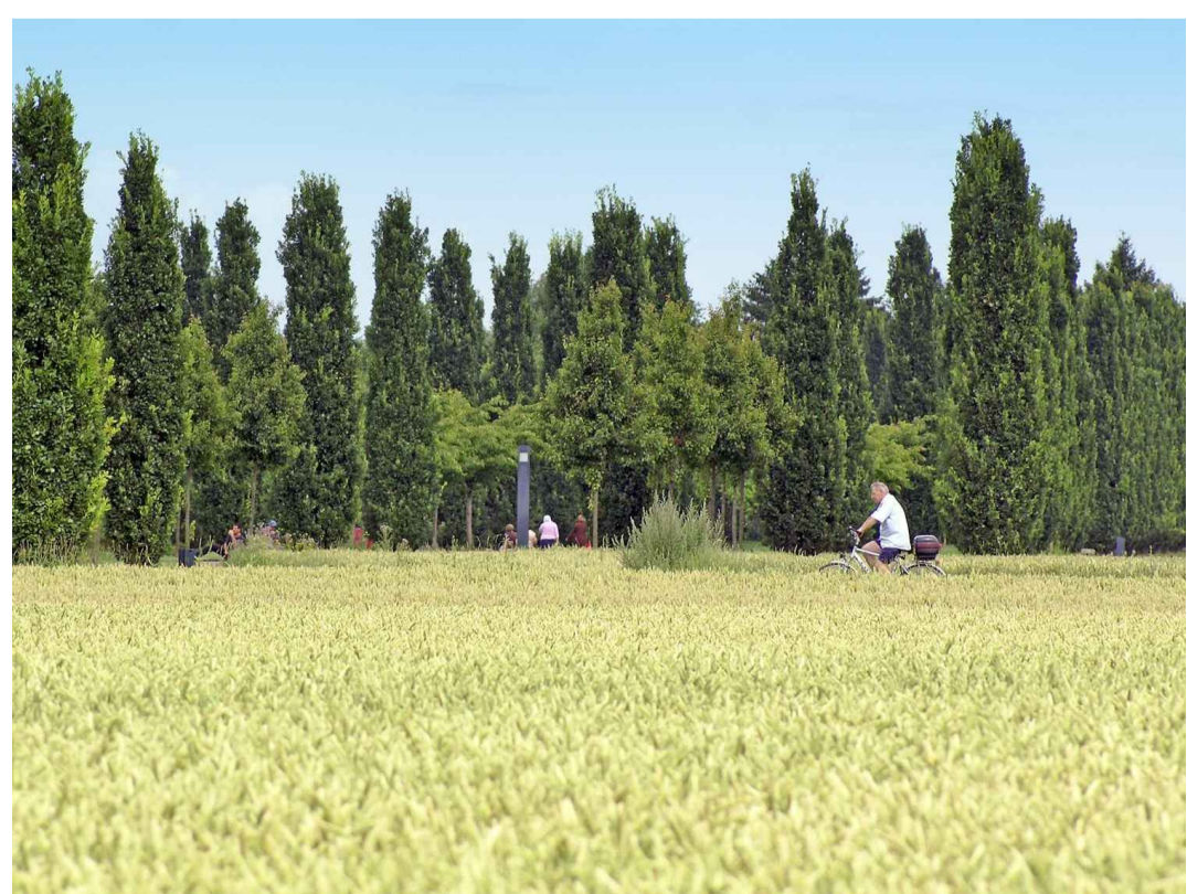
PARCO AGRICOLO Stadpark Krefeld Fischeln