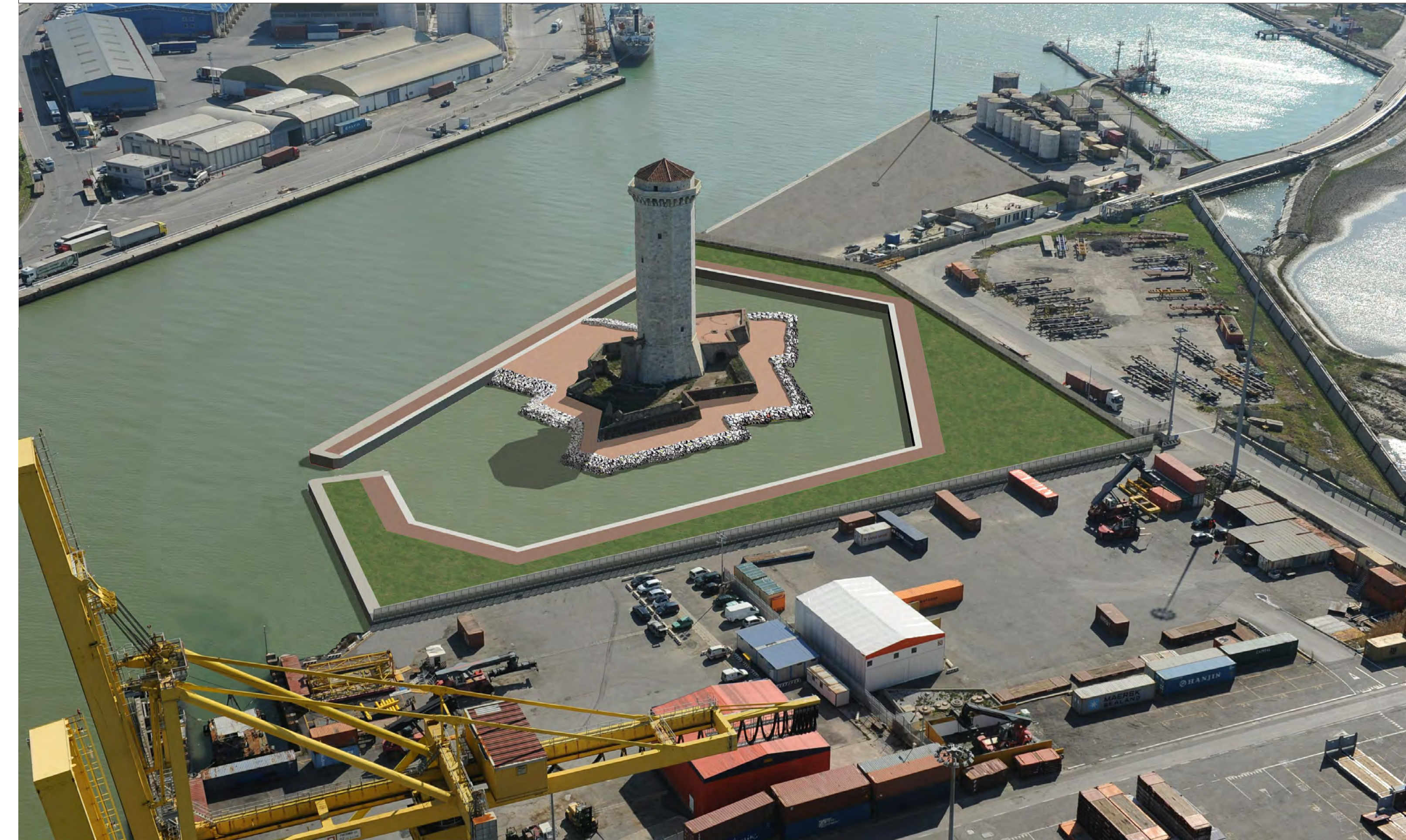
IPOTESI PROGEATUATTUALE: VISTA AEREA DAL TERMINAL DARSENA TOSCANA