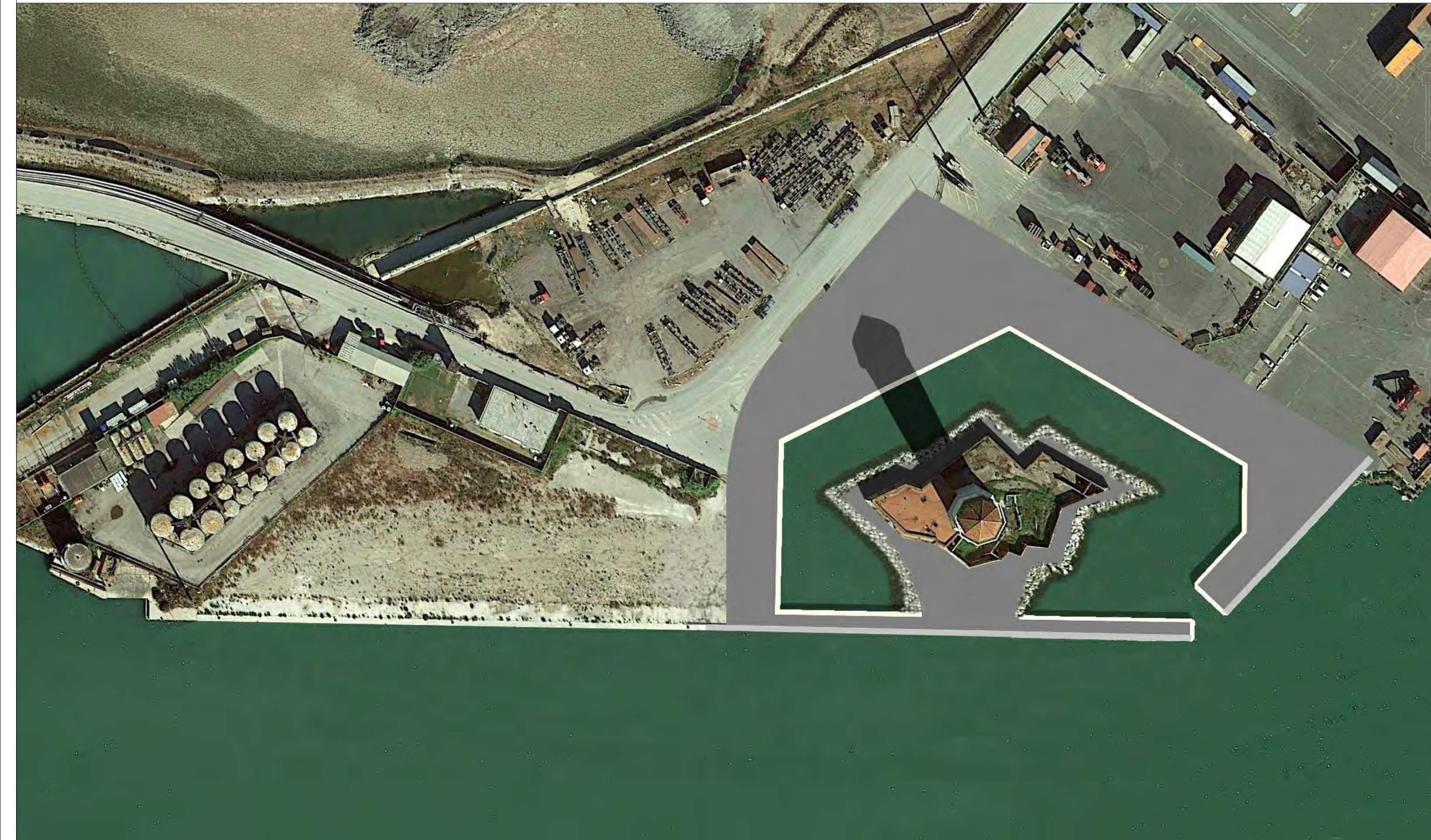
IPOTESI PROGETTUALE: IMMAGINE SATELLITARE