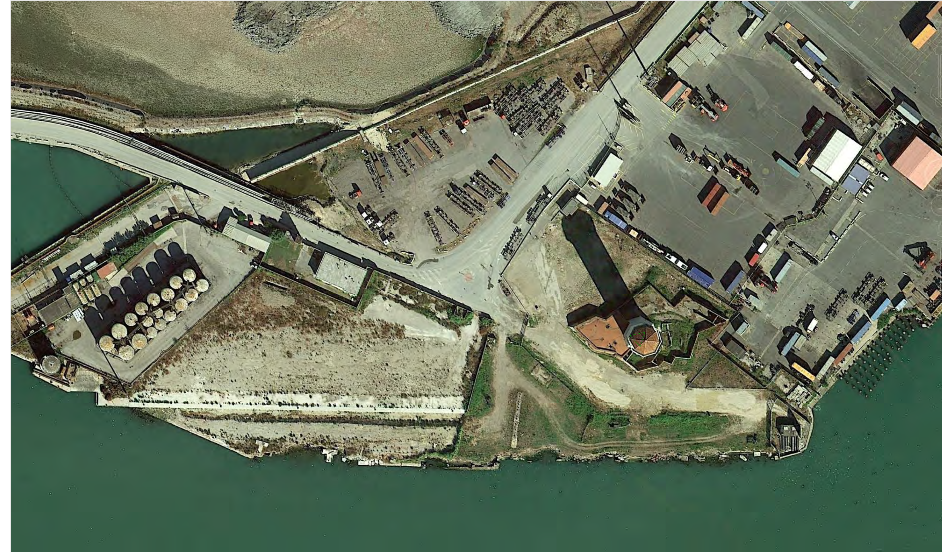
STATO ATTUALE: IMMAGINE SATELLITARE