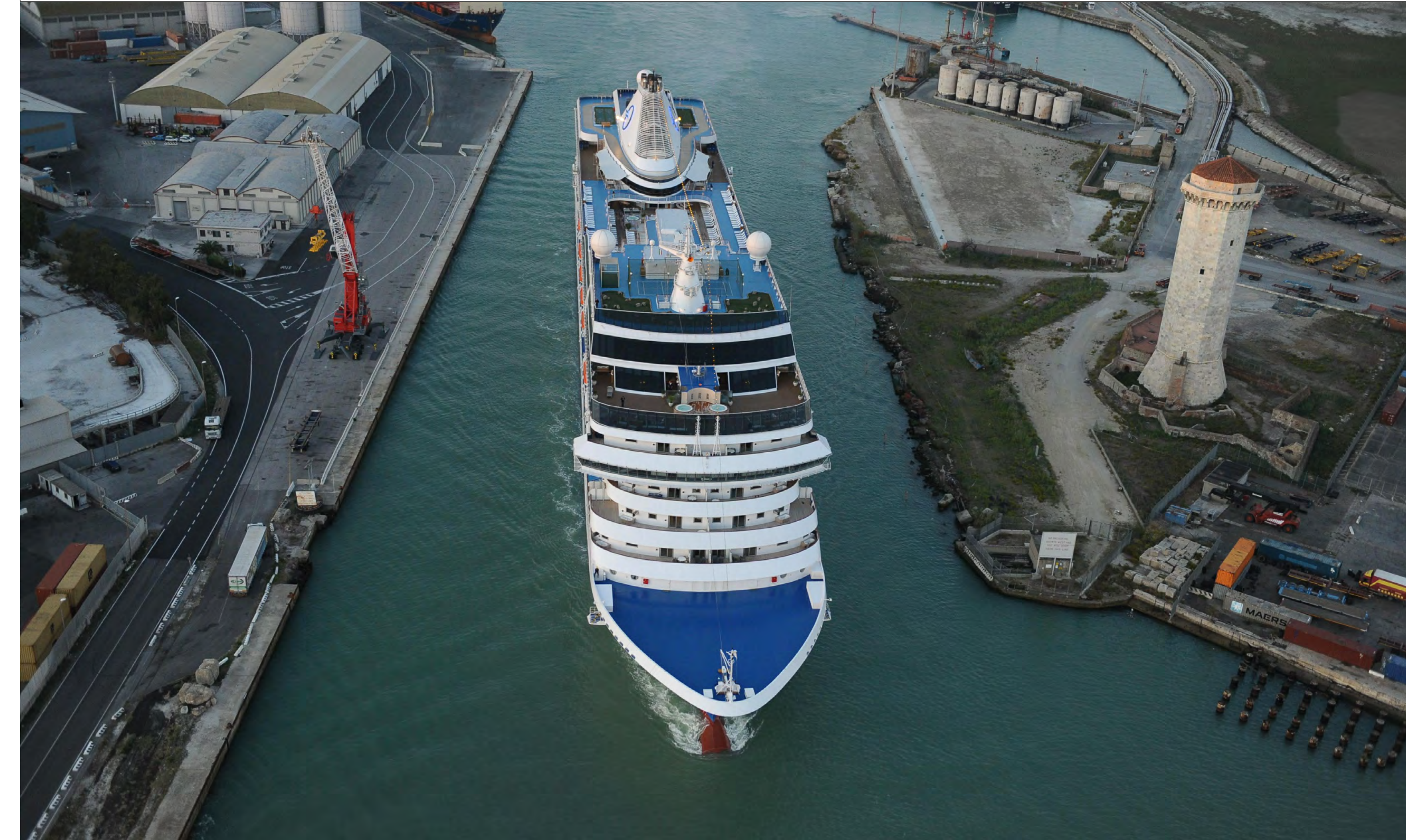
STATO ATTUALE: VISTA DAL CANALE INDUSTRIALE IN DIREZIONE SUD/OVEST