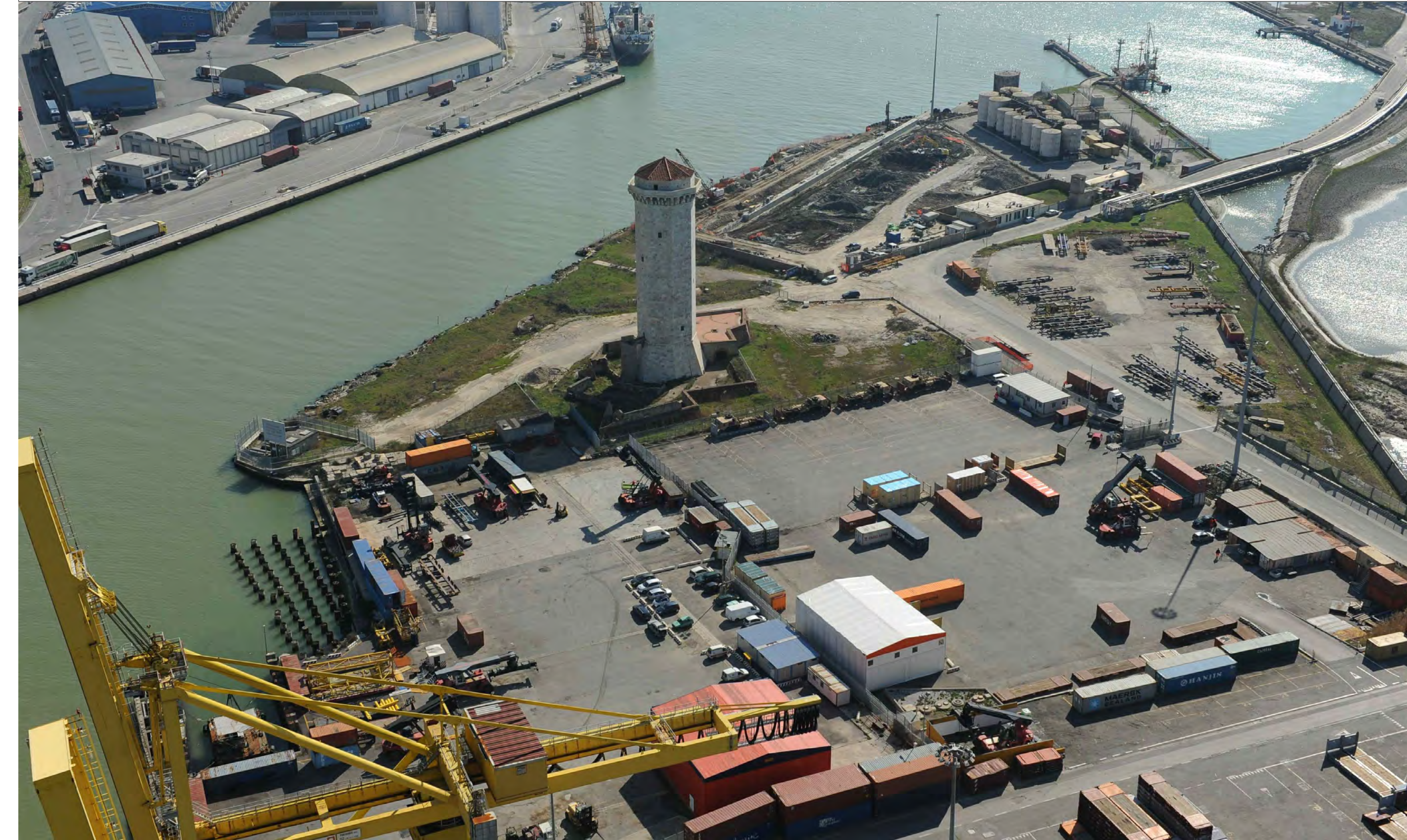
STATO ATTUALE: VISTA AEREA DAL TERMINAL DARSENA TOSCANA