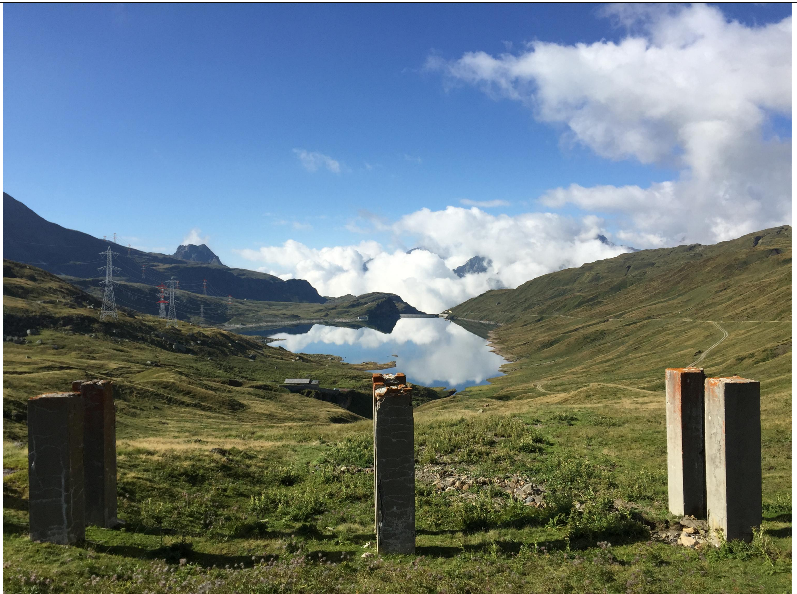
PUNTO VISUALE PV3 - FOTOSIMULAZIONE (Alternativa Formazza)