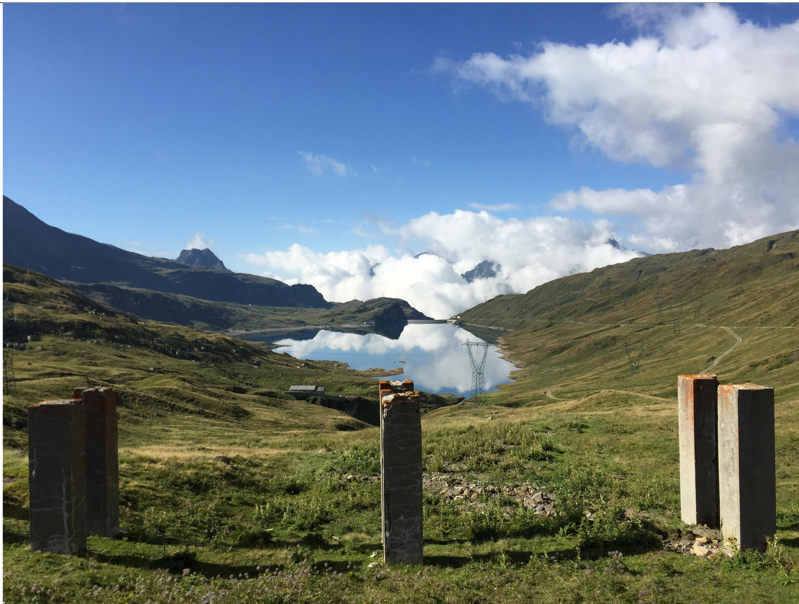
PUNTO VISUALE PV.3 - ANTE OPERAM - STATO DI FATTO