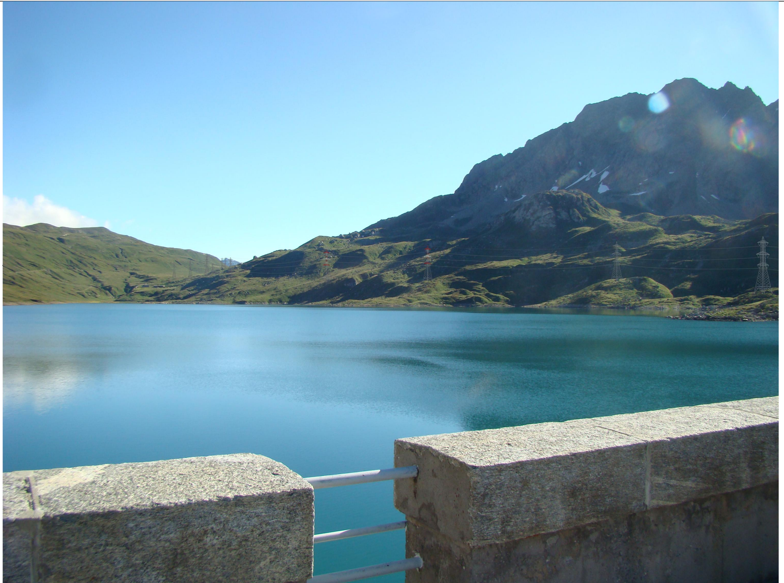
PUNTO VISUALE PV2 - FOTOSIMULAZIONE (Alternativa Formazza)