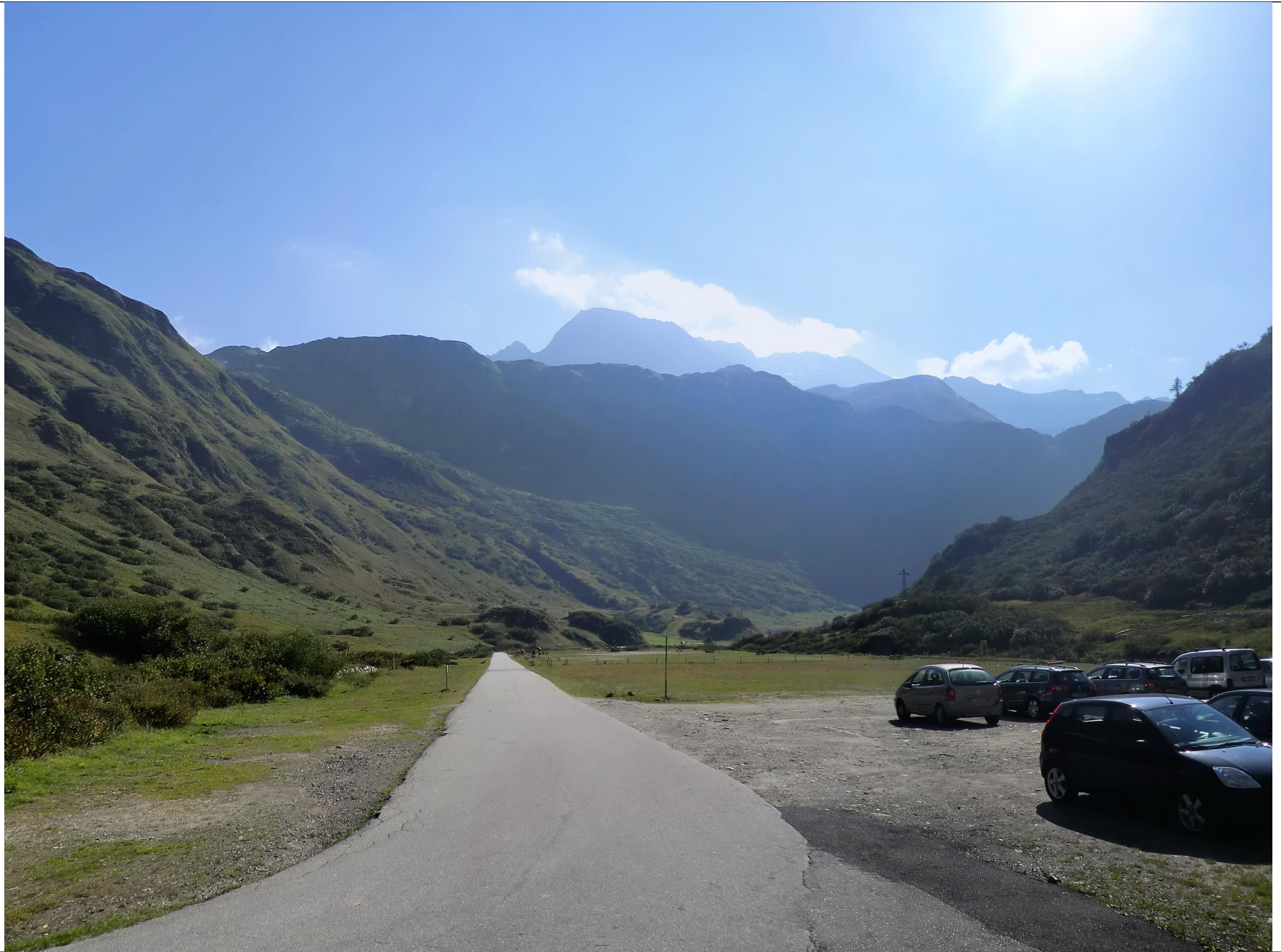
PUNTO VISUALE PV1 - FOTOSIMULAZIONE (Alternativa Formazza)