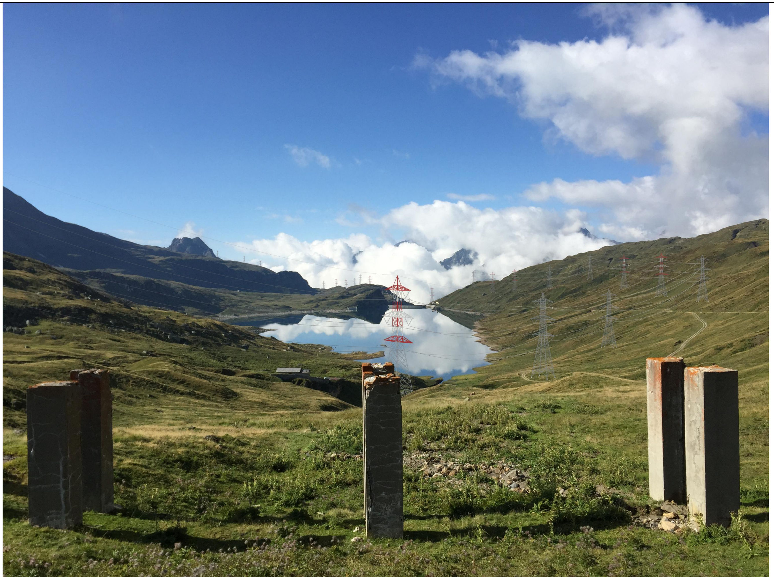
PUNTO VISUALE PV3 - FOTOSIMULAZIONE (Alternativa MiBAC)