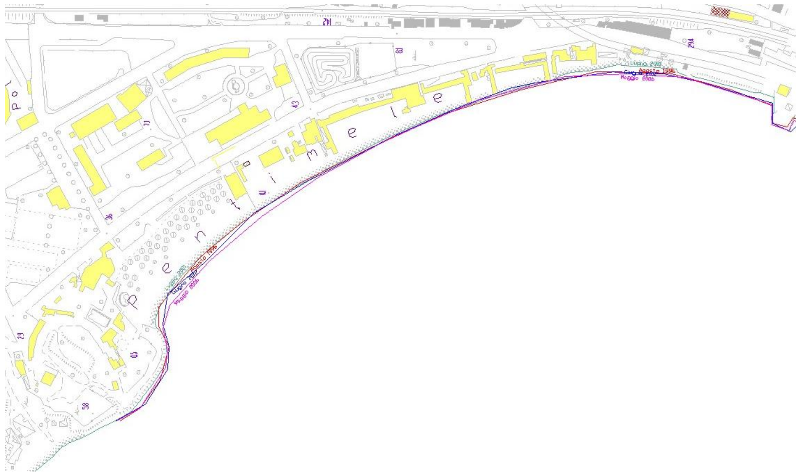
Fig. 2.1- Evoluzione della linea di costa del paraggio di Pentimele nel periodo 1996-2012.