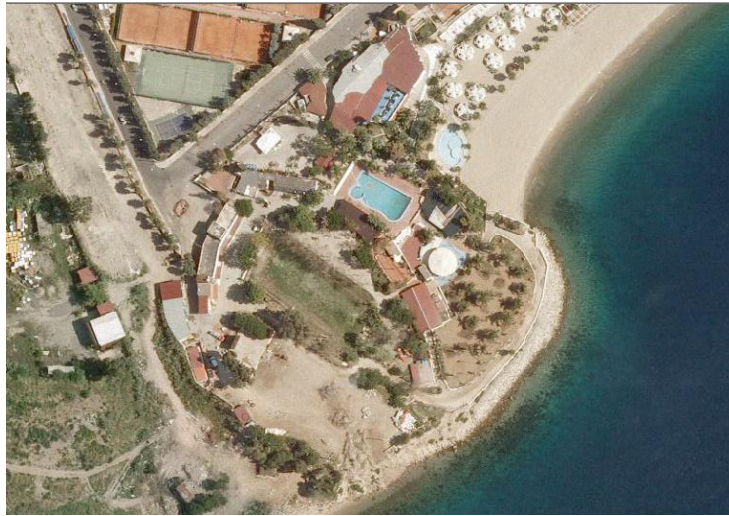
Fig. 1.3- Ripresa aerea del tratto meridionale della foce del torrente Torbido

Procedendo verso sud, si estende la rada di Pentimele, il cui litorale si presenta in forma di “pocket beach”, cioè di piccola spiaggia incastonata tra l’apparato focale del Torrente Torbido a nord ed alcune opere di difesa a sud realizzate con pennelli e scogliere radenti a protezione di una struttura balneare, sulle quali il litorale trova una “sponda di appoggio”. L’andamento della linea di riva descrive un’arcata litoranea che sottende una spiaggia molto ampia (circa 35 m) sul limitare settentrionale ridossato alla foce del Torbido, assottigliandosi vieppiù, mano a mano che si procede verso sud, fino a ridursi ad un’ampiezza di circa 14 m nel tratto antistante la struttura balneare. Al di là di queste strutture l’arenile praticamente scompare; infatti il tratto di costa successivo, risulta totalmente irrigidito per la presenza di una serie di scogliere radenti poste a protezione di alcuni insediamenti urbani, e per la presenza di opere marittime realizzate in aggetto verso il mare a protezione di un ricovero barche, situato poco distante dall’estremità settentrionale del porto di Reggio Calabria. Solo all’interno del bacino per l’alaggio delle imbarcazioni sopravvive una piccola spiaggetta sabbiosa. Oltre il ricovero di barche si incontra il tratto di costa oggetto dell’intervento di progetto. Esso risulta irrigidito dalla presenza di massi naturali, residui di una scogliera in cattivo stato di manutenzione.