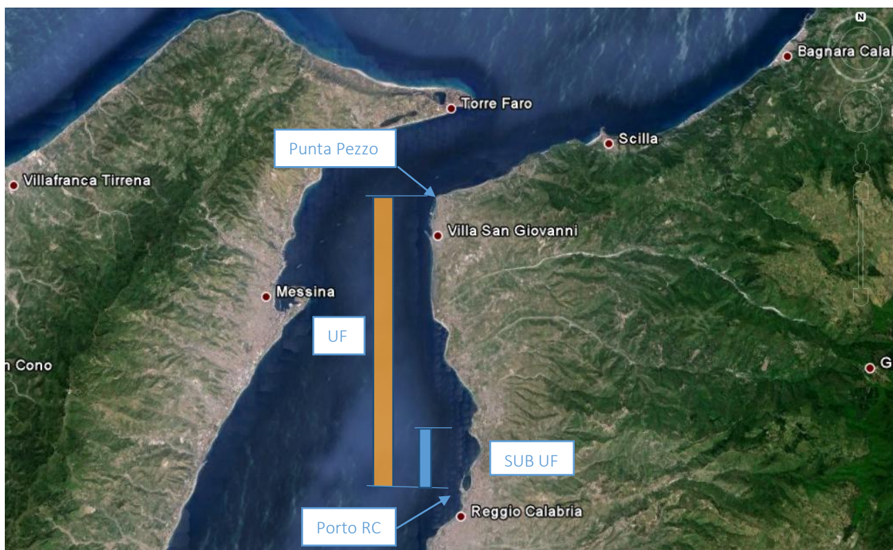
Fig. 1.1- Rappresentazione limiti dell'unità fisiografica

Il tratto costiero di Reggio Calabria ove è prevista la realizzazione del nuovo banchinamento destinato all'approdo di navi traghetto è ricompreso all'interno dell'unità fisiografica che si estende da Punta Pezzo a Nord (nel comune di Villa S. Giovanni) fino al molo di sopraflutto del porto di Reggio Calabria a Sud (si veda la figura 1.1). In particolare, il litorale oggetto di intervento, posizionato subito a ridosso del limite settentrionale del piazzale di servizio del porto, ricade nella sub-unità compresa tra la cuspidate fociale del Torrente Torbido a Nord ed il molo di sopraflutto del porto di Reggio Calabria (figura 1.2), inserita all'interno della sopradetta più ampia unità fisiografica (figura 1.1).