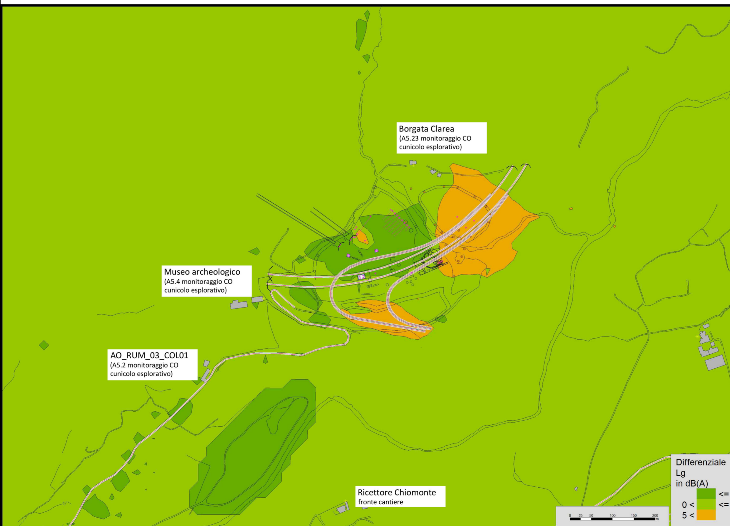
Mappa dei differenziali (livelli cantiere - livelli AO)

DOCUMENTI DI RIFERIMENTO / DOCUMENTS DE REFERENCE: PRV_C3C_TS3_7499: Relazione tecnica delle aree oggetto di variante / Rapport technique des zones objet de variante PRV_C3A_TS3_6431: Area cantiere Maddalena - Planimetria