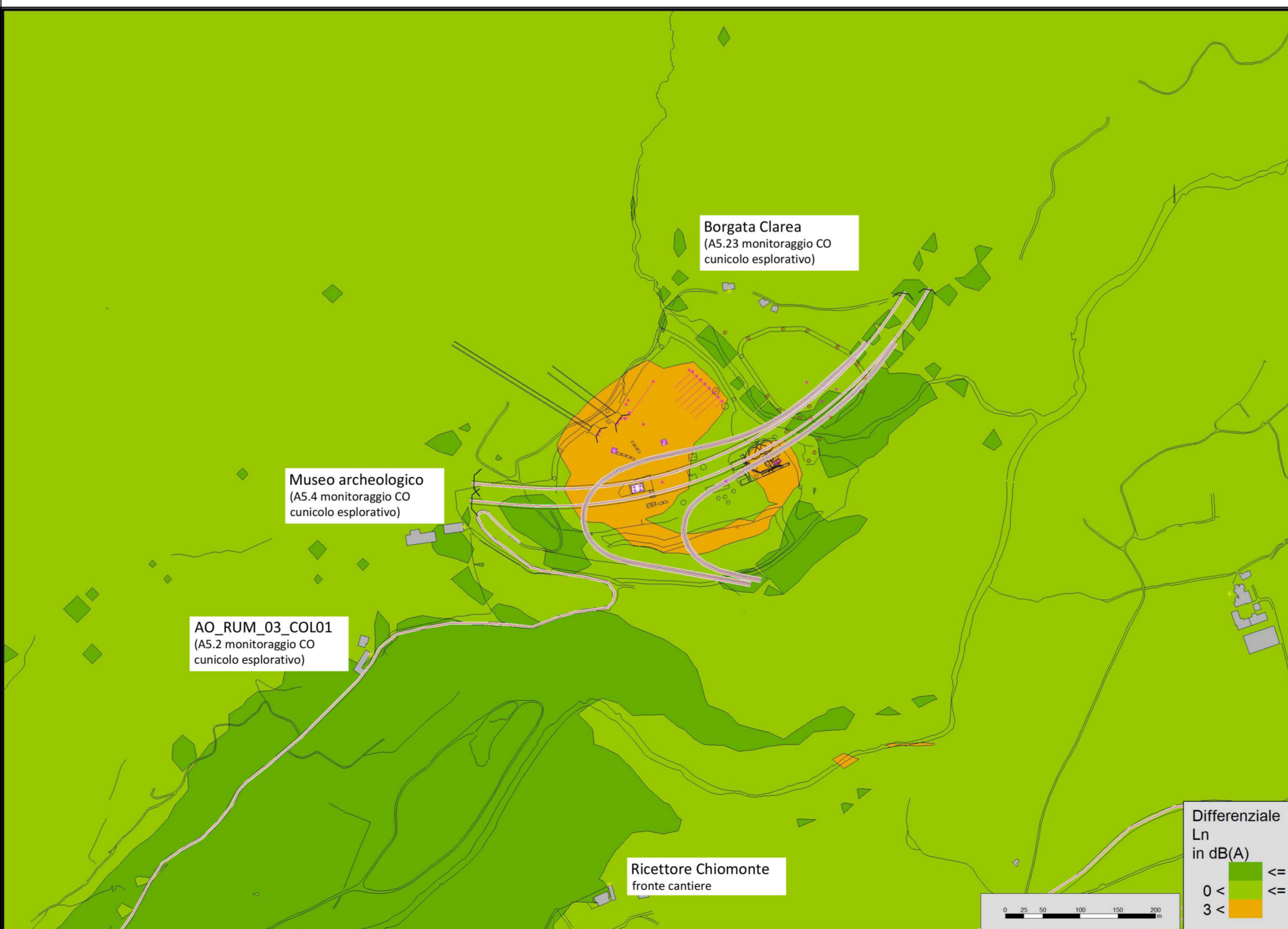
Mappa dei differenziali (livelli cantiere - livelli AO)

DOCUMENTI DI RIFERIMENTO / DOCUMENTS DE REFERENCE: PRV_C3C_TS3_7499: Relazione tecnica delle aree oggetto di variante / Rapport technique des zones objet de variante PRV_C3A_TS3_6431: Area cantiere Maddalena - Planimetria