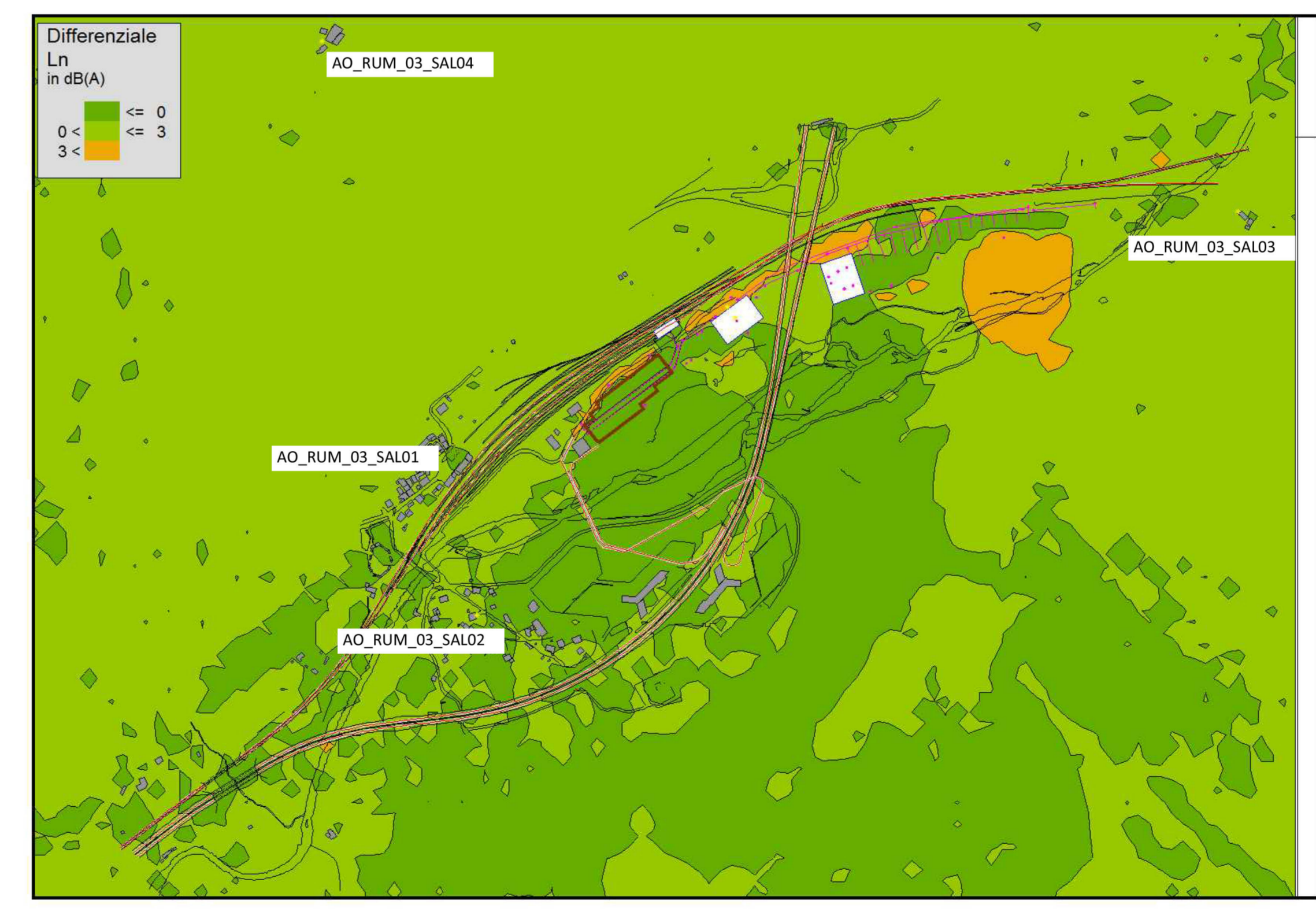
Mappa dei differenziali (livelli cantiere - livelli AO)