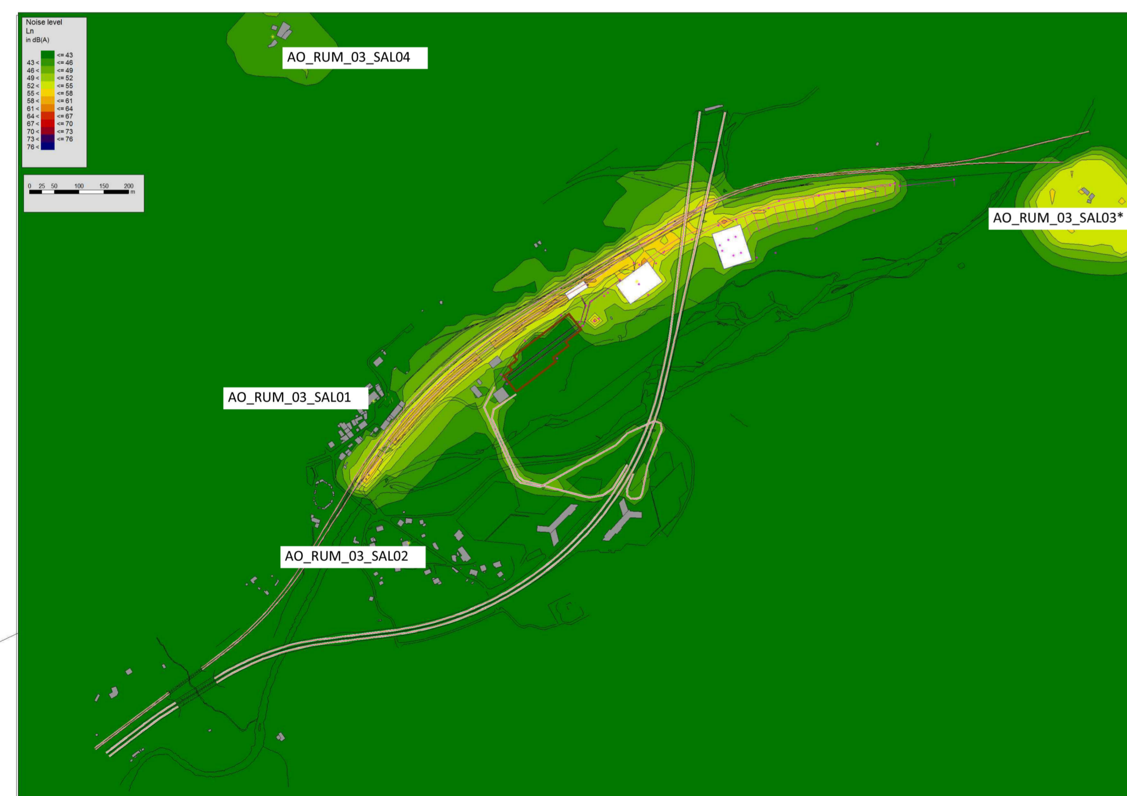
Mappa dei livelli di cantiere, senza il contributo delle infrastrutture (h = 4m)

DOCUMENTI DI RIFERIMENTO / DOCUMENTS DE REFERENCE: PRV_C3C_TS3_7499: Relazione tecnica delle aree oggetto di variante / Rapport technique des zones objet de variante PRV_C3A_TS3_7861: Area industriale di Salbertrand - Planimetria