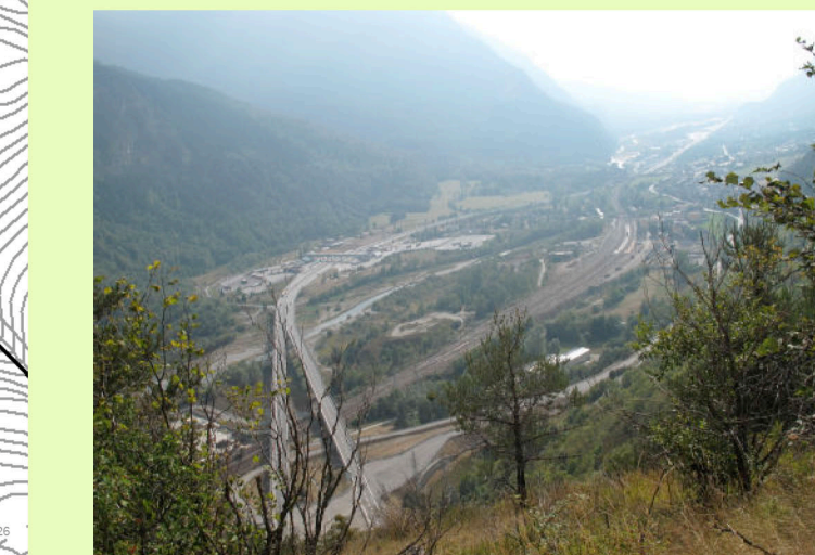
07. Vista Str. militare Fenil-Pramand-Foëns-Jafferau