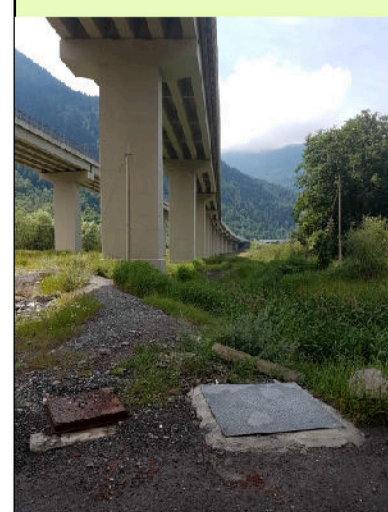
04. Viadotto autostrada A32