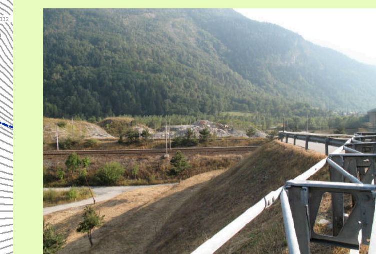
06. Vista da area imbocco ovest della galleria di Serre la Voute