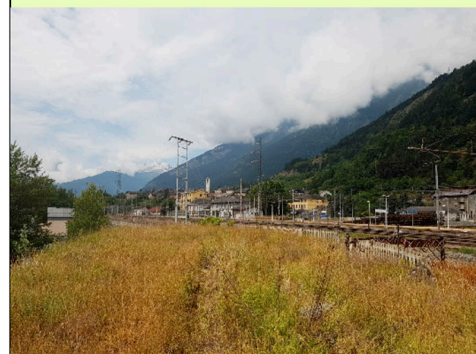
03. Fascio binari