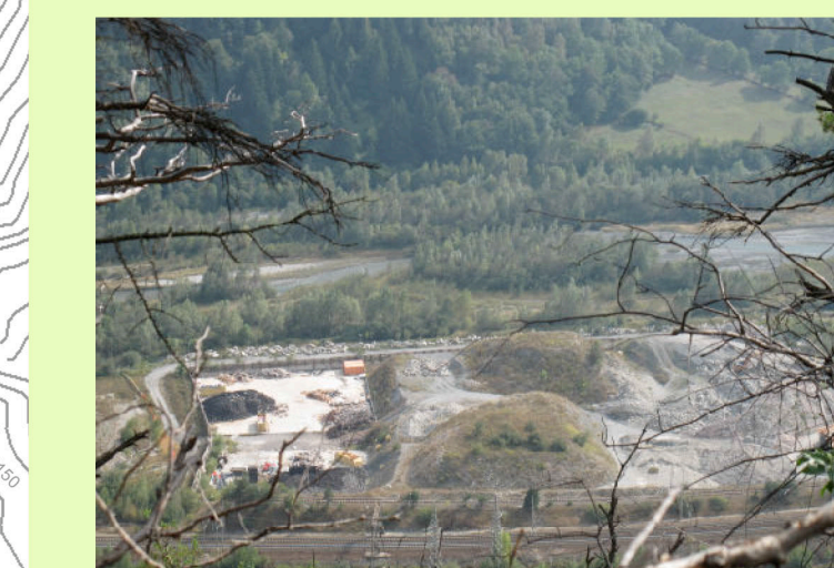
08. Cumuli (Vista da Str. militare Fenil-Pramand-Foëns-Jafferau)