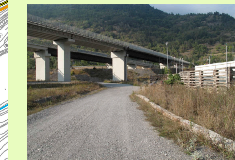
05. Viadotto autostrada A32 (vista da est)