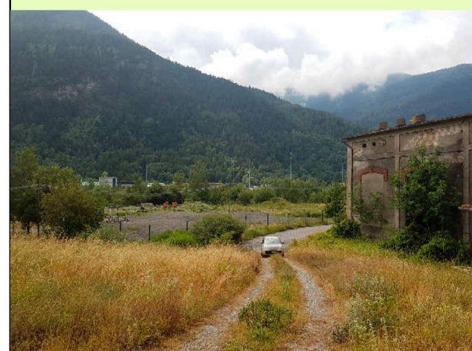
01. Interno del cantiere - Edifici lato ovest