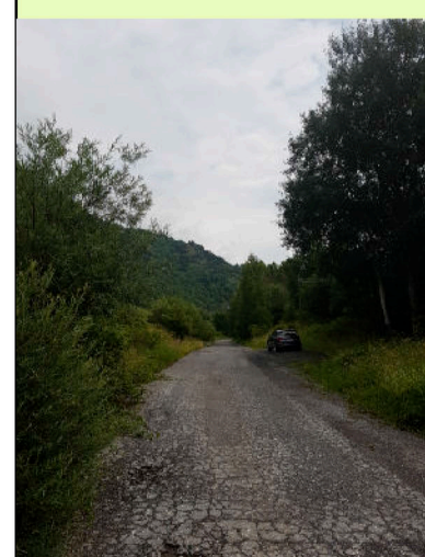
02. Strada interna lato nord