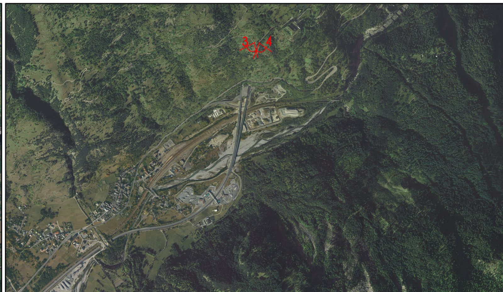
Area industriale di Salbertrand Comune di Salbertrand