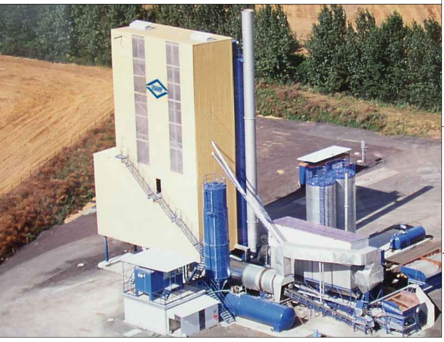
Tipologico impianto di produzione conglomerato cementizio