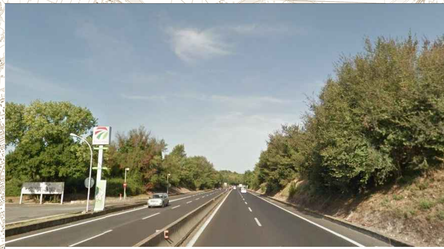
Via - Aurelia