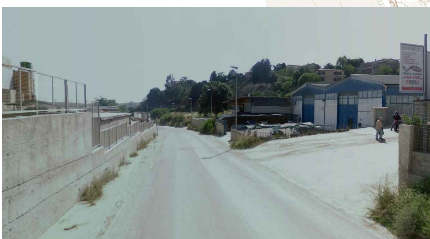
Via della Pisana