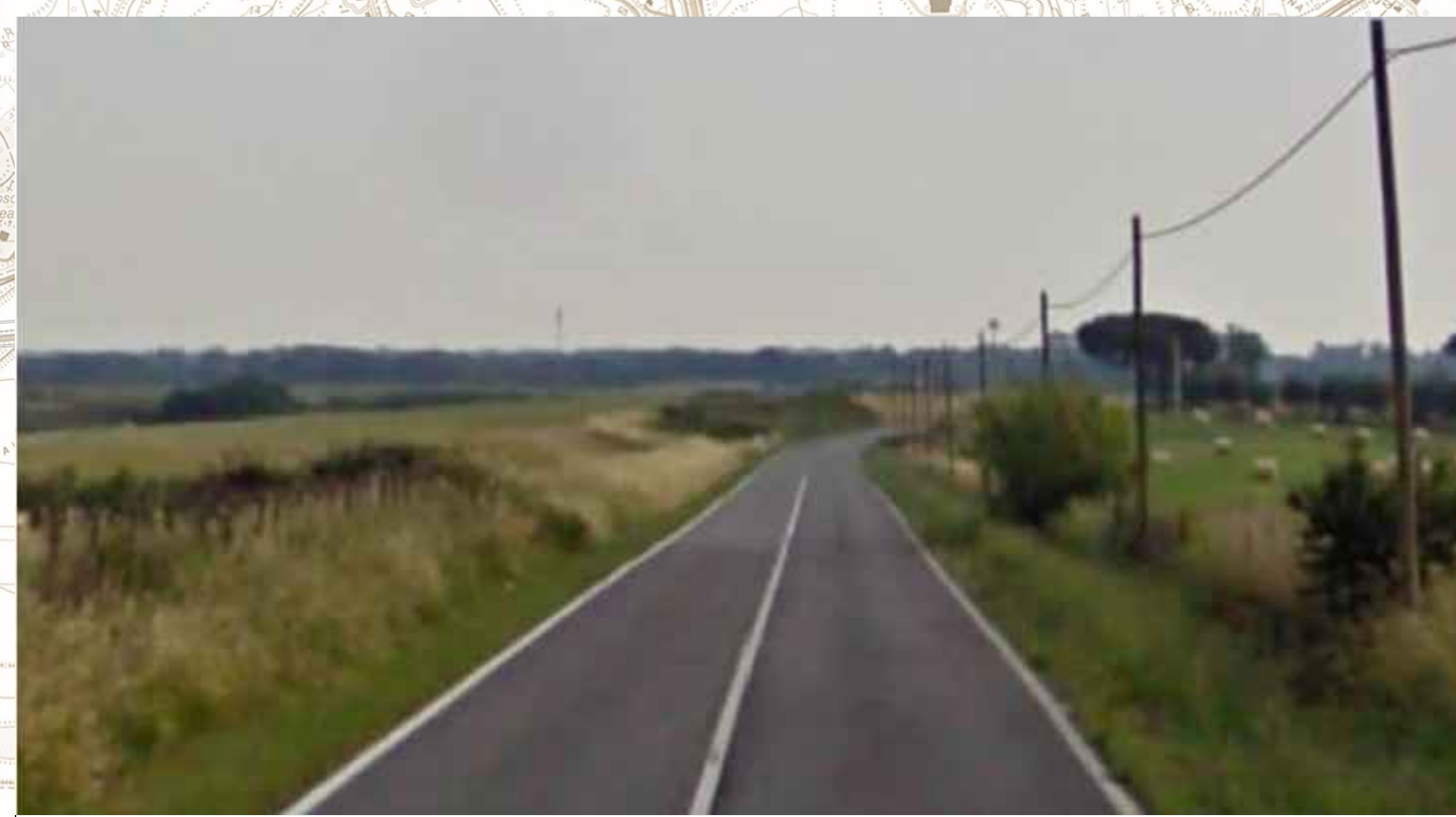
Via del Casale di Sant'Angelo