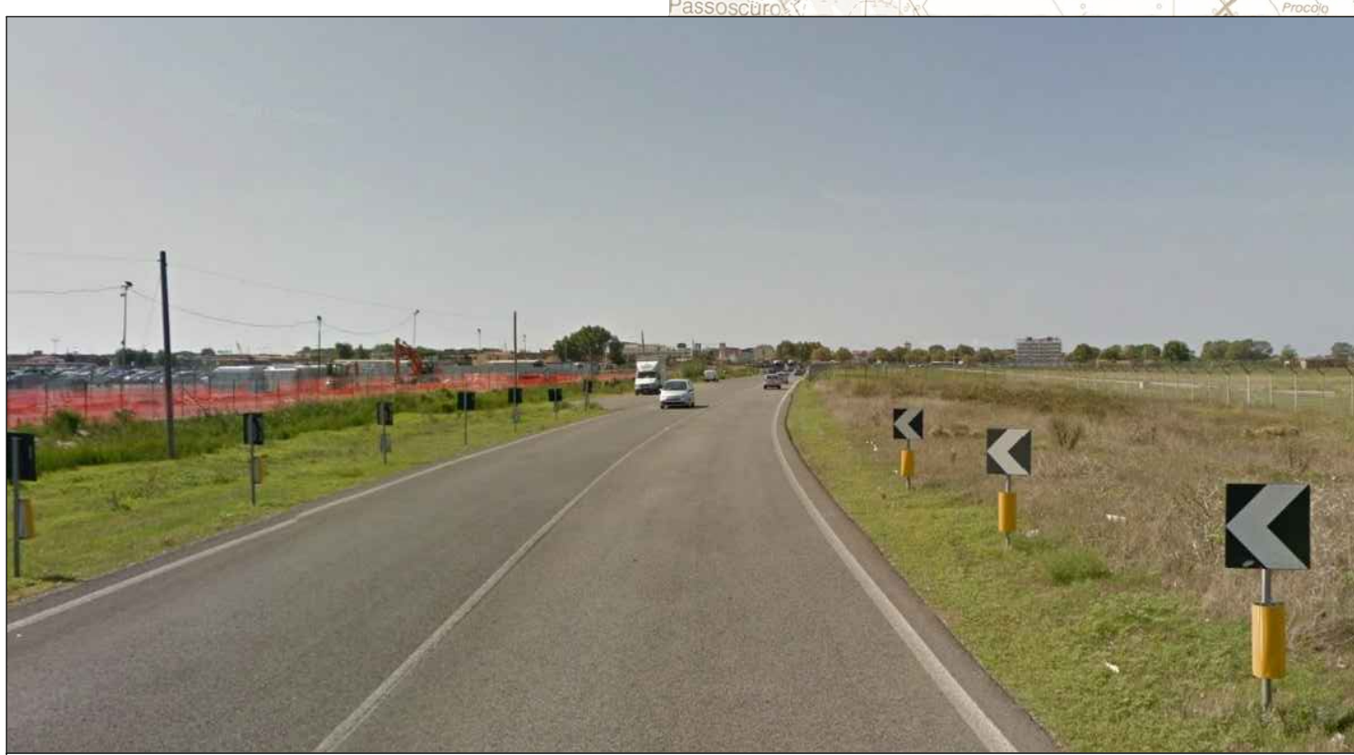
Viale del Lago di Traiano