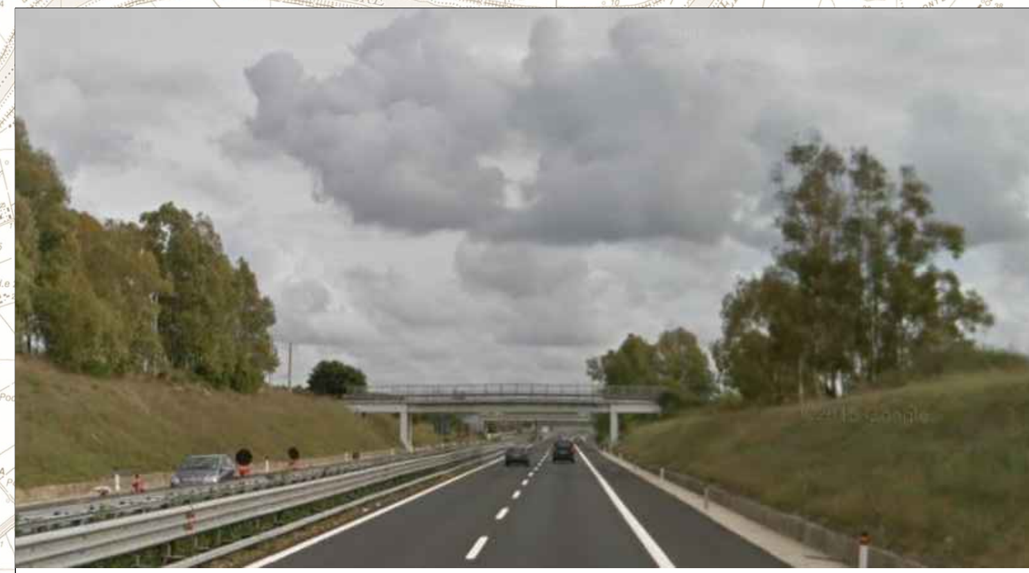
Autostrada Roma - Civitavecchia