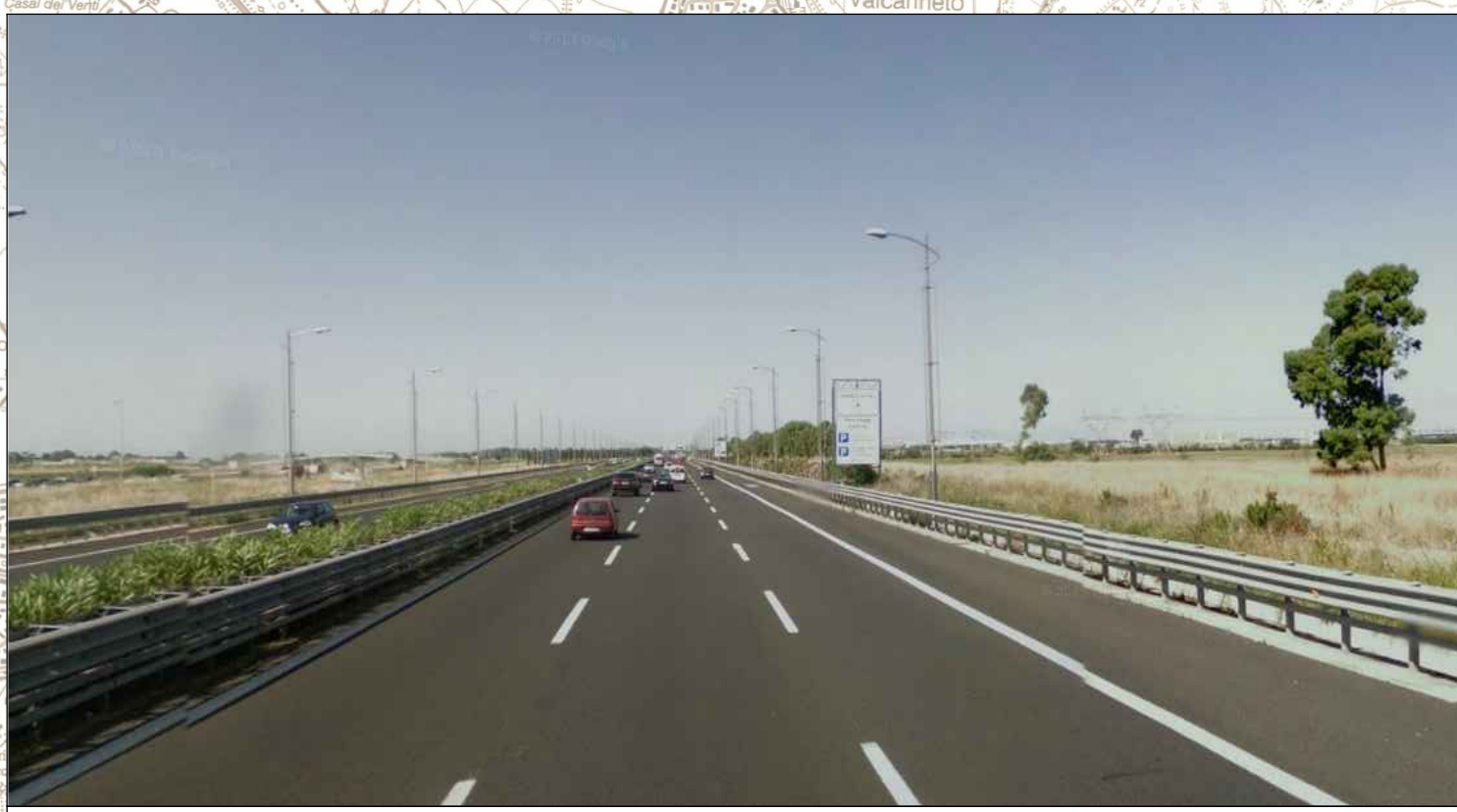
Autostrada Roma - Fiumicino