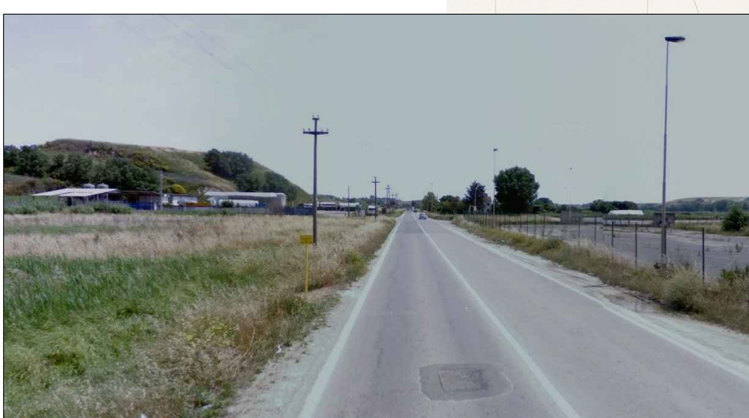
Via di Ponte Galeria