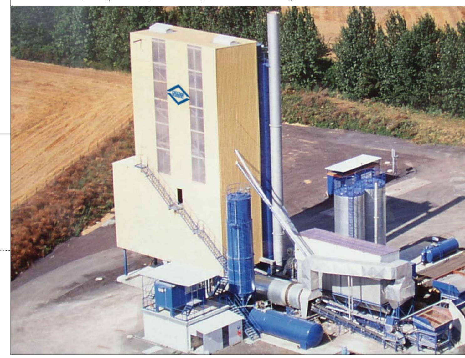
Tipologico impianto di produzione conglomerato cementizio