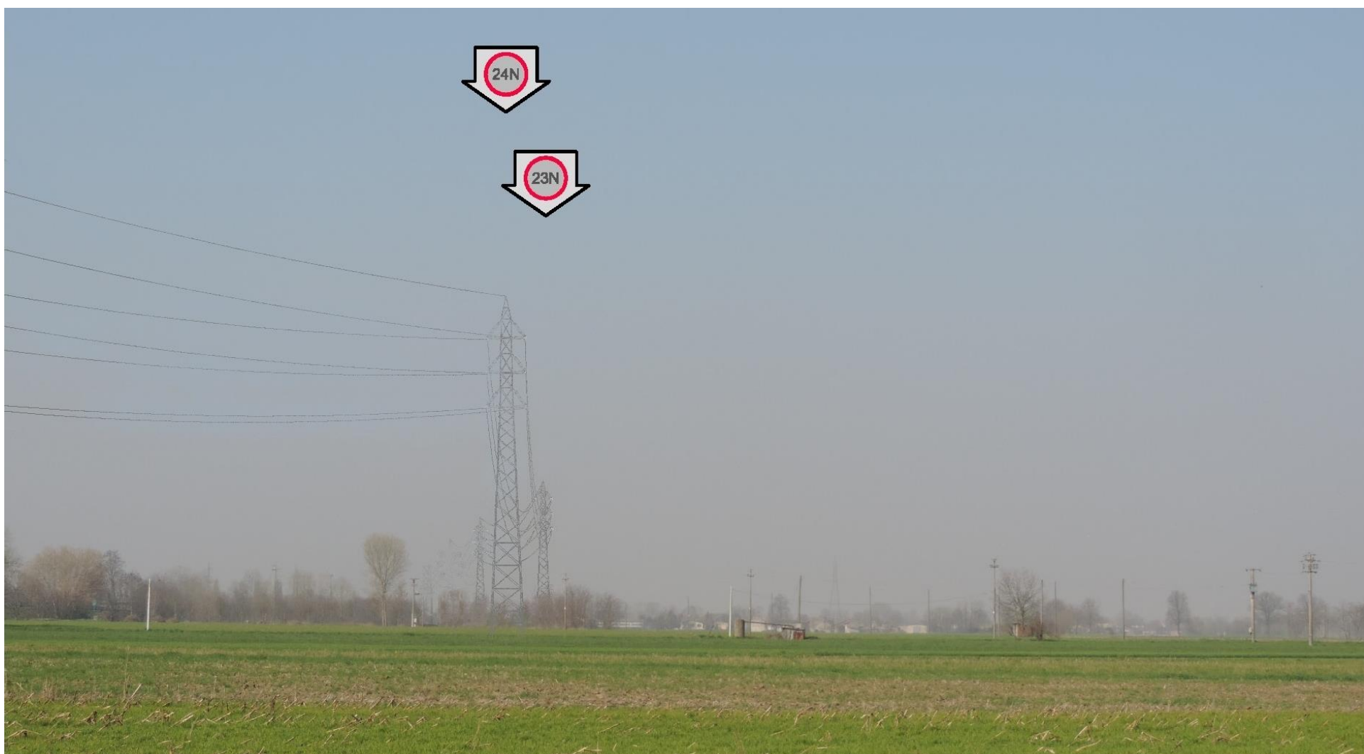
Foto 48 – Vista verso i sostegni 23 e 24. SIMULAZIONE DI INSERIMENTO