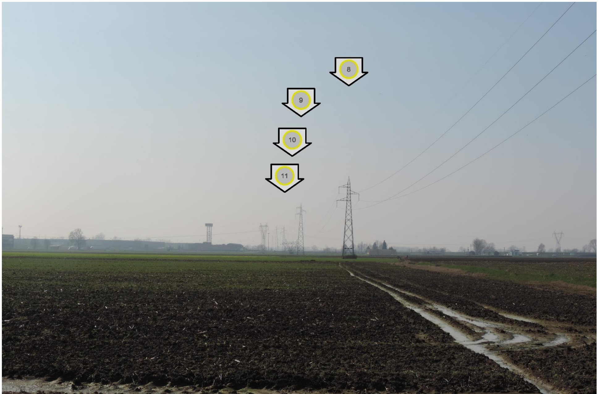
Foto 18b – Dettaglio verso i sostegni 8, 9, 10 e 11. STATO ATTUALE