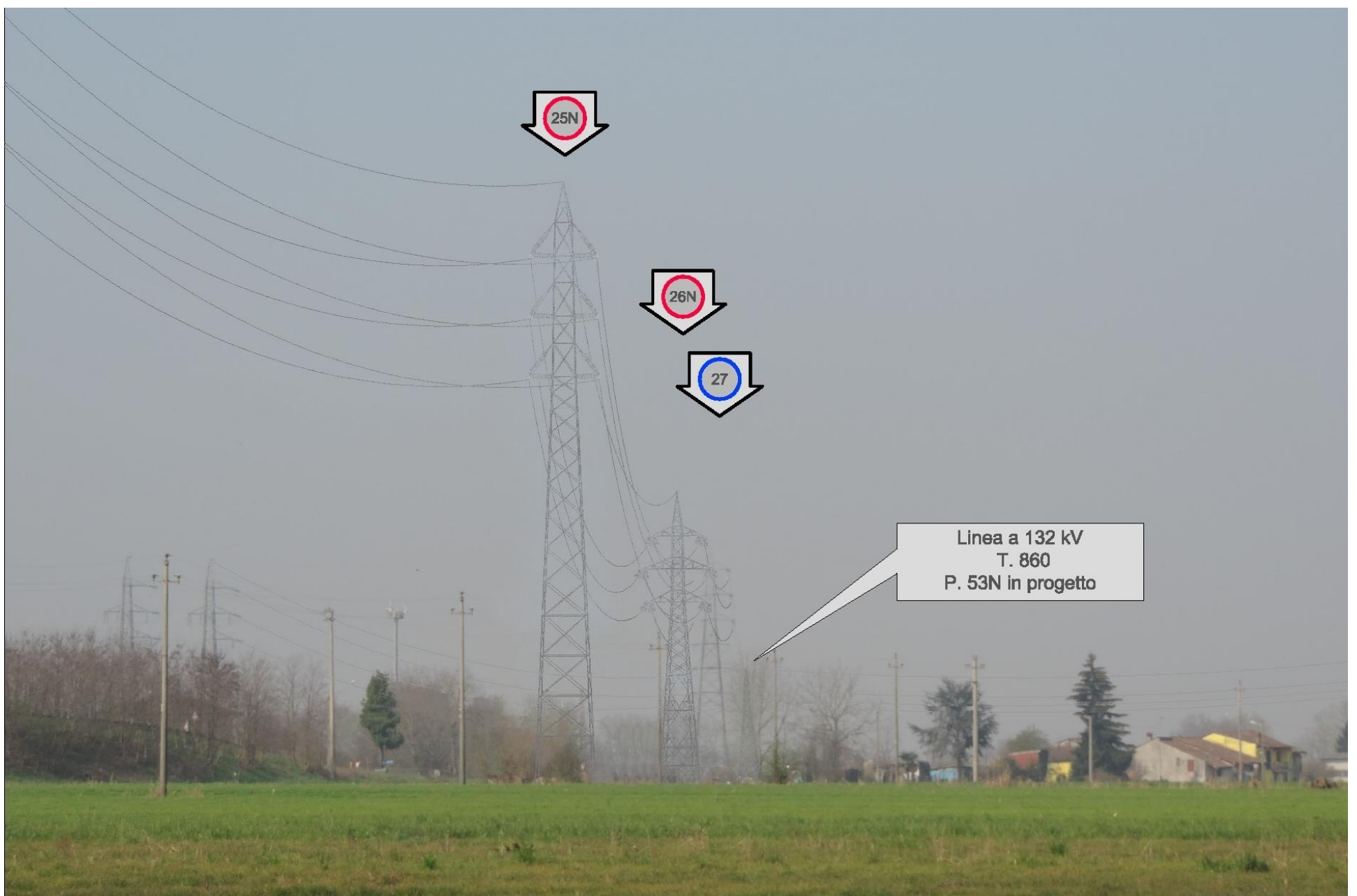
Foto 58 – Vista verso i sostegni 25, 26 e 27. SIMULAZIONE DI INSERIMENTO