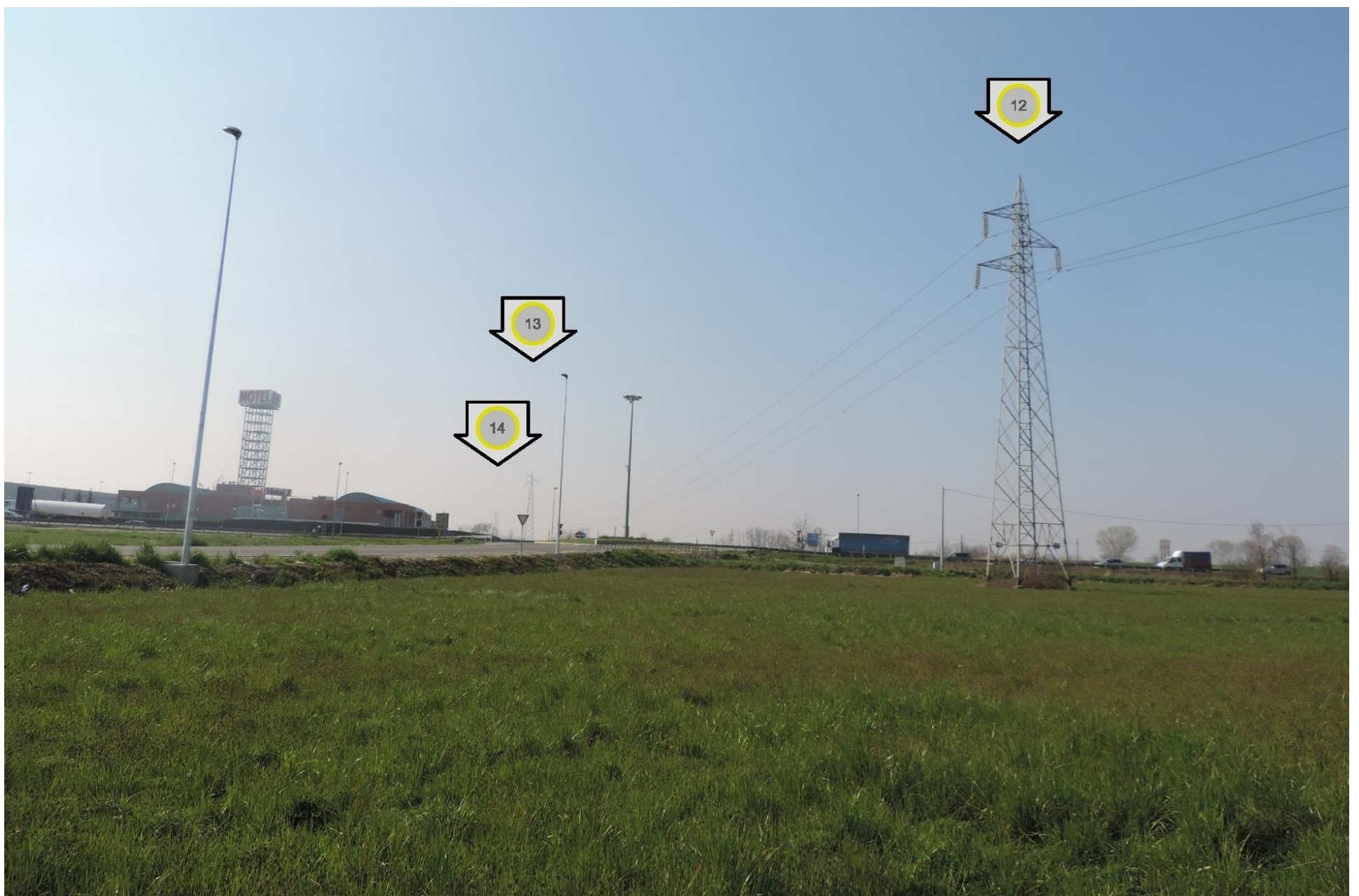
Foto 22 – Vista verso i sostegni 12, 13 e 14 in lontananza. STATO ATTUALE