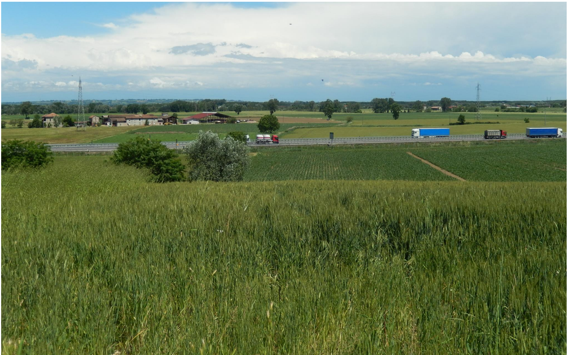
Foto 38a – Vista ravvicinata della campata tra i sostegni 15 e 14. A sinistra dall'autostrada A21 Torino – Piacenza STATO ATTUALE