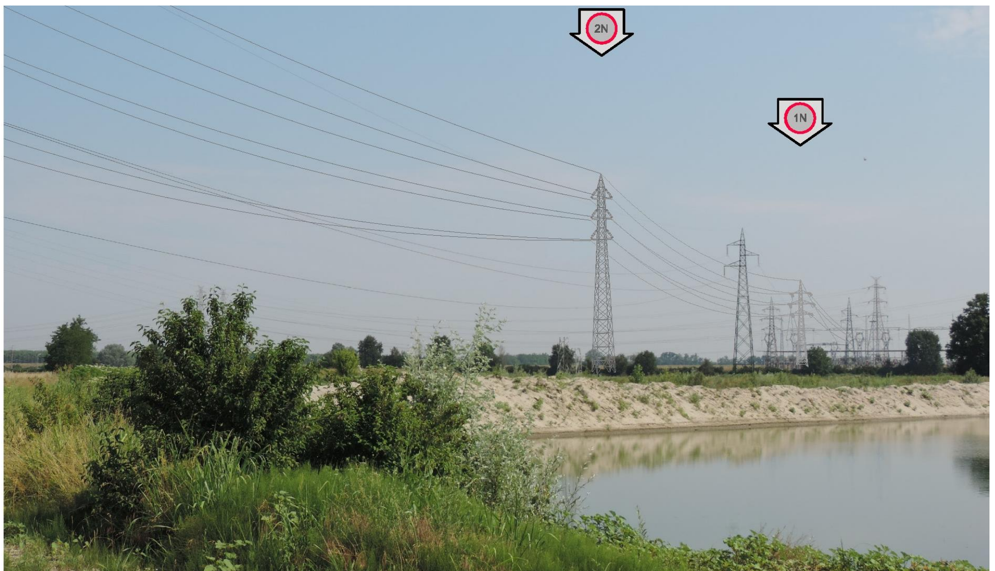
Foto 5 – Vista della campata tra i sostegni n. 1 e 2. In primo piano il lago di cava in località Cascina Ca' Nova. SIMULAZIONE DI INSERIMENTO