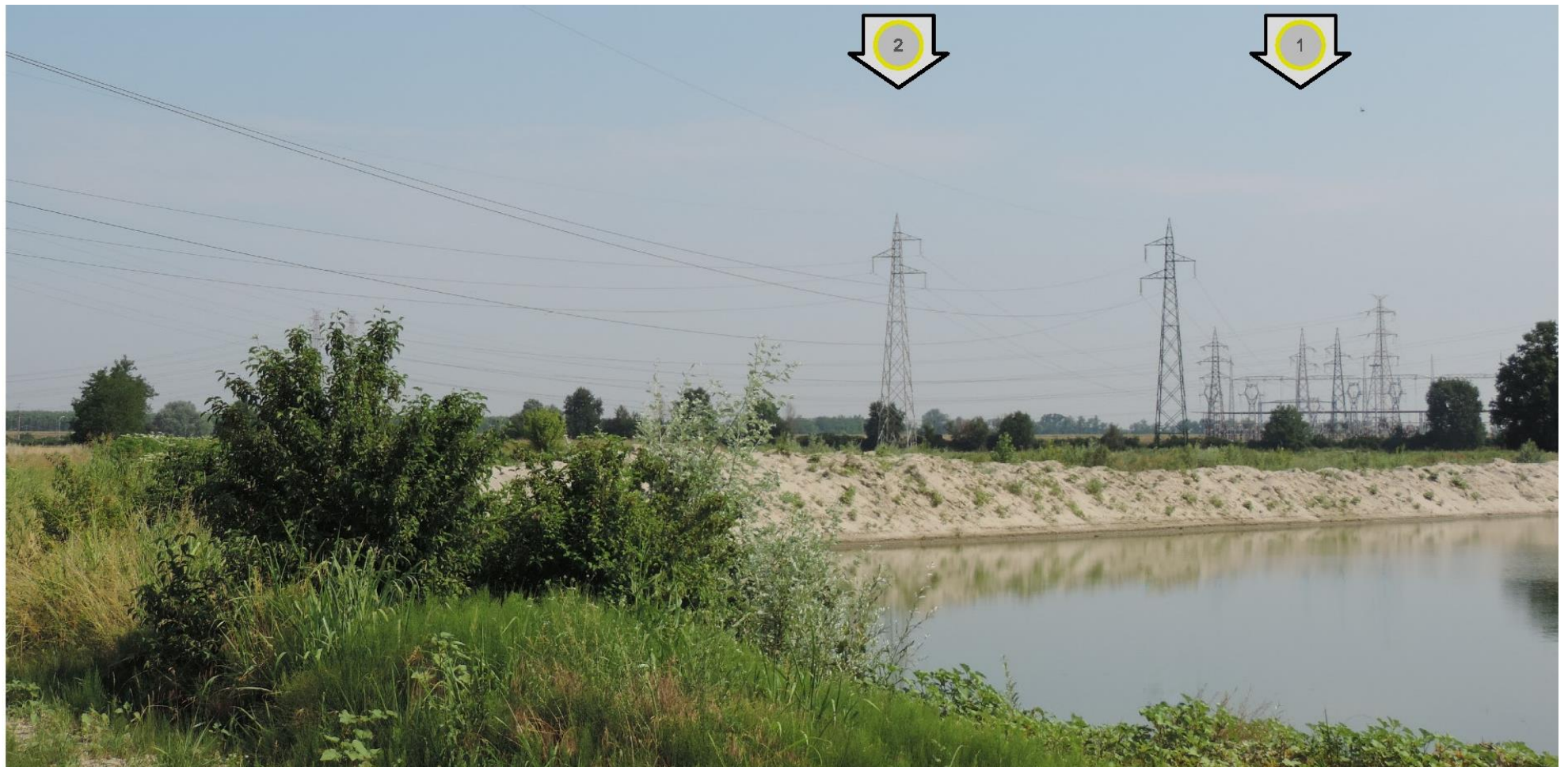
Foto 5 – Vista della campata tra i sostegni n. 1 e 2. In primo piano il lago di cava in località Cascina Ca' Nova. STATO ATTUALE

Si riportano nel seguito alcune simulazioni di inserimento fotografico dell'intervento in esame. Per la localizzazione dei punti di vista si rimanda all'elaborato DE23153D1BBX00120.