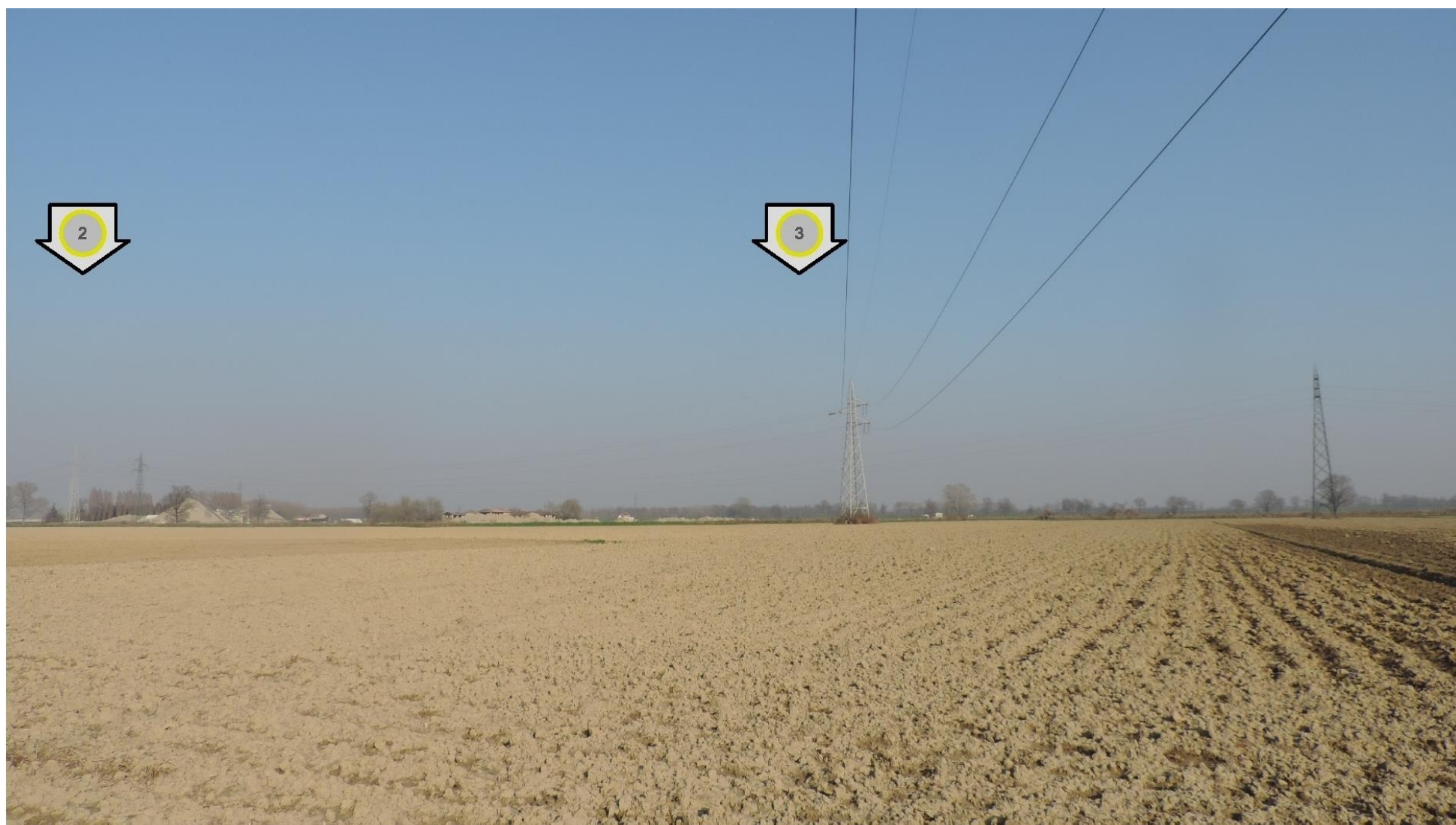
Foto 6 – Vista della campata tra i sostegni n. 2 e 3. STATO ATTUALE