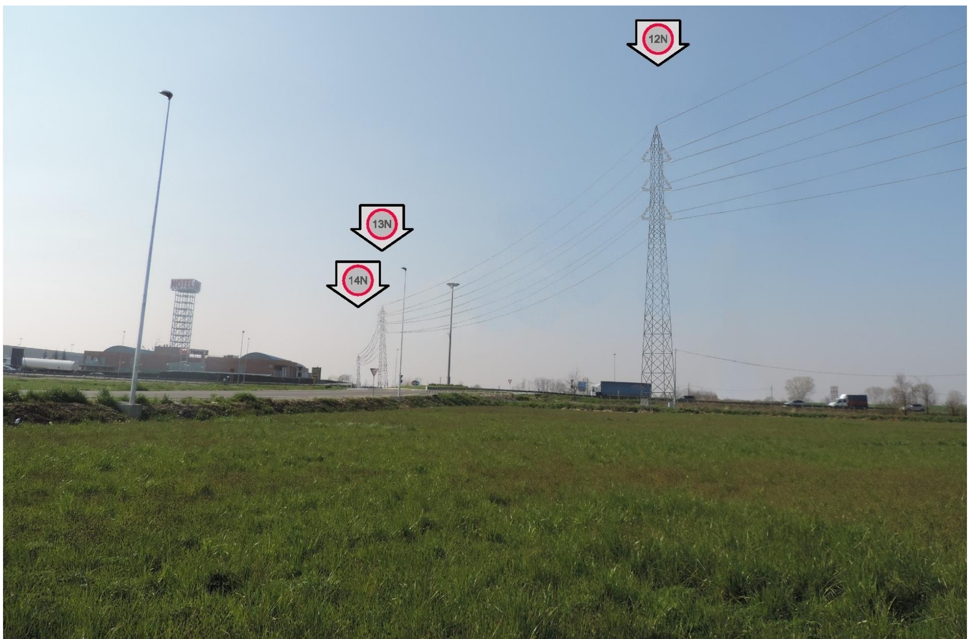
Foto 22 – Vista verso i sostegni 12, 13 e 14 in lontananza. SIMULAZIONE DI INSERIMENTO