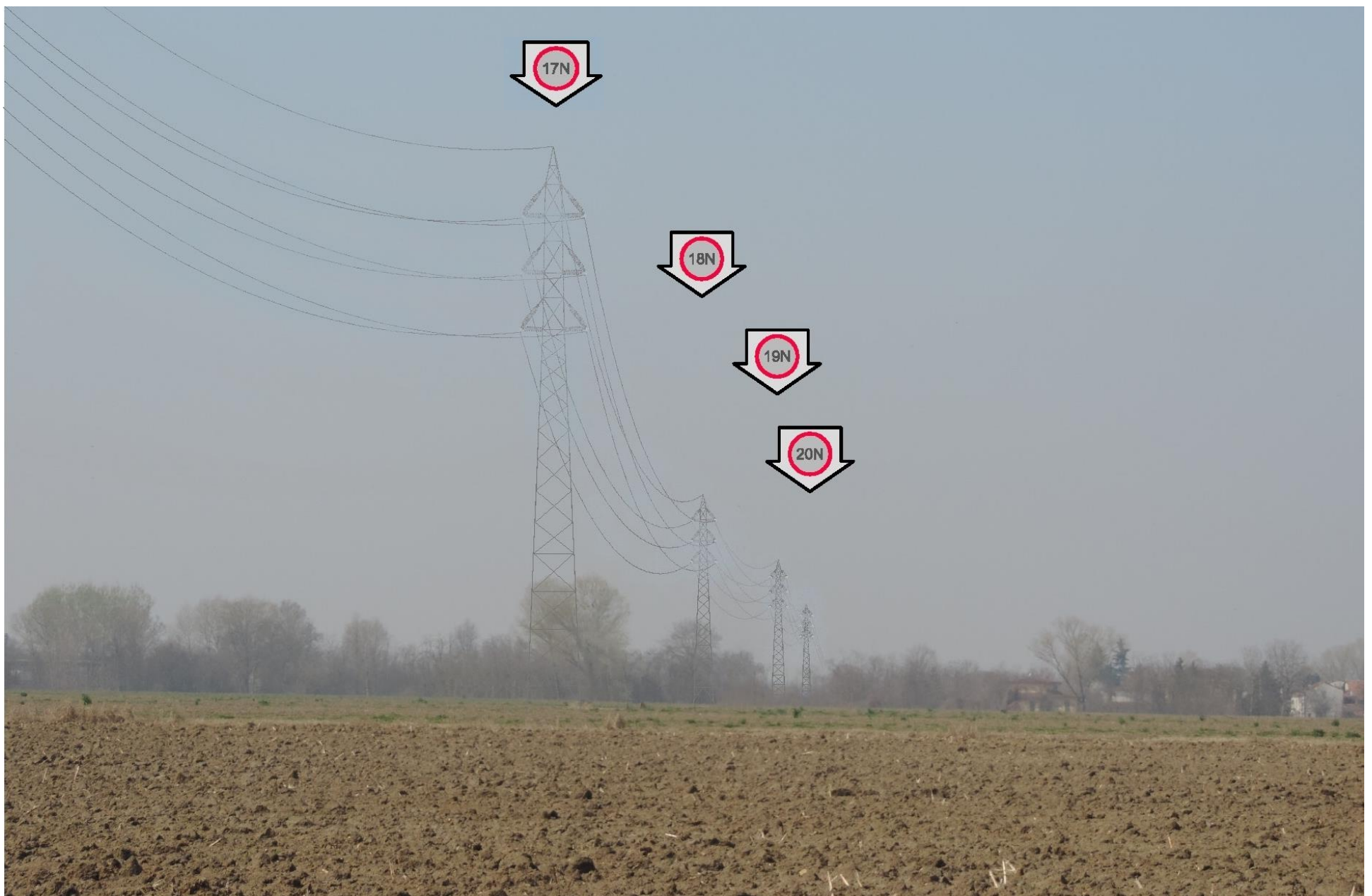
Foto 37 – Vista verso i sostegni 17, 18, 19 e 20. SIMULAZIONE DI INSERIMENTO