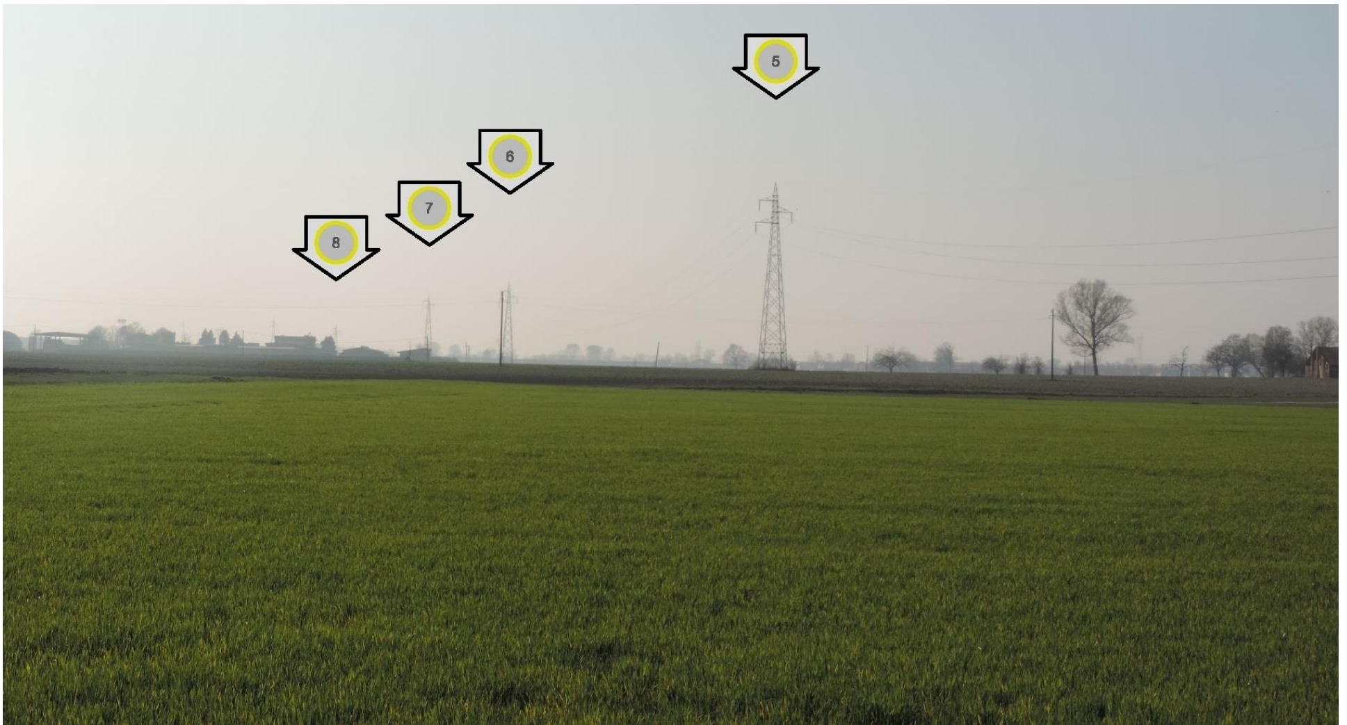
Foto 10 – Vista panoramica della campata tra i sostegni 5, 6, 7. STATO ATTUALE