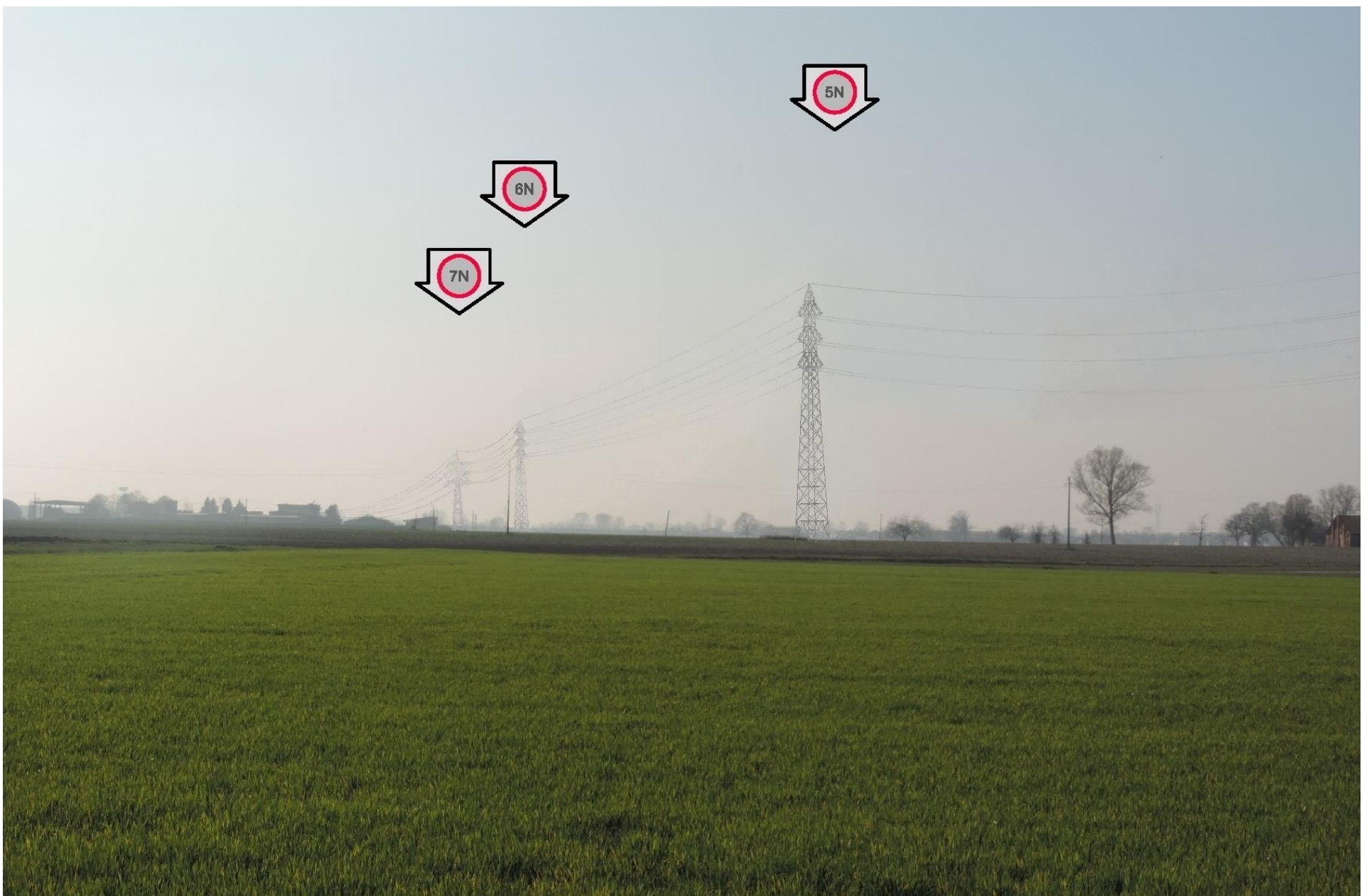
Foto 10 – Vista panoramica della campata tra i sostegni 5, 6, 7. SIMULAZIONE DI INSERIMENTO