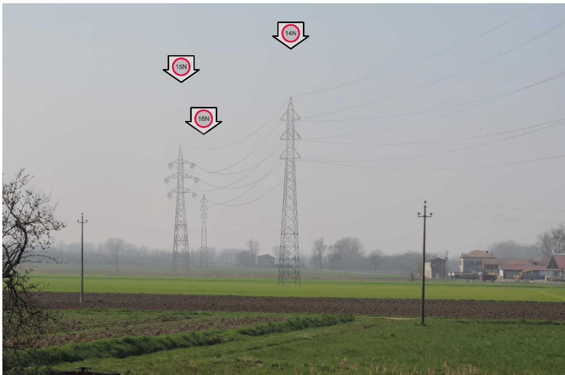
Foto 34 – Vista dei sostegni 14, 15 e 16. SIMULAZIONE DI INSERIMENTO