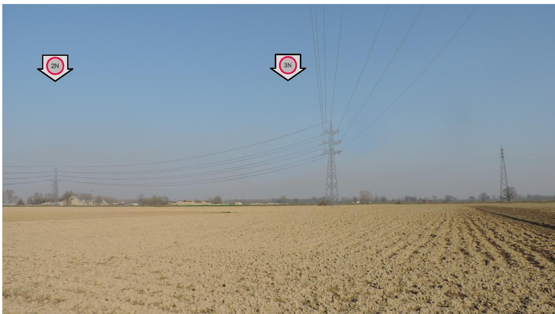
Foto 6 – Vista della campata tra i sostegni n. 2 e 3. SIMULAZIONE DI INSERIMENTO