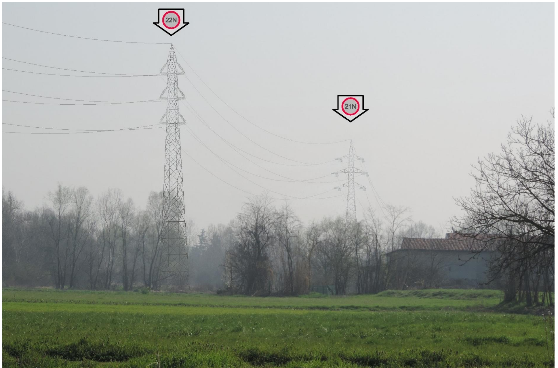
Foto 47 – Vista verso i sostegni 22 e 21. SIMULAZIONE DI INSERIMENTO