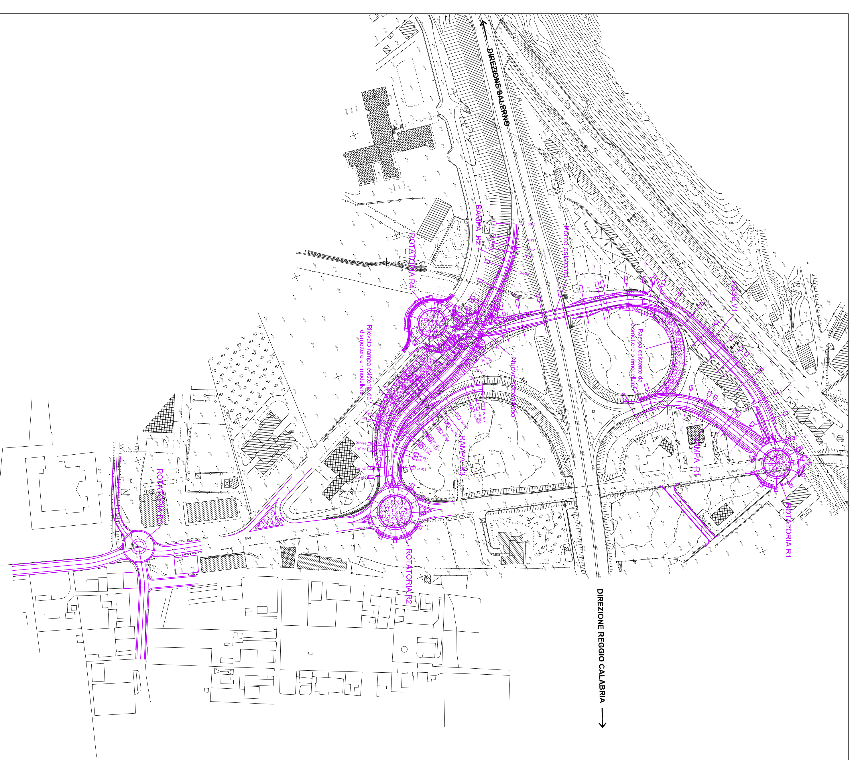
Localizzazione dell'intervento su cartografia, scala 1:2000