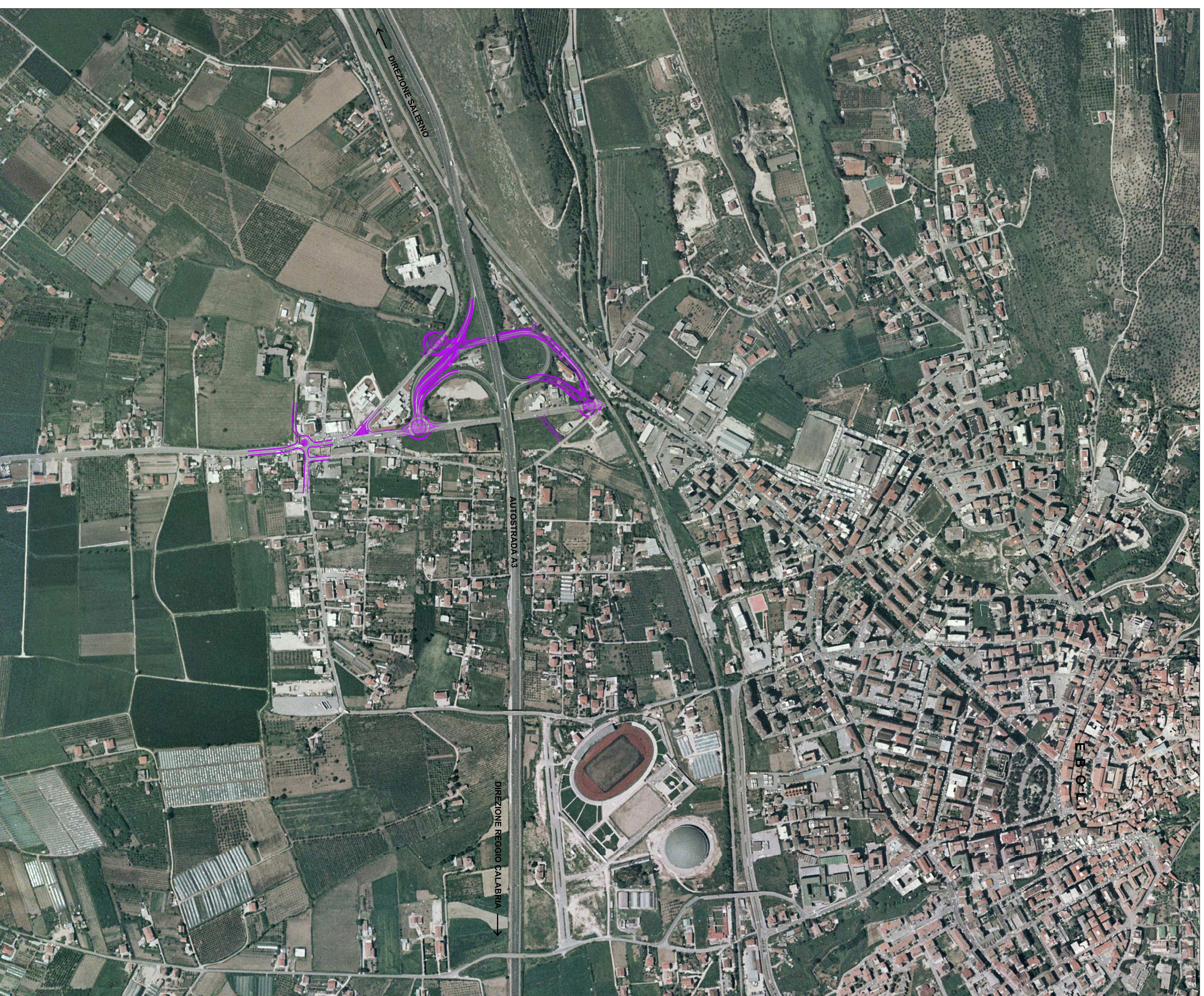
Localizzazione geografica dell'intervento su ortofoto, scala 1:5000