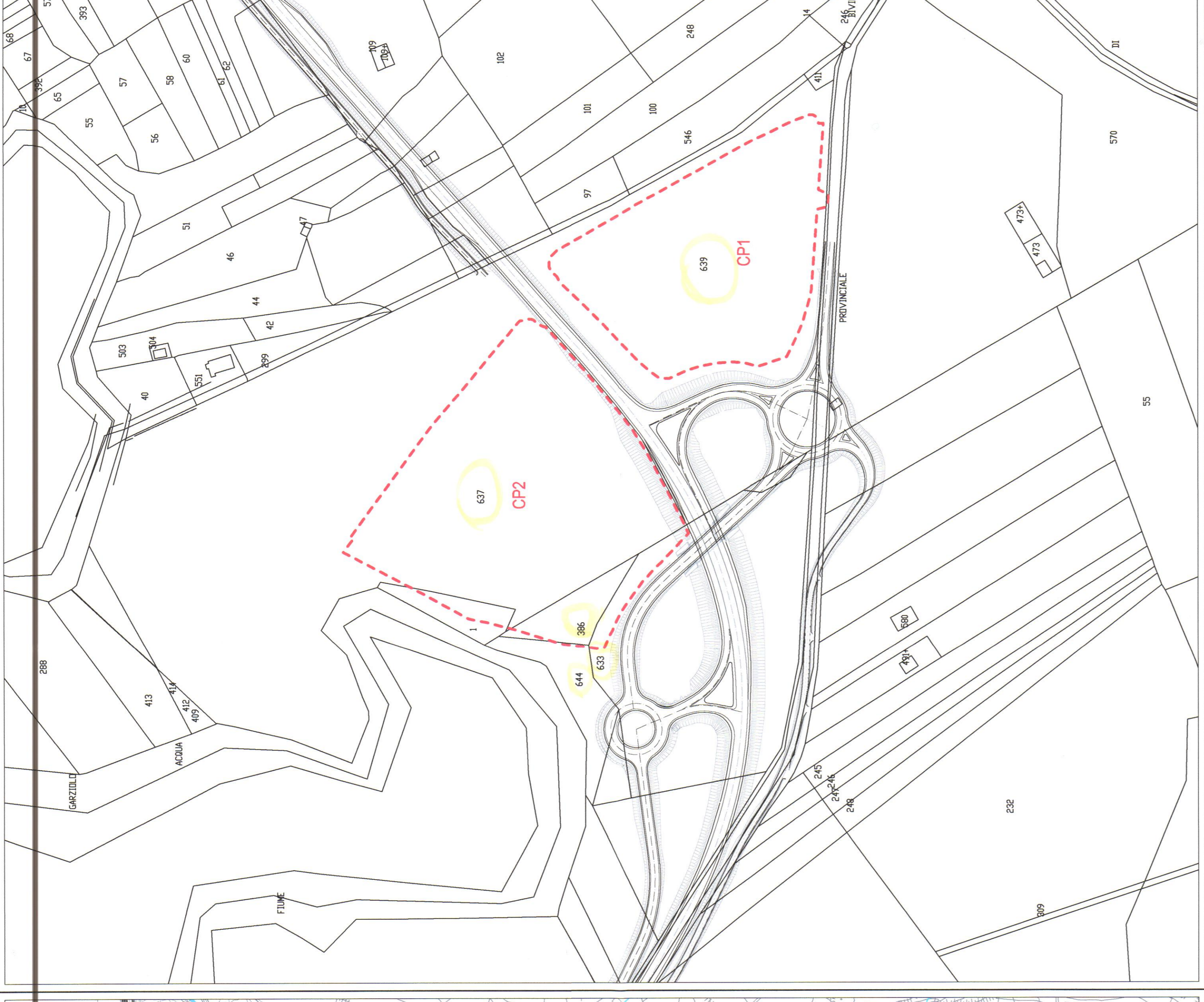
PIANO STRALCIO DI BACINO PER L'ASSETTO IDROGEOLOGICO (P.A.I.) CARTA DELLE PERICOLOSITÀ E DEL RISCHIO GEOMORFOLOGICO SCALA 1:5.000