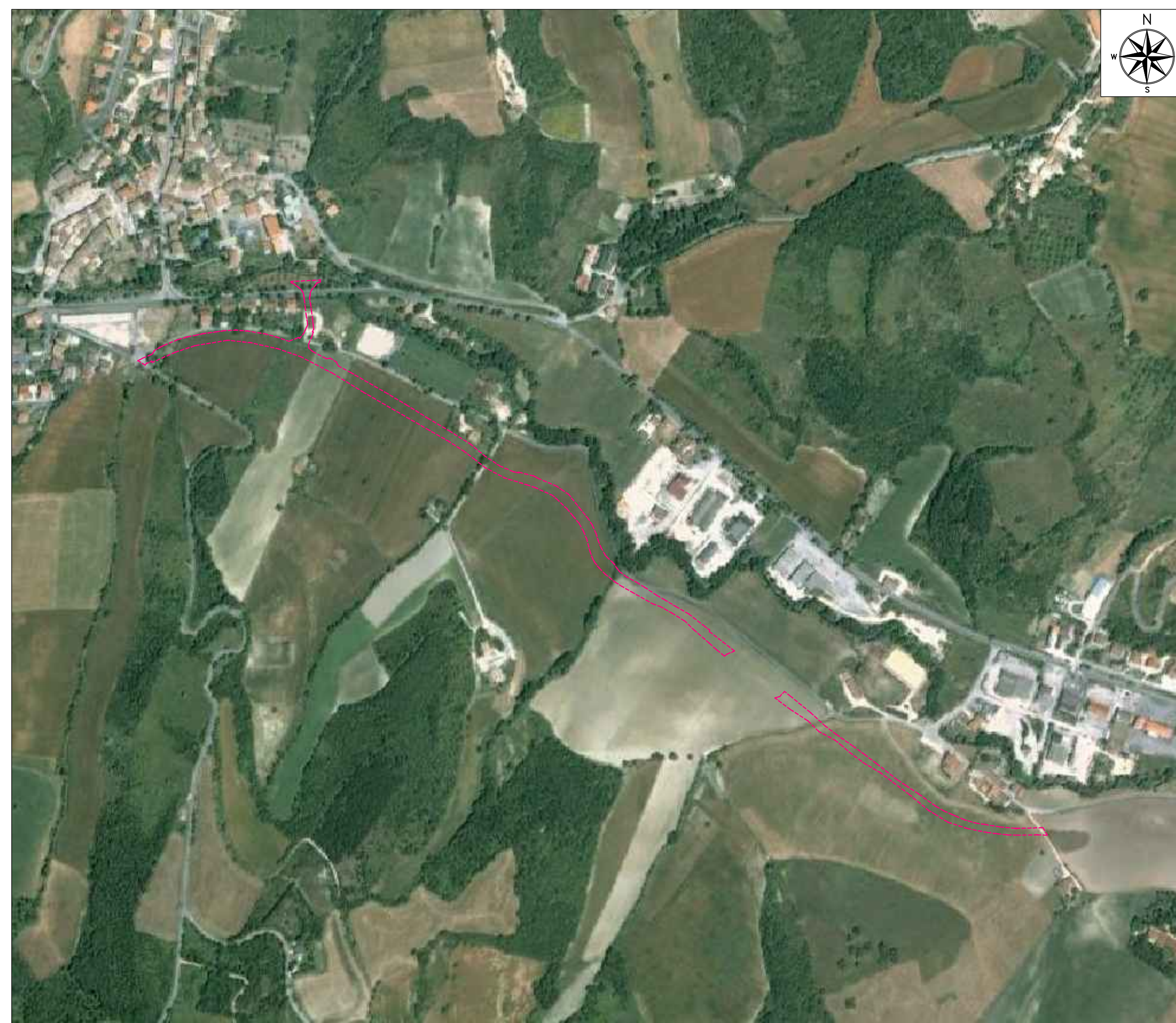
ORTOFOTO DI INQUADRAMENTO - SCALA 1:5000