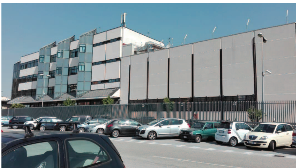
Figura 1 – Posto Centrale SCC Nodo di Napoli

Il Posto Centrale SCC ed il Posto Centrale CTC Caserta-Foggia sono ubicati nel fabbricato SCC di Napoli Centrale.