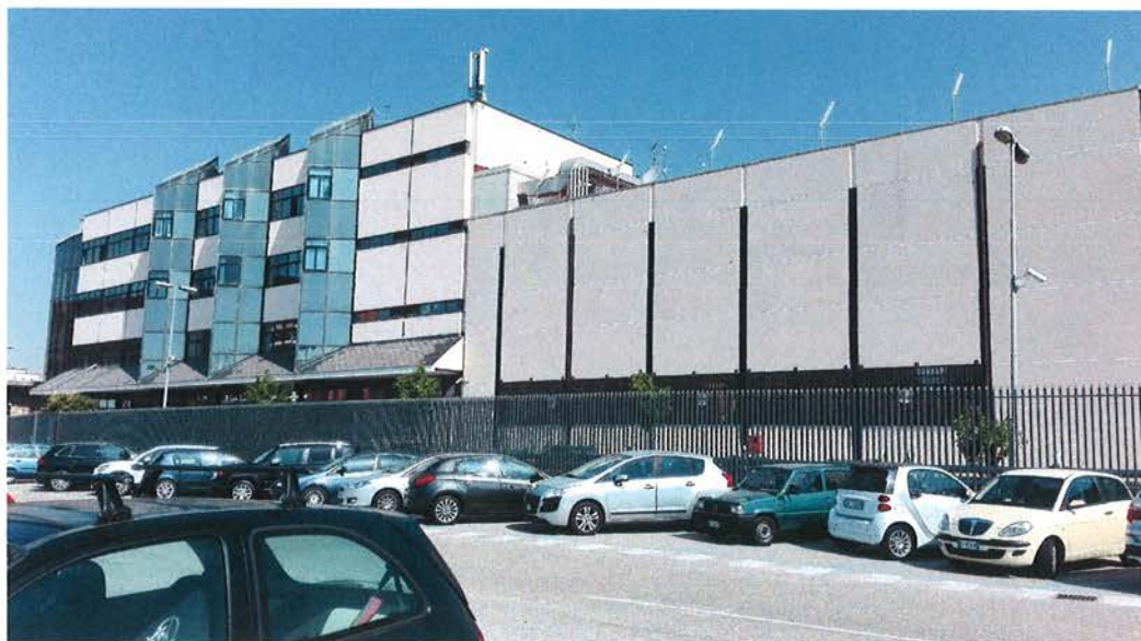
Figura 1 – Posto Centrale SCC Nodo di Napoli

Il Posto Centrale SCC ed il Posto Centrale CTC Caserta-Foggia sono ubicati nel fabbricato SCC di Napoli Centrale.