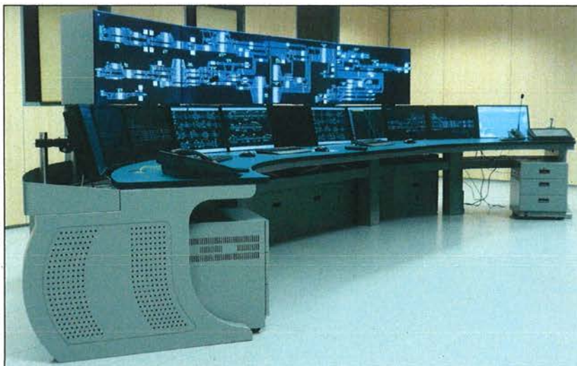
Figura 3 – Torino-Padova: postazione ACC-M/SCCM