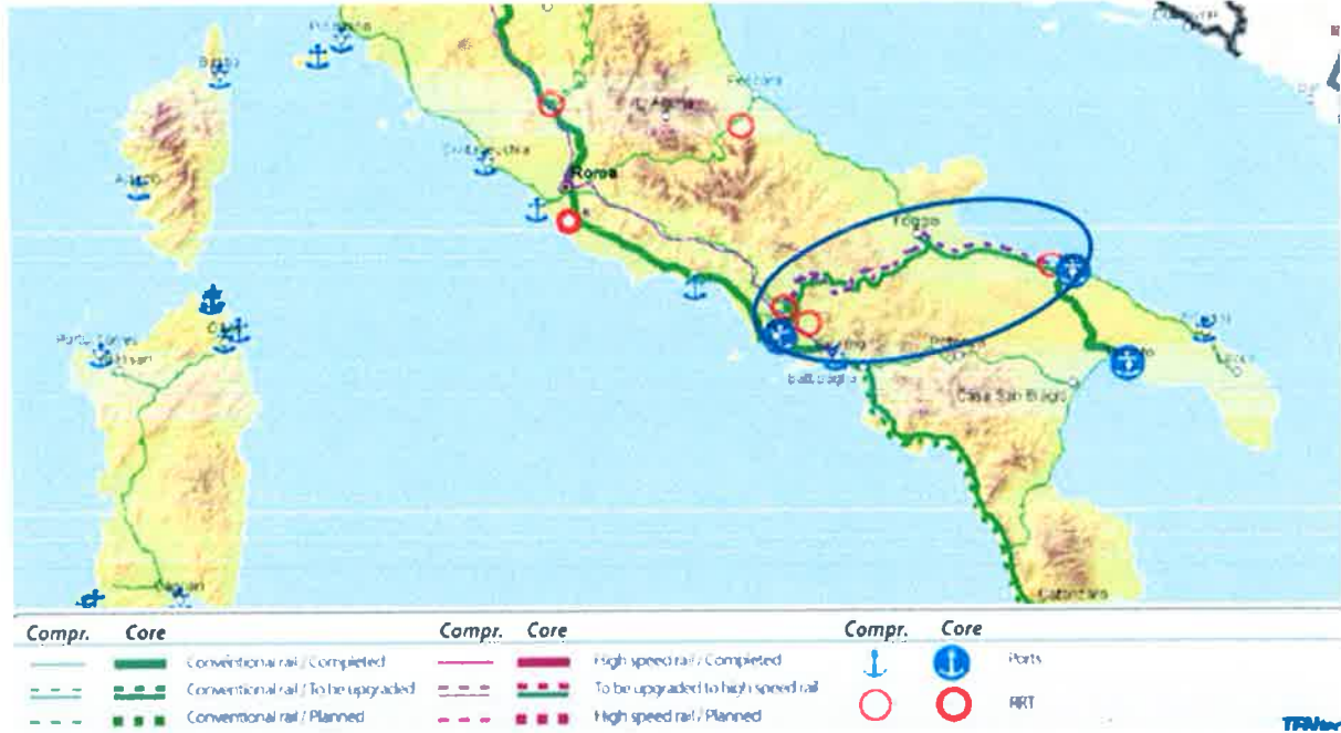
Figura 1 – Estratto della rete TEN da Regolamento (UE) 1315 del 11/12/13 (traffico merci)