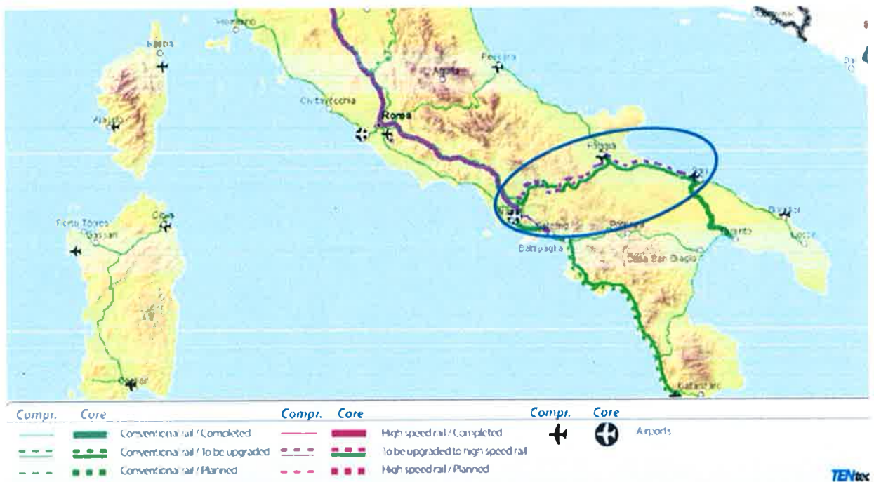
Figura 2 – Estratto della rete TEN da Regolamento (UE) 1315 del 11/12/13 (traffico passeggeri)