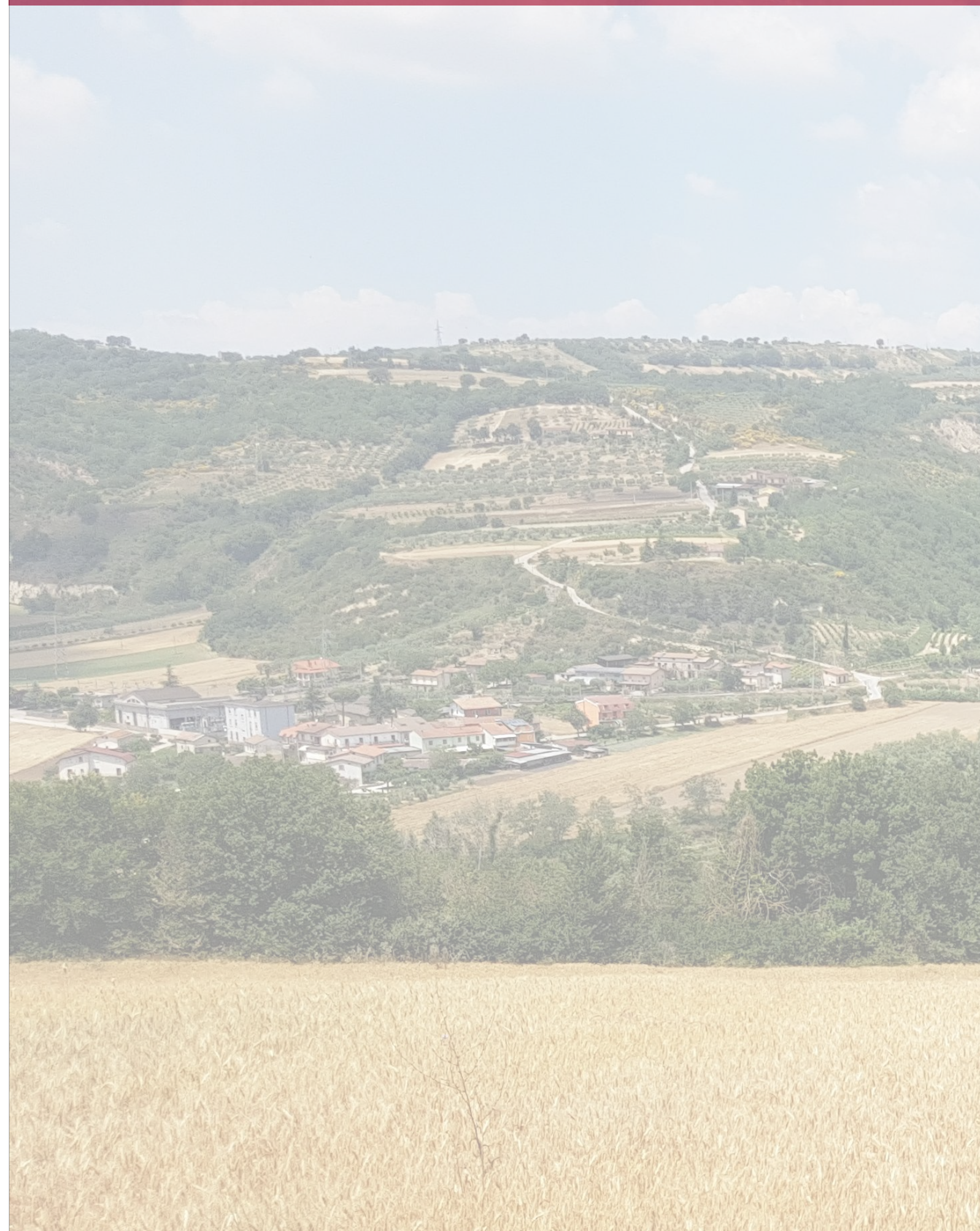
Inserimento dell'opera nel territorio