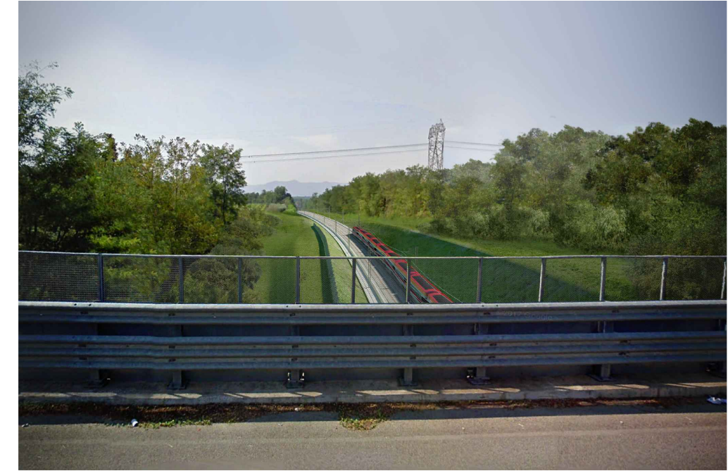
STATO ANTE OPERAM