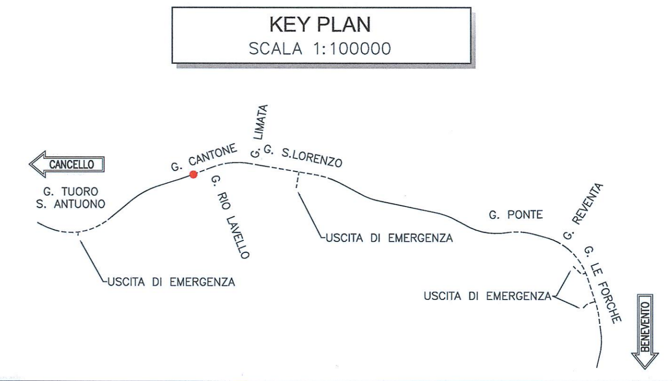
KEY PLAN SCALA 1:100000