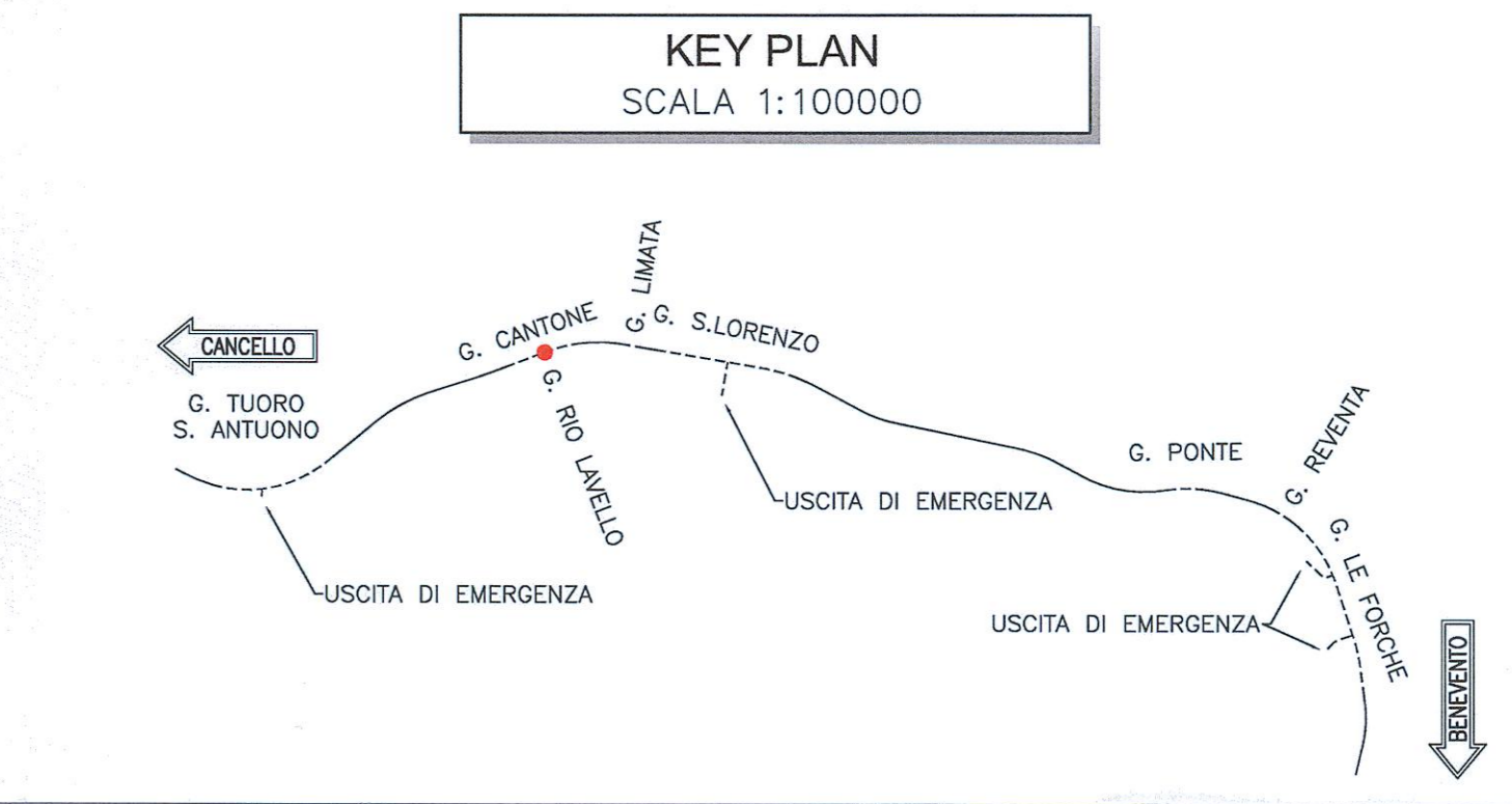
KEY PLAN SCALA 1:100000

NOTE - EVENTUALI DIFFERENZE TRA LE MISURE TOTALI E LE SOMMATORIE DELLE MISURE PARZIALI SONO DOVUTE AGLI ARROTONDAMENTI AUTOMATICI DI AUTOCAD - PER LA SISTEMAZIONE PROVVISORIA DEL RIO LAVELLO SI RIMANDA AI RELATIVI ELABORATI SPECIALISTICI