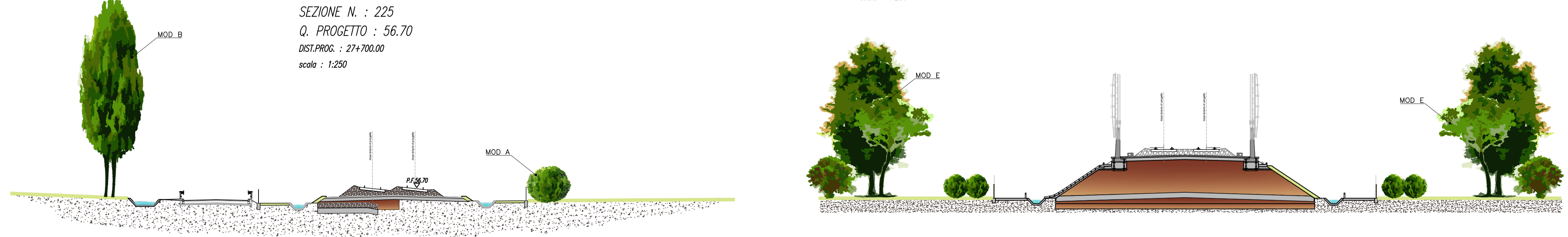
SEZIONE N. : 225 Q. PROGETTO : 56.70 DST.PROG. : 27+700.00 scala : 1:250

COMMITTENTE: RETE FERROVIARIA ITALIANA GRUPPO FERROVIE DELLO STATO ITALIANE