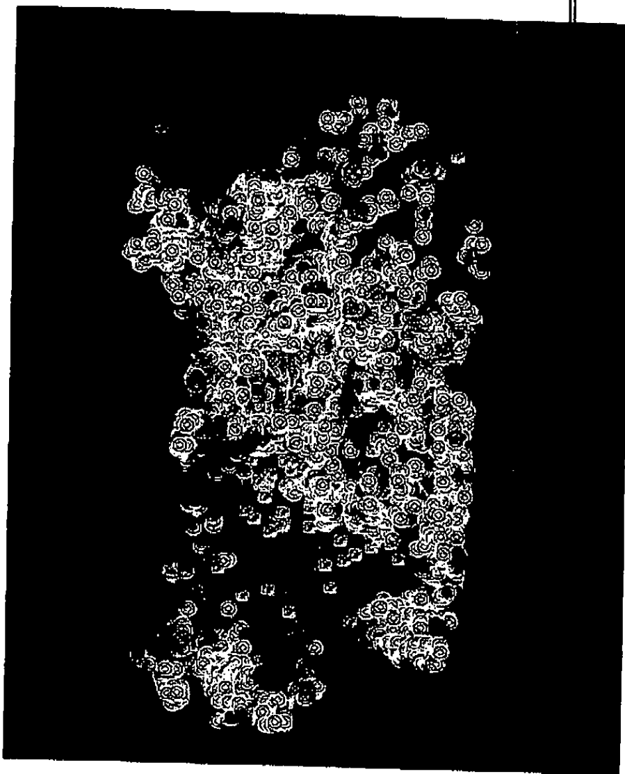
Carta dei beni archeologici e identitari

Si tratta, dunque, di zone ad elevato interesse archeologico, attrezzate per lo studio e per il turismo culturale. In Sardegna, vero e proprio "museo a cielo aperto", sono ormai numerose le aree che rispondono a questa definizione: i complessi nuragici di Su Nuraxi di Barumini, Genna Maria di Villanovaforru, Arrubiu di Orroli, Santa Vittoria di Serri, Santu Antine di Torralba, Santa Cristina di Paulilatino, le città fenicio-puniche di Nora, Tharros, Sant'Antioco, i monumenti romani, bizantini e giudicali di Cagliari e Porto Torres, gli scavi di Sant'Eulalia a Cagliari, rappresentano solo alcuni esempi, fra i tanti e più significativi, presenti nell'isola. Gli esempi sono tali e tanti che non esiste un angolo di Sardegna che non possa essere considerato un sito archeologico o che non contenga un bene identitario.