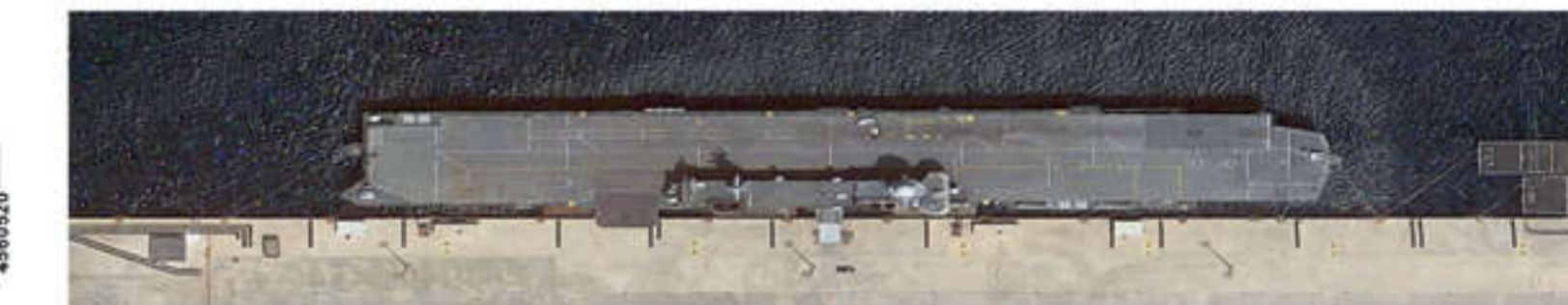
SEQUENZA FOTO DEL MOLO SUD OGGETTO DEL PROGETTO DI ADEGUAMENTO FUNZIONALE