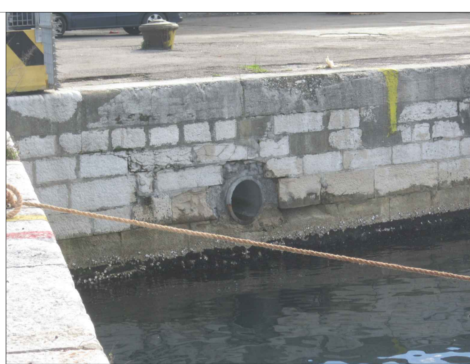
Scarico idrico esistente S2 (~ +1.00 mslm)