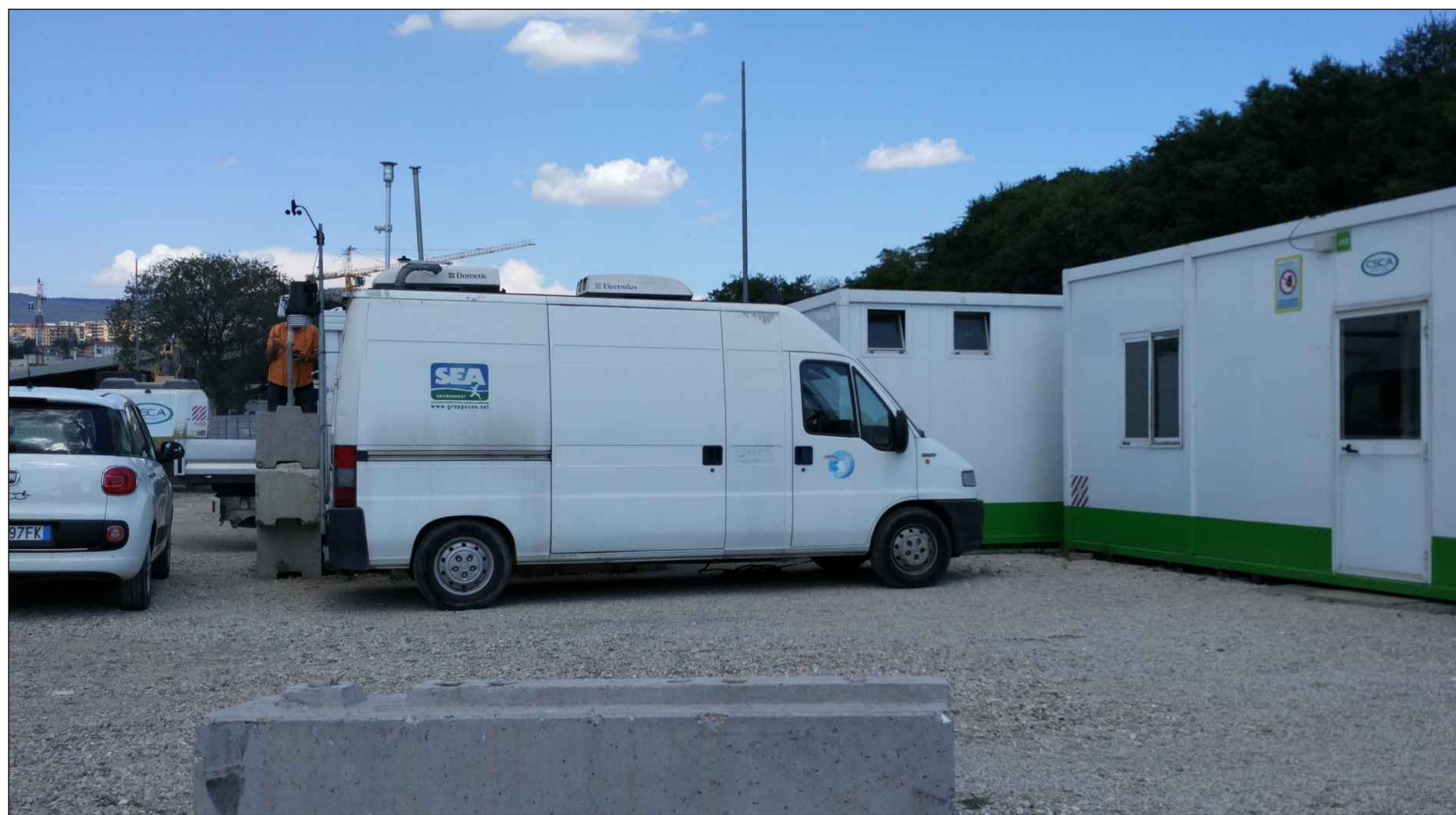
stazione mobile di monitoraggio della qualità dell'aria