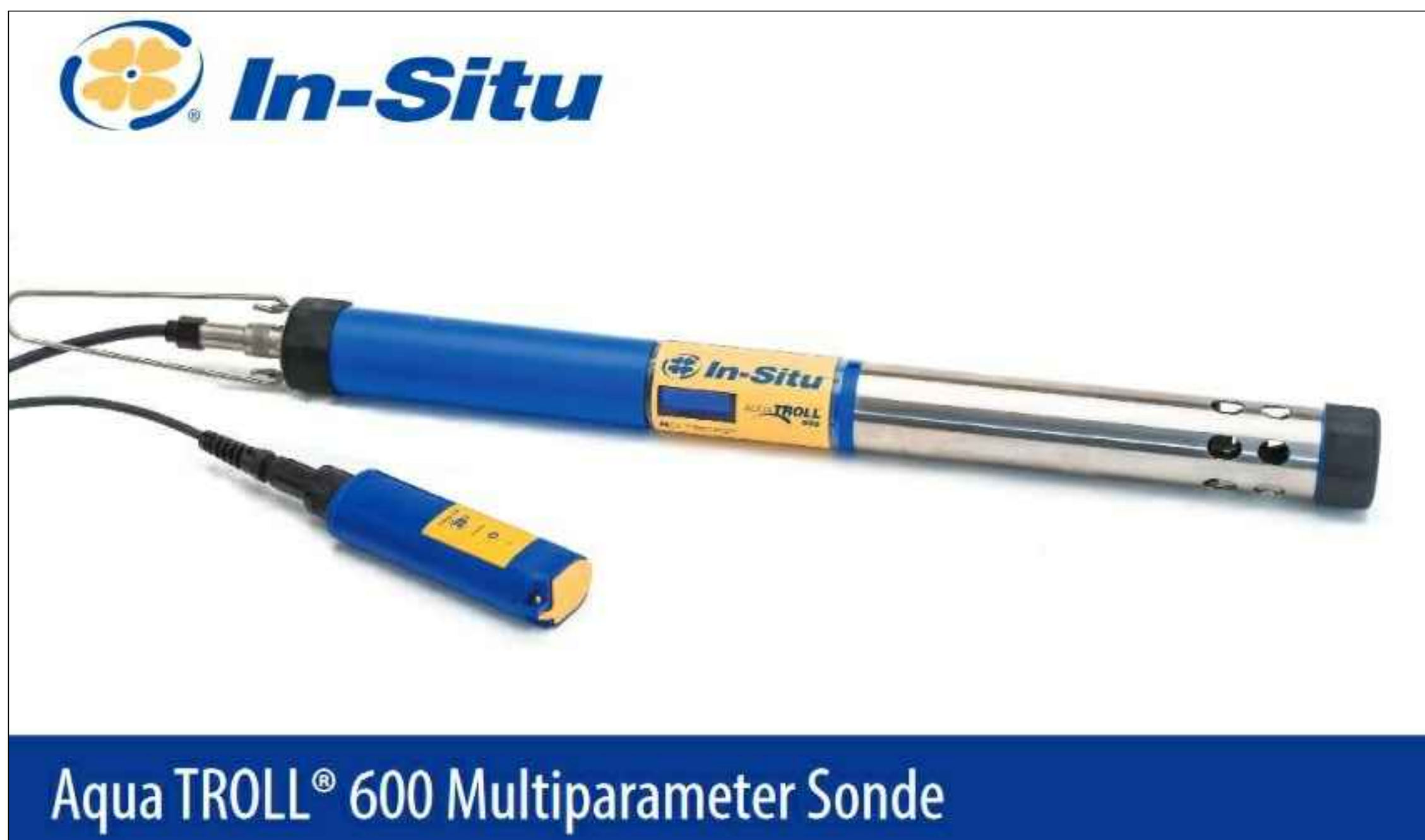
sonda multiparametrica (torbidità, pH, temperatura, conducibilità, OD e livello)