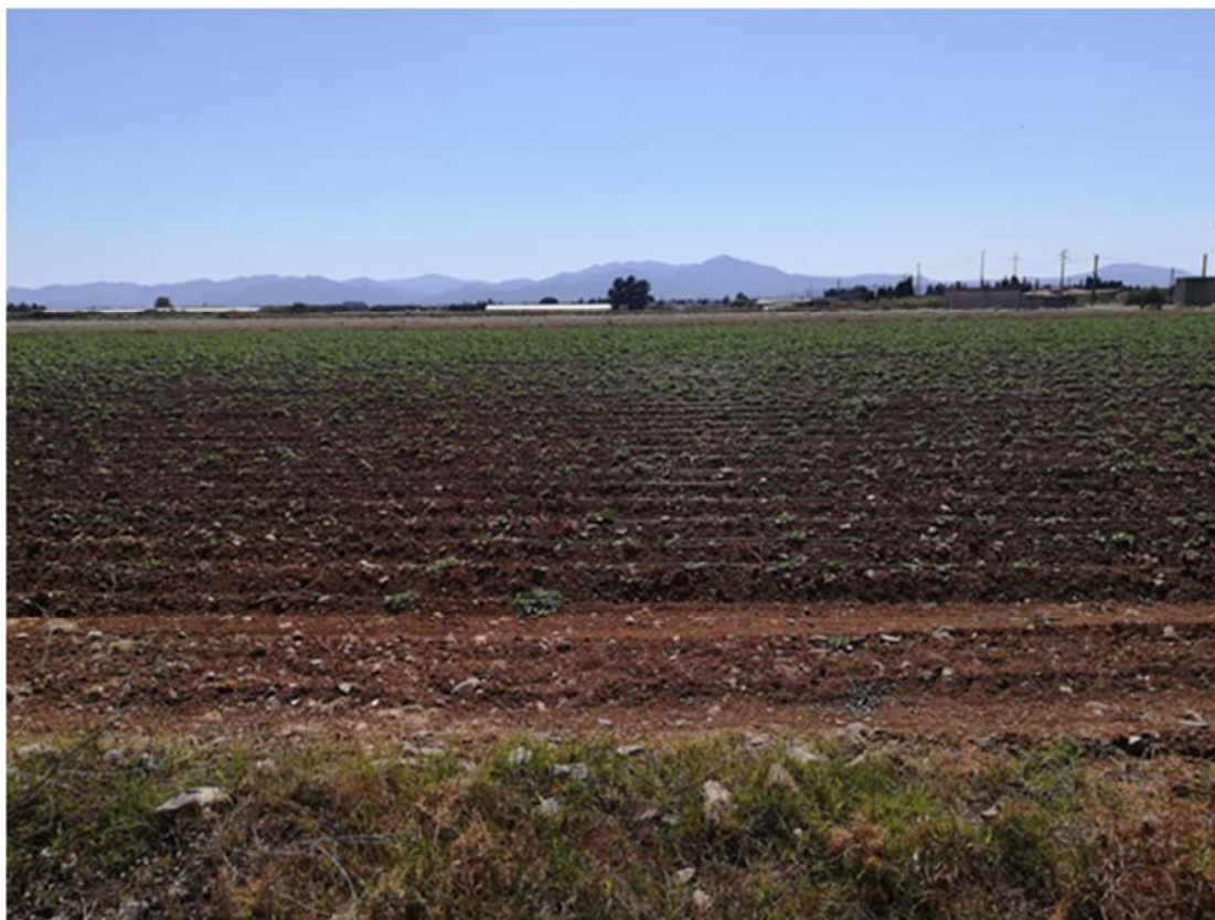
Foto 2.3/A: Aree destinate alle colture seminative nel territorio di Assemini

Le immagini fotografiche che illustrano il contesto paesaggistico, la vegetazione e l'uso del suolo, in cui gli interventi si inseriscono è riportata nell'elaborato grafico allegato (vedi Vol. 7, All. 8 - "Documentazione fotografica", Dis. DF-402).