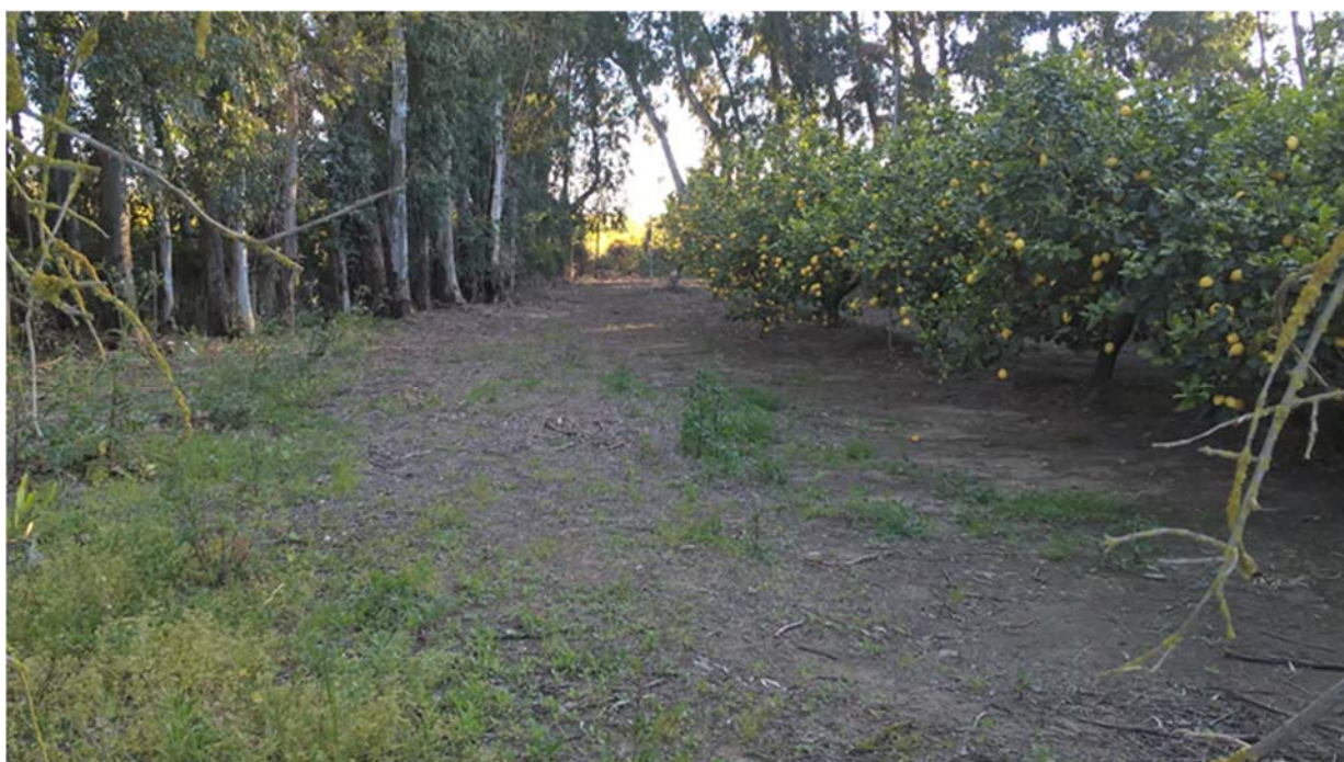
Foto 3.3/B Aree destinate a frutteti e frutti minori nel territorio di Serramanna