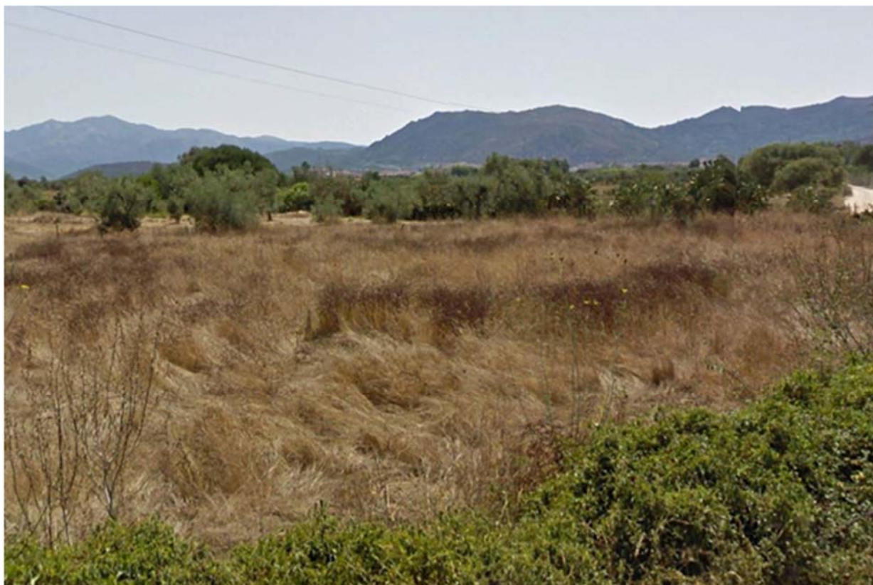
Foto 6.3/B: Seminativi con oliveti sullo sfondo nel territorio di Guspini