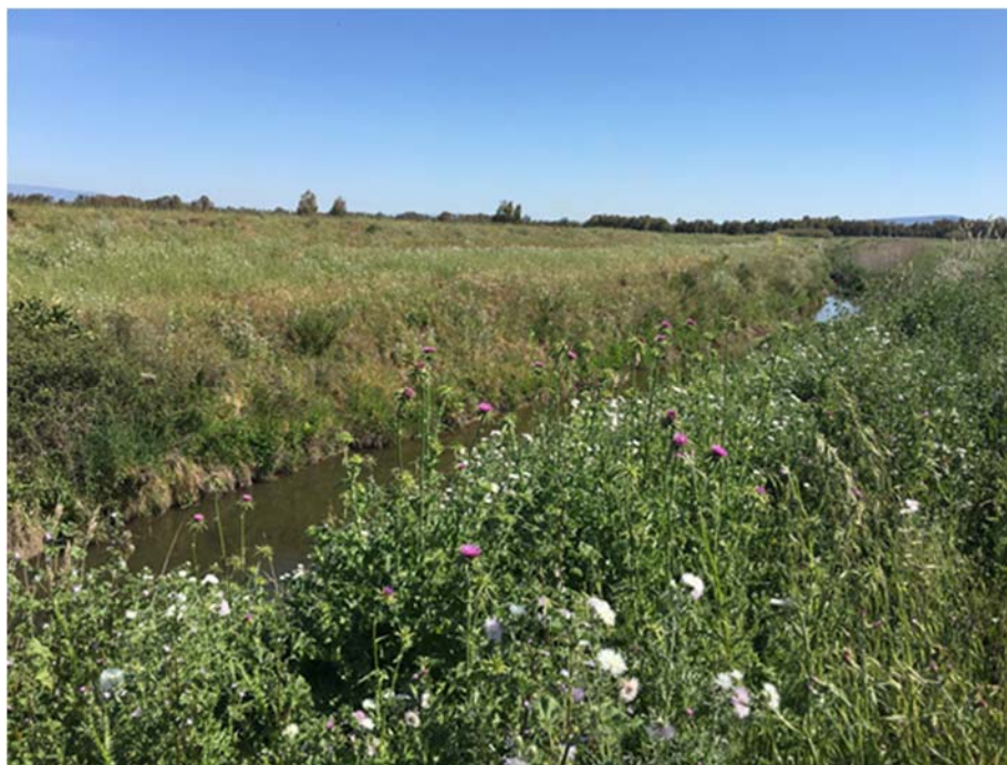
Foto 8.3/A: Attraversamento del Riu Merd'e Cani nel territorio di Palmas Arborea