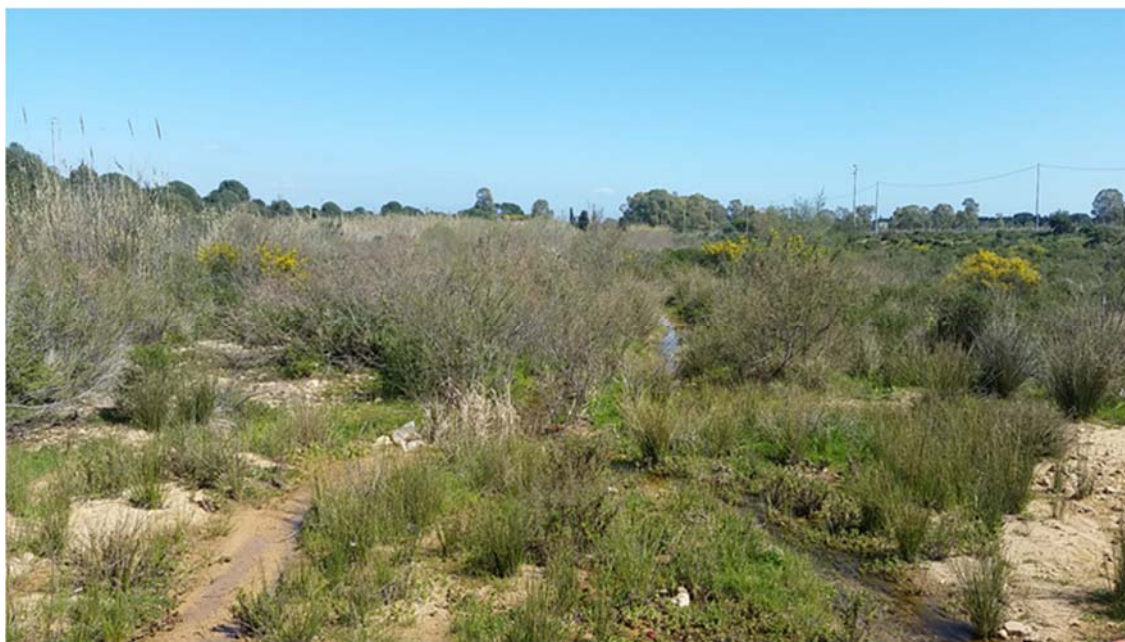
Foto 1.3/B: Aree destinate a ricolonizzazione naturale nel territorio di Uta