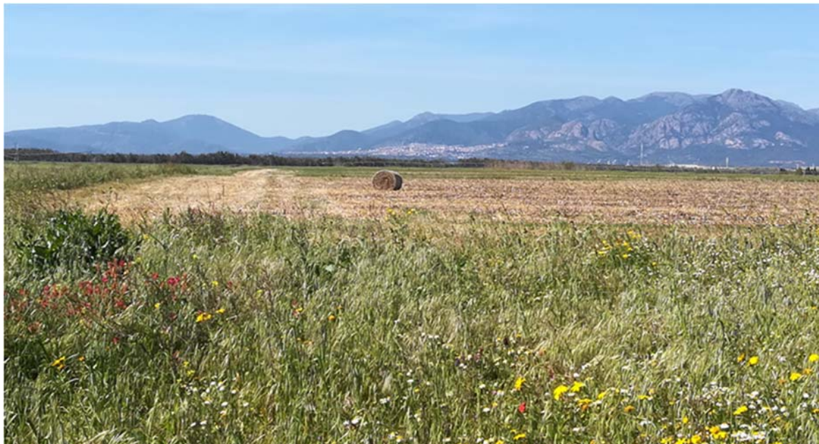
Foto 5.3/B: Aree destinate alle colture seminative nel territorio di San Gavino Monreale