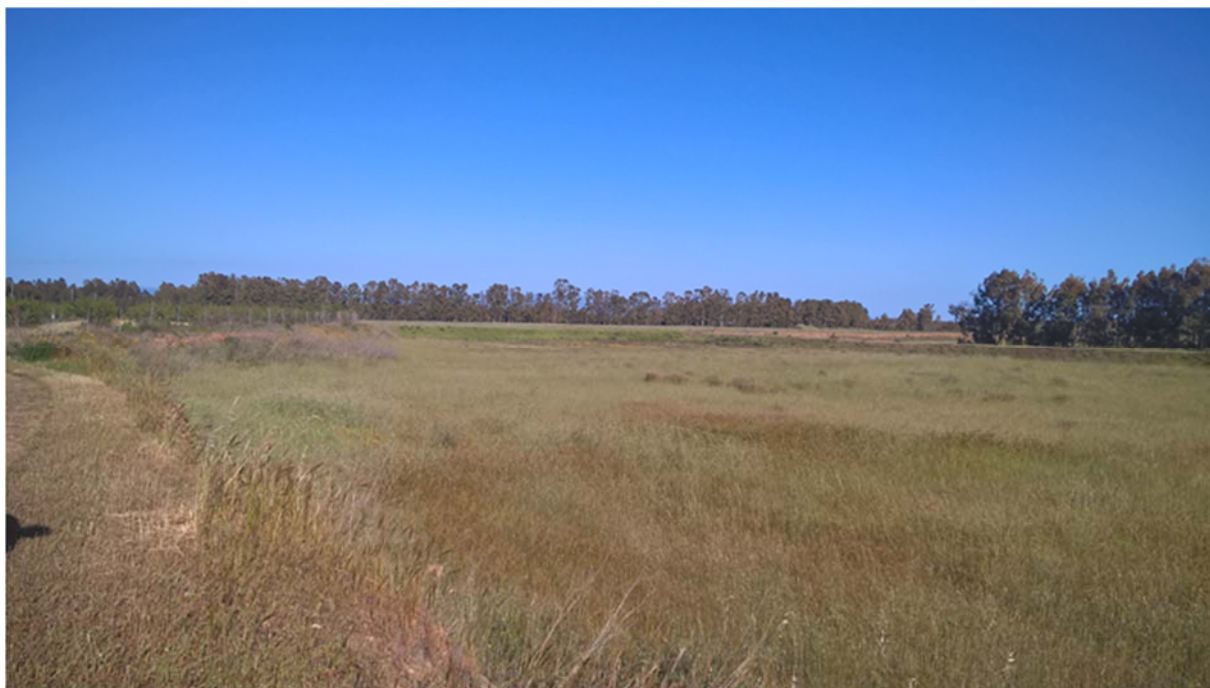
Foto 3.3/A: Seminativi semplici e colture a pieno campo nel territorio di Serramanna