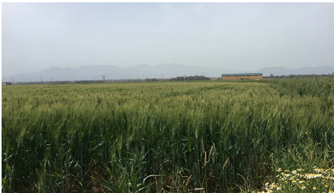
Foto 6.3/A: Seminativi in aree non irrigue nel territorio di Pabillonis

Le immagini fotografiche che illustrano il contesto paesaggistico, la vegetazione e l'uso del suolo, in cui gli interventi si inseriscono è riportata nell'elaborato grafico allegato (vedi Vol. 7, All. 8 - "Documentazione fotografica" - Dis. DF-406).