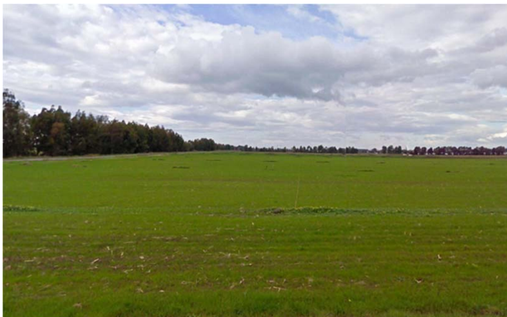
Foto 7.3/B: Seminativi in aree non irrigue nel territorio di Uras