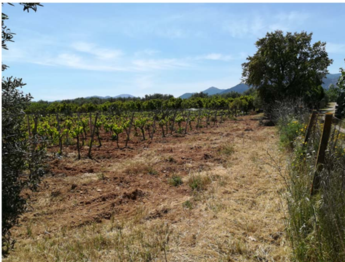
Foto 4.3/A: Aree destinate alla viticoltura nel territorio di Villacidro

Le immagini fotografiche che illustrano il contesto paesaggistico, la vegetazione e l'uso del suolo, in cui gli interventi si inseriscono è riportata nell'elaborato grafico allegato (vedi Vol. 7, All. 8 - "Documentazione fotografica" - Dis. DF-404).