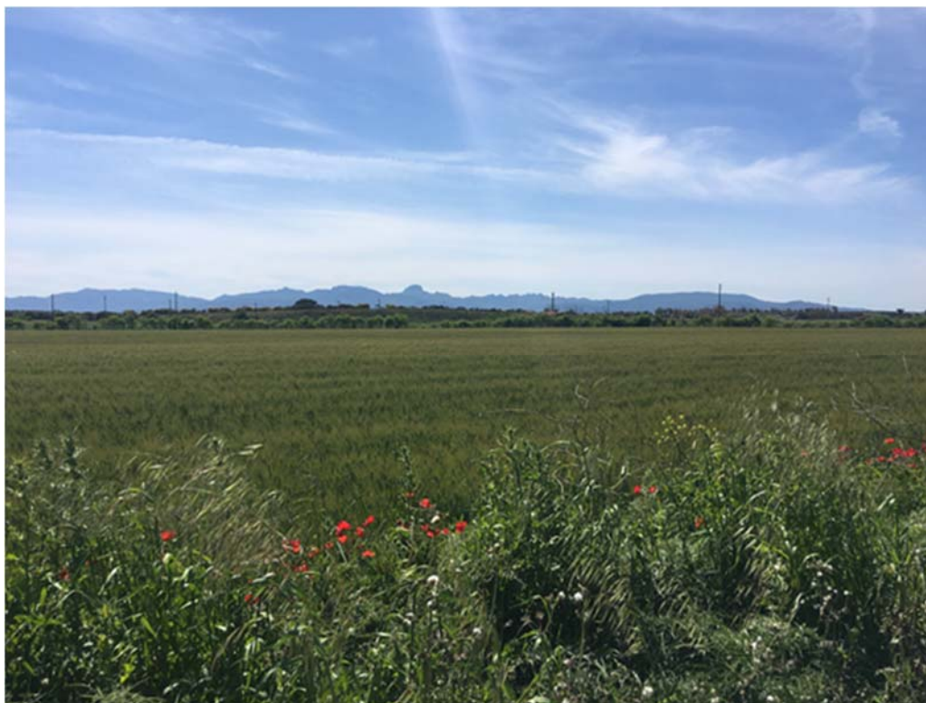
Foto 7.3/A: Seminativi in aree non irrigue nel territorio di Mogoro