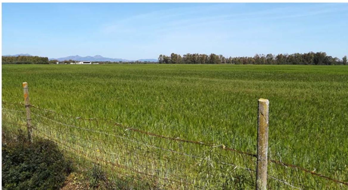
Foto 5.3/A: Aree destinate alle colture seminative nel territorio di San Gavino Monreale

Le immagini fotografiche che illustrano il contesto paesaggistico, la vegetazione e l'uso del suolo, in cui gli interventi si inseriscono è riportata nell'elaborato grafico allegato (vedi Vol. 7, All. 8 - "Documentazione fotografica" - Dis. DF-405).