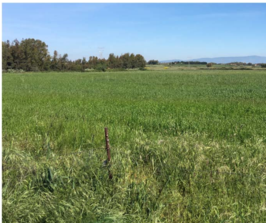
Foto 8.3/B: Seminativi e Pioppeti sullo sfondo nel territorio di Palmas Arborea