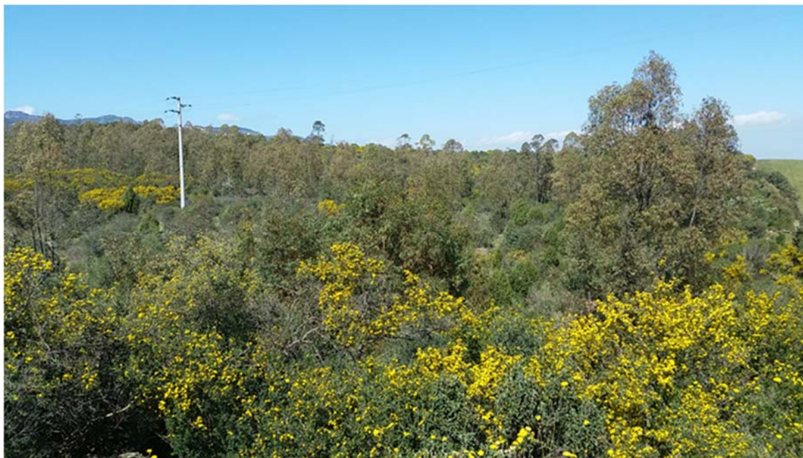
Foto 1.3/A: Pioppeti, saliceti, eucalitteti nel territorio di Uta

Le immagini fotografiche che illustrano il contesto paesaggistico, la vegetazione e l'uso del suolo, in cui la condotta si inserisce è riportata nell'elaborato grafico allegato (vedi Vol. 7, All. 8 - "Documentazione fotografica", Dis. DF-401).