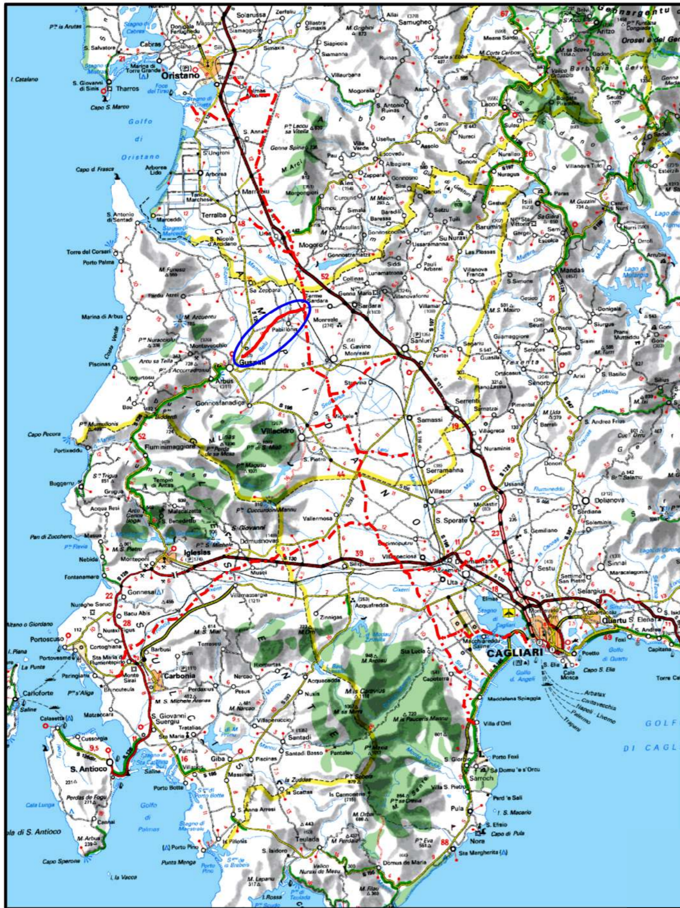
COROGRAFIA Scala 1:500.000

Il presente disegno e' di proprieta' aziendale - La Societa' tutelera' i propri diritti a termine di legge.