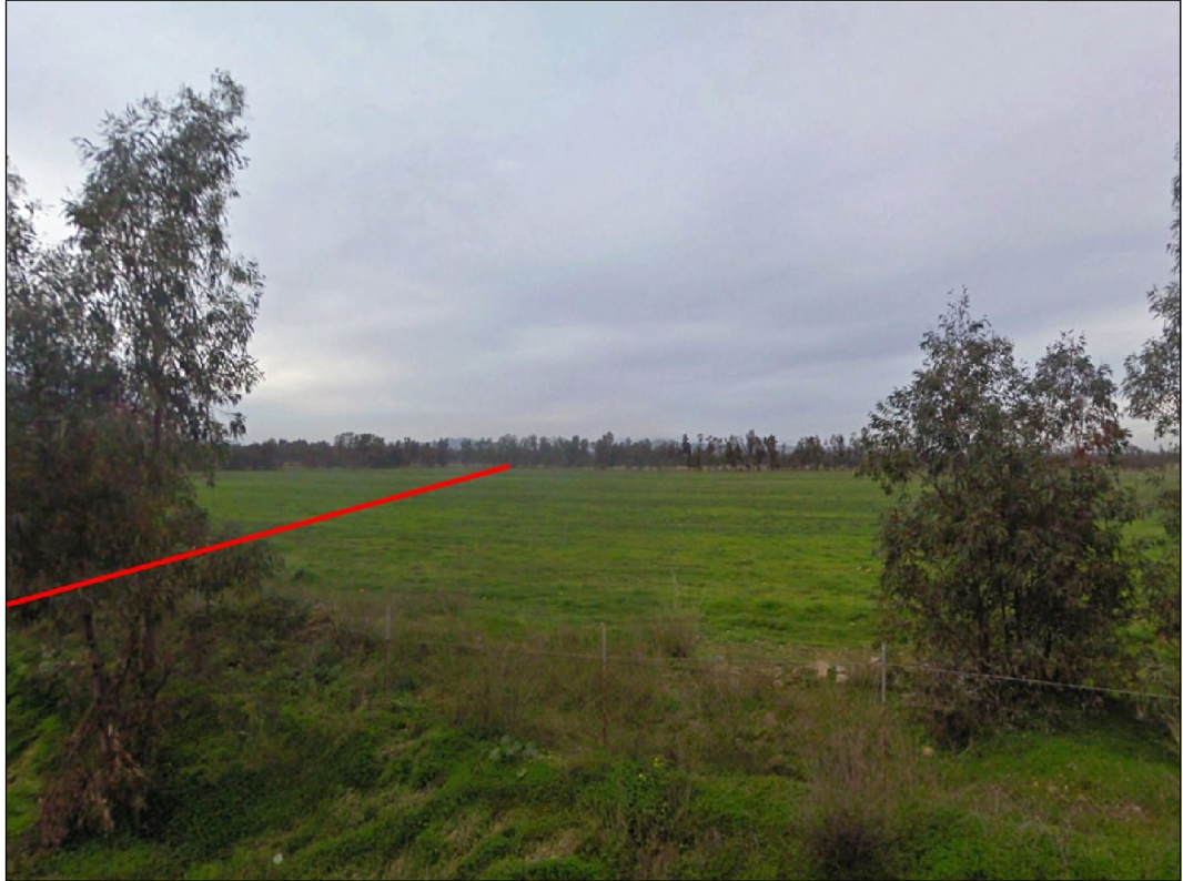
Panoramica del punto iniziale della condotta, in Comune di Uta