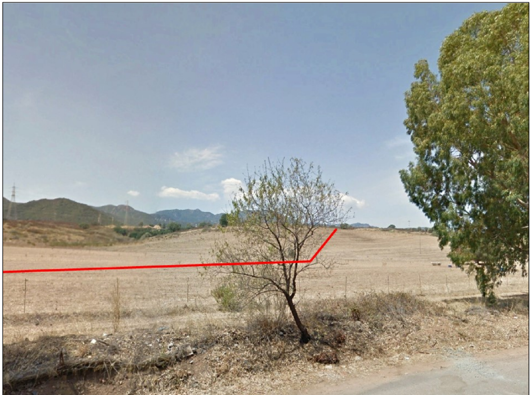
Panoramica del tracciato in prossimità della S.S. n. 195 "Sulcitana", in Comune di Sarroch