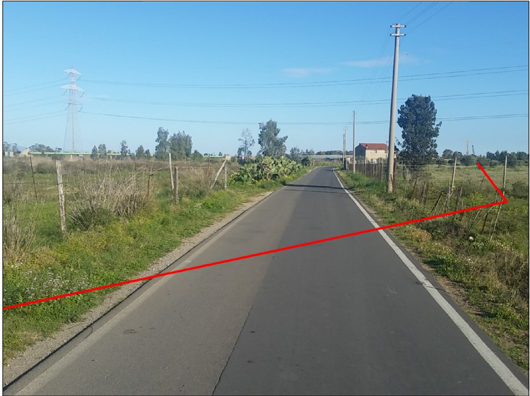
Attraversamento strada comunale in vicinanza del Riu di Santa Lucia, in Comune di Capoterra