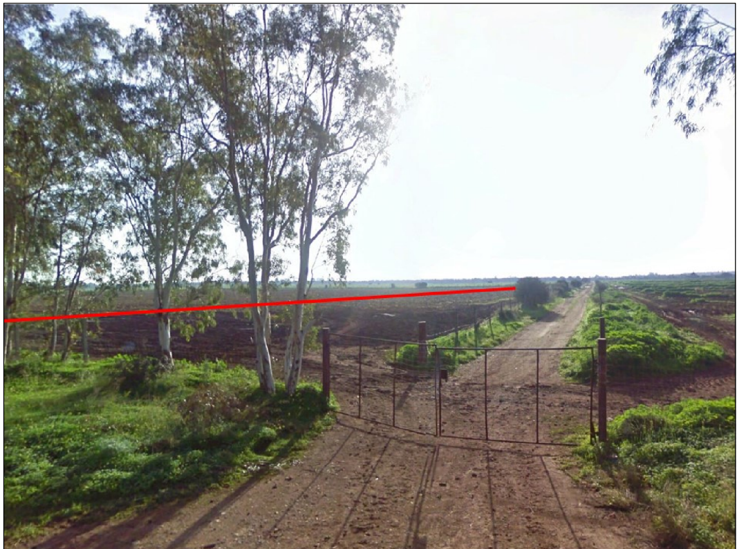
Attraversamento di seminativi, in Comune di Uta

Il presente disegno e' di proprieta' aziendale - La Societa' tutelera' i propri diritti a termine di legge.