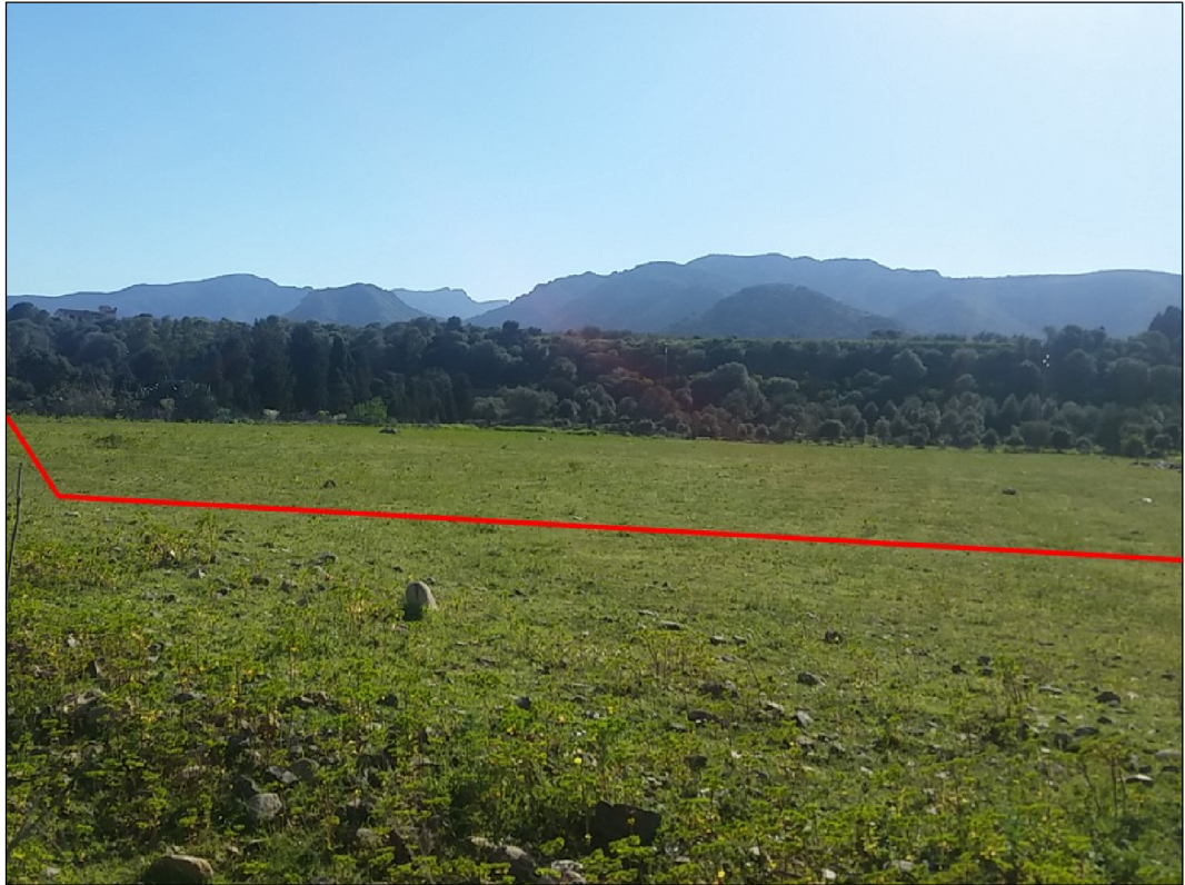
Attraversamento in terreni destinati al pascolo, in Comune di Uta