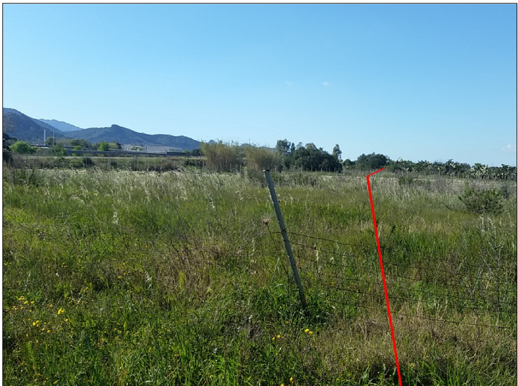
Percorrenza del tracciato in prossimità della località Is Marginus, in Comune di Capoterra