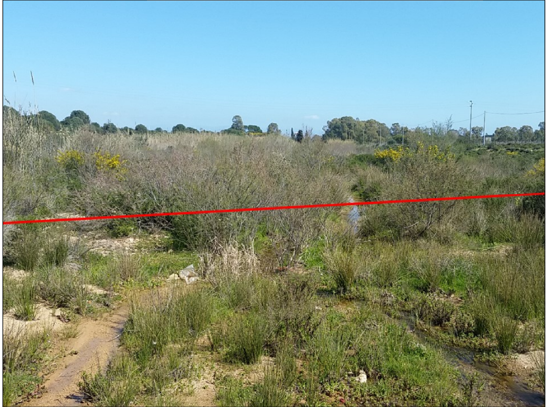
Attraversamento del Riu Baccalamanza, in Comune di Capoterra