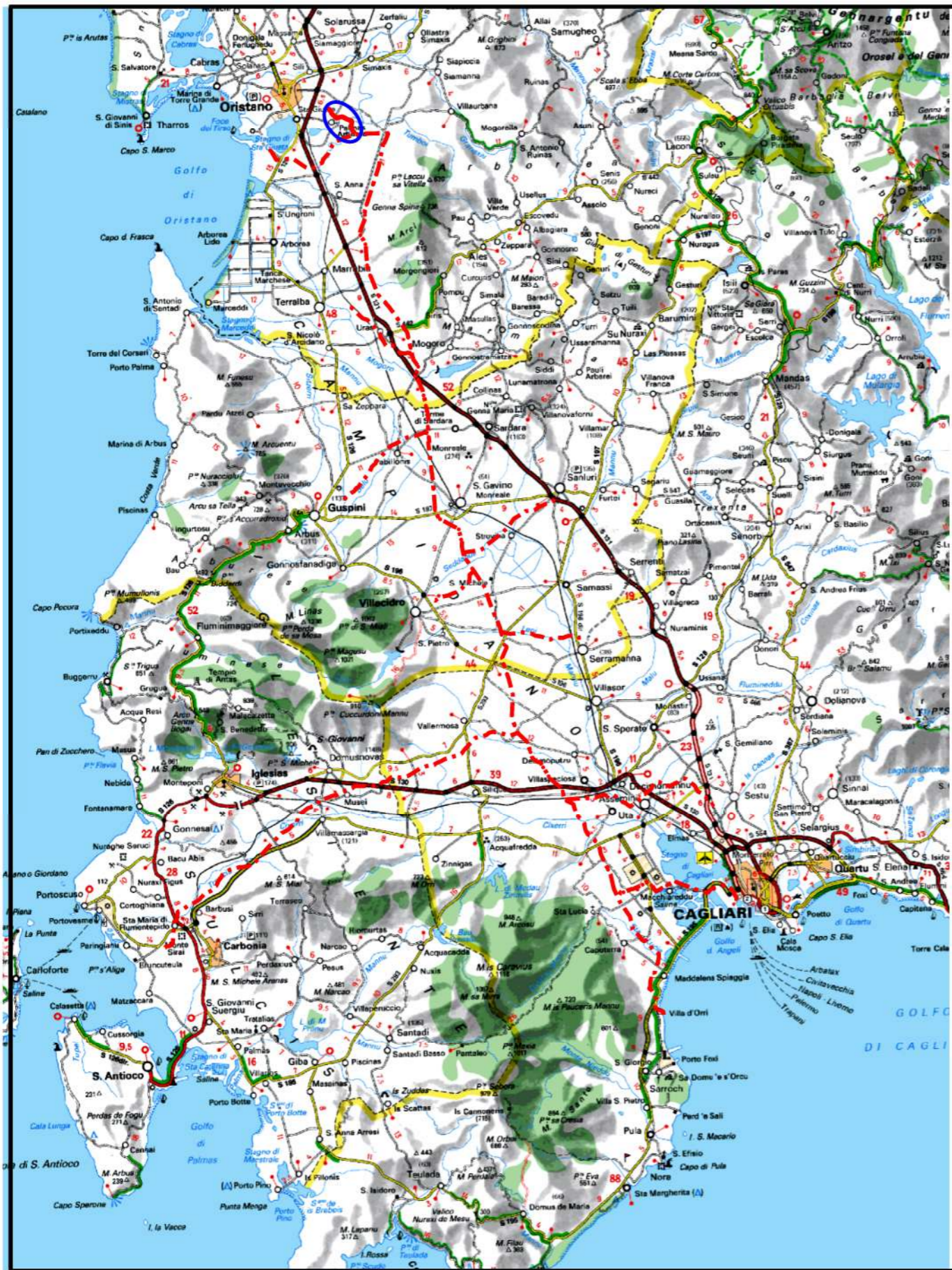
COROGRAFIA Scala 1:500.000

Il presente disegno e' di proprieta' aziendale - La Societa' tutelera' i propri diritti a termine di legge.