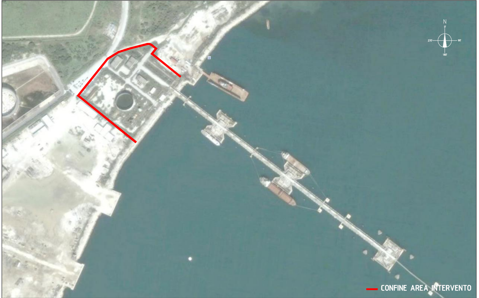
— CONFINI AREA INTERVENTO