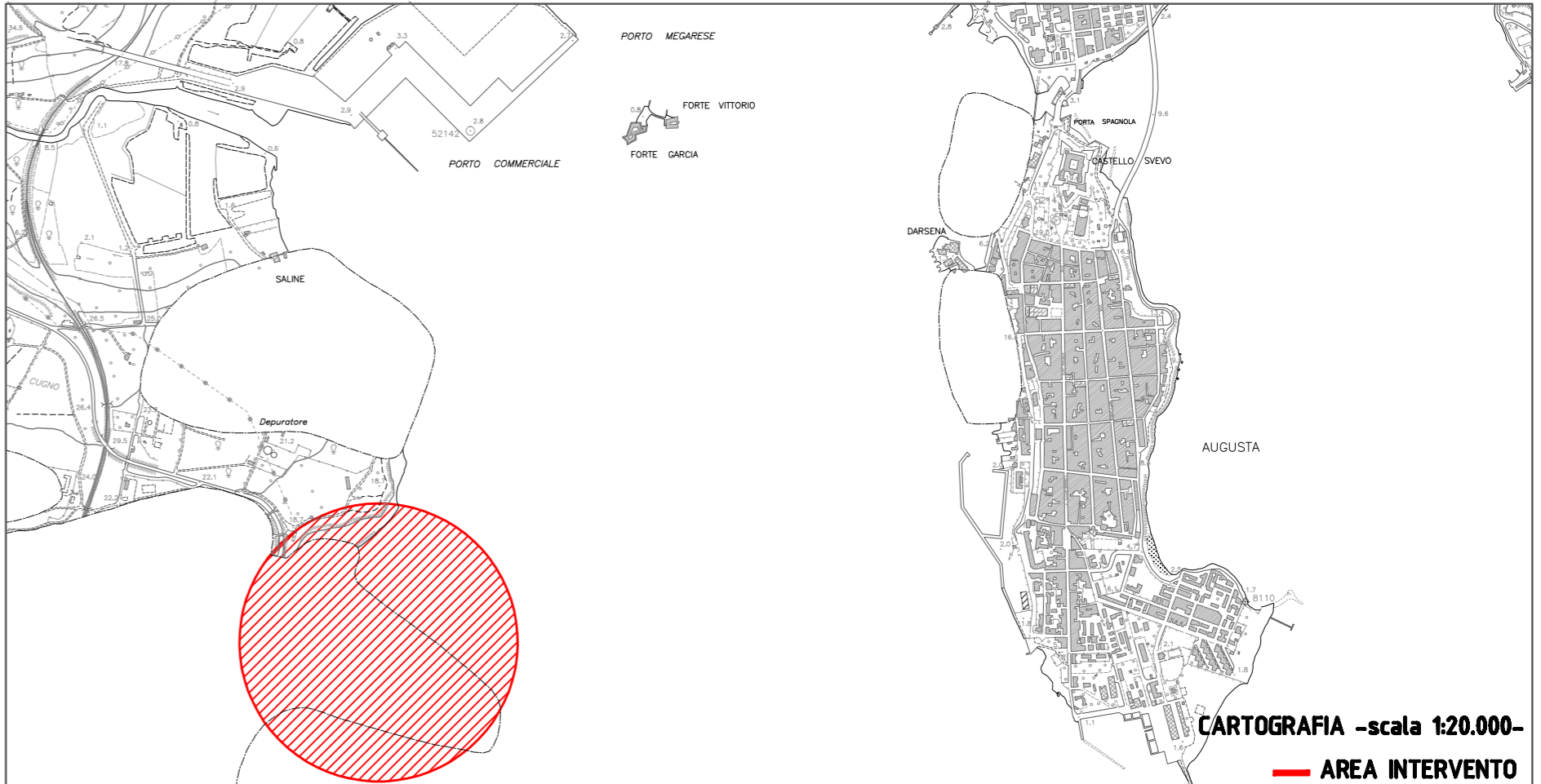
CARTOGRAFIA -scala 1:20.000- — AREA INTERVENTO