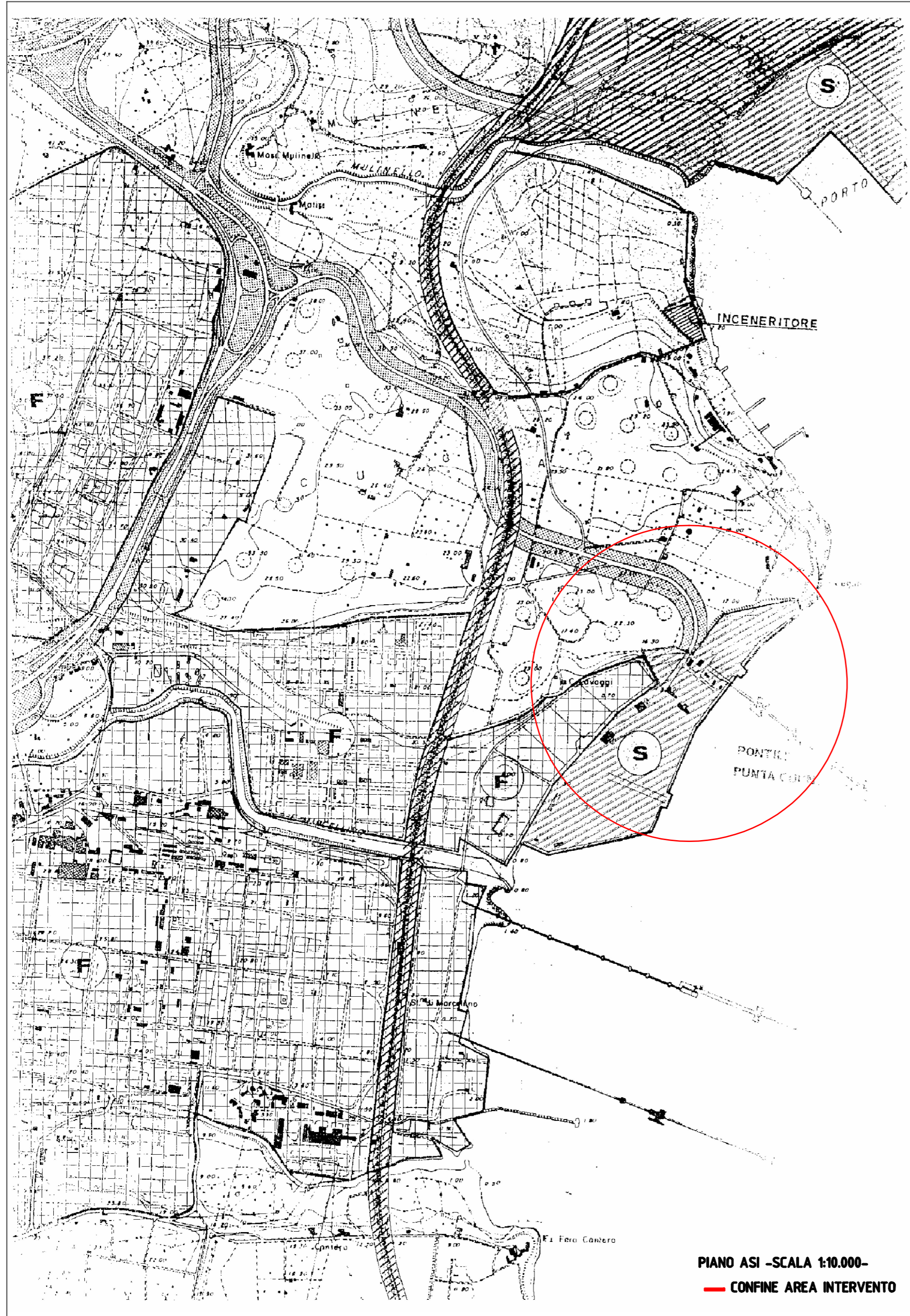
PIANO ASI -SCALA 1:10.000- — CONFINI AREA INTERVENTO