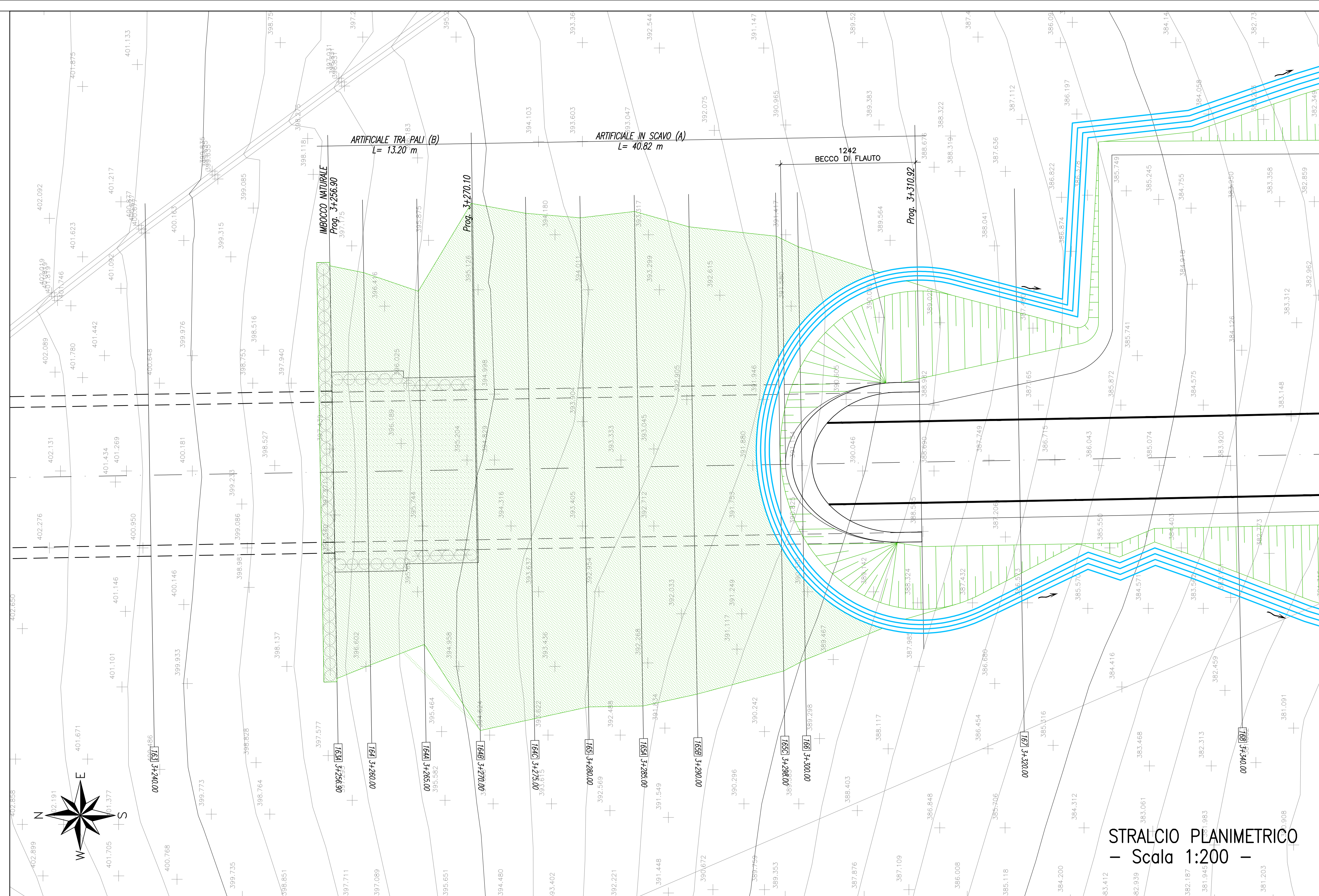
STRALCIO PLANIMETRICO - Scala 1:200 -