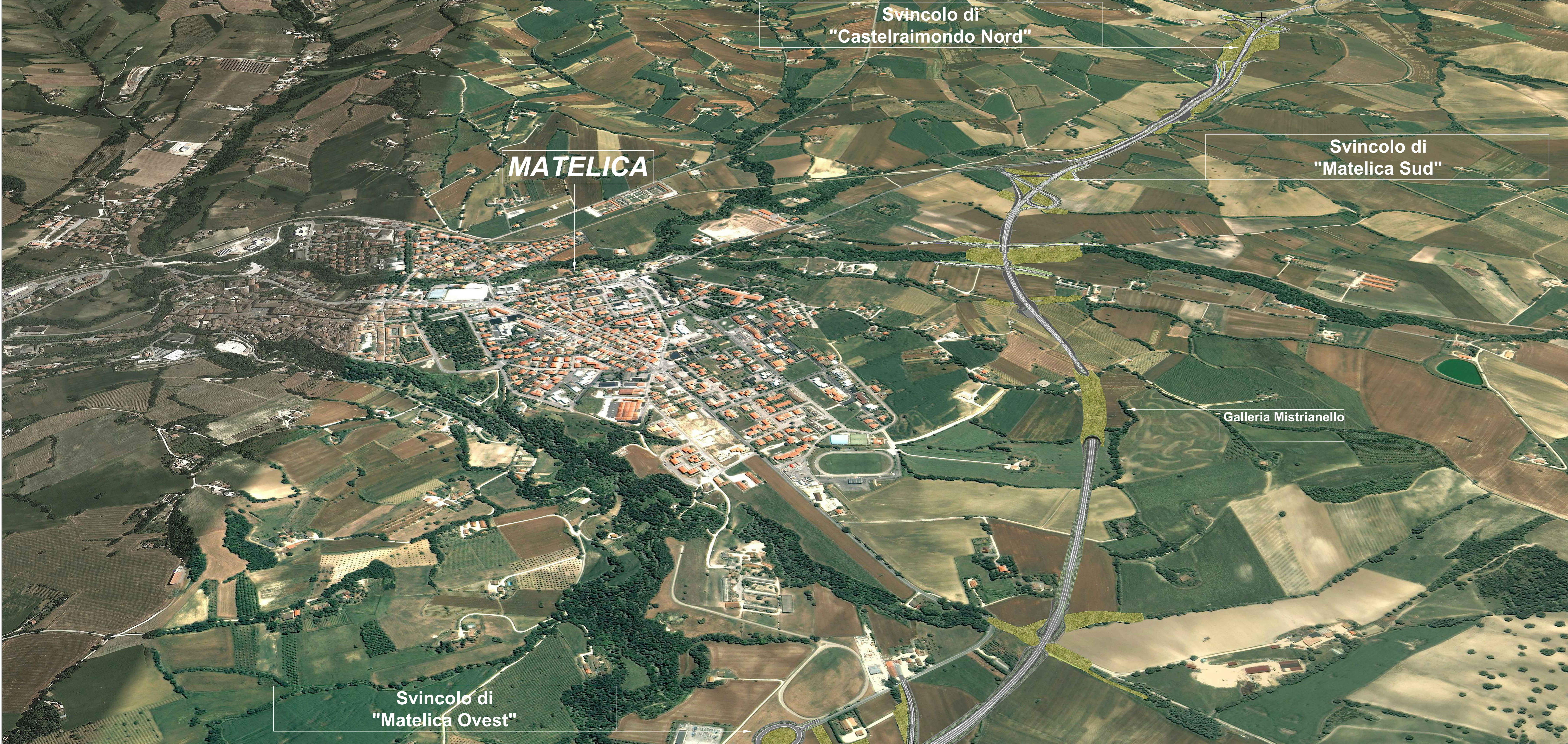
Simulazione su fotomosaico 3D