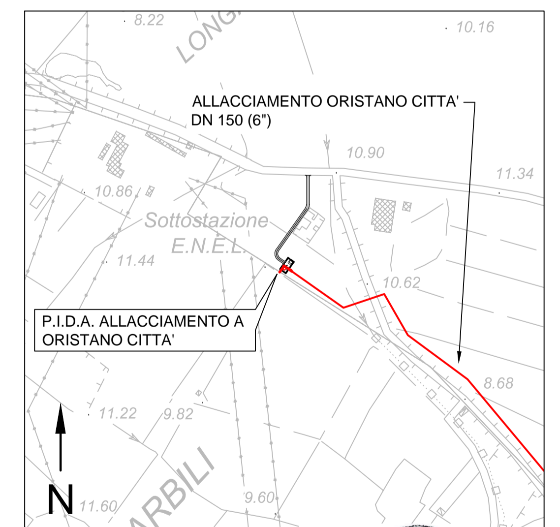
STRALCIO CTR 1:5000