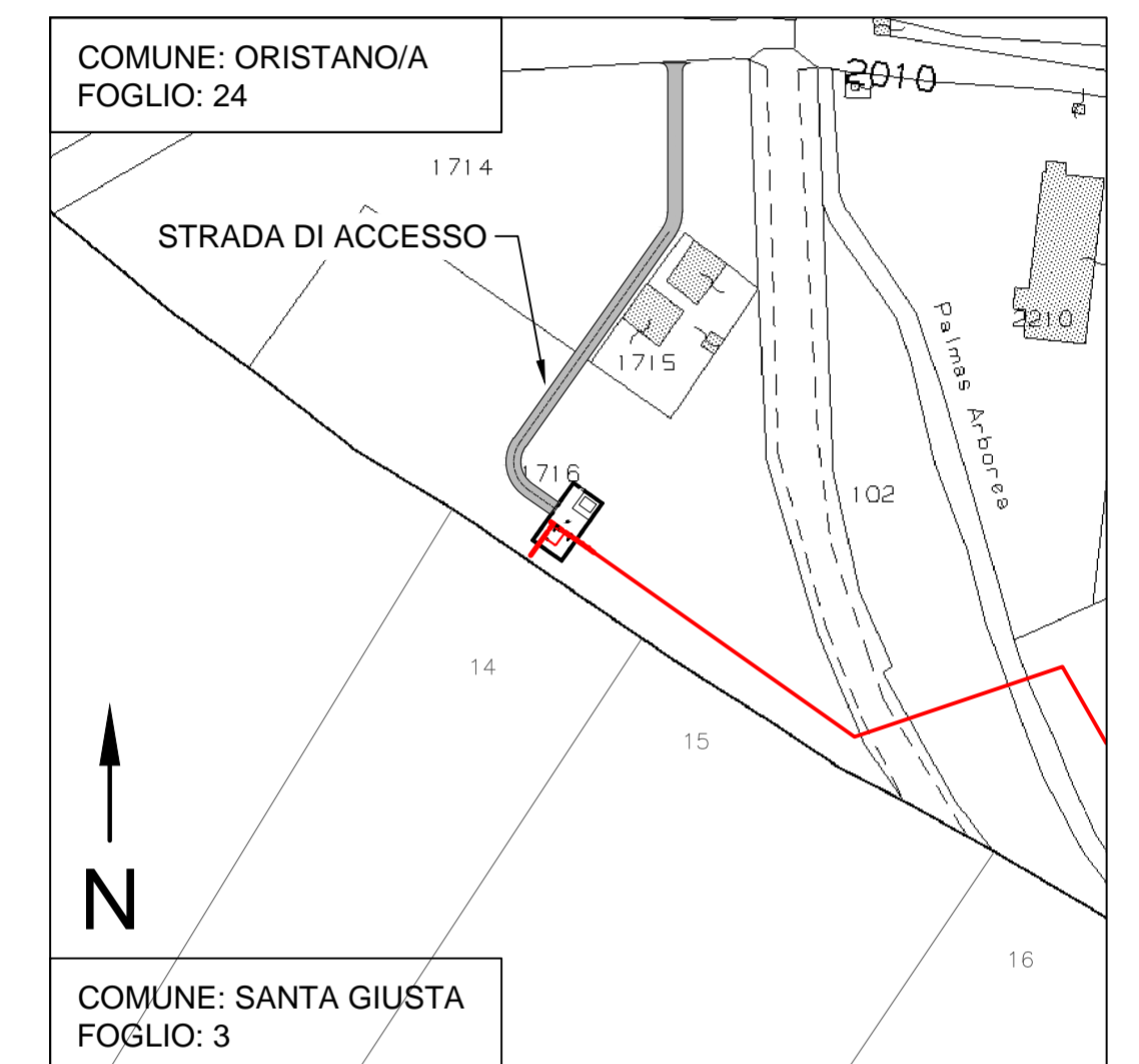
STRALCIO CATASTALE 1:2000