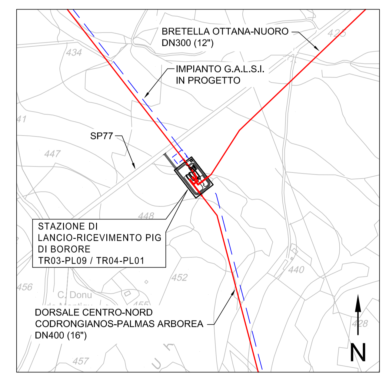
STRALCIO CTR 1:5000