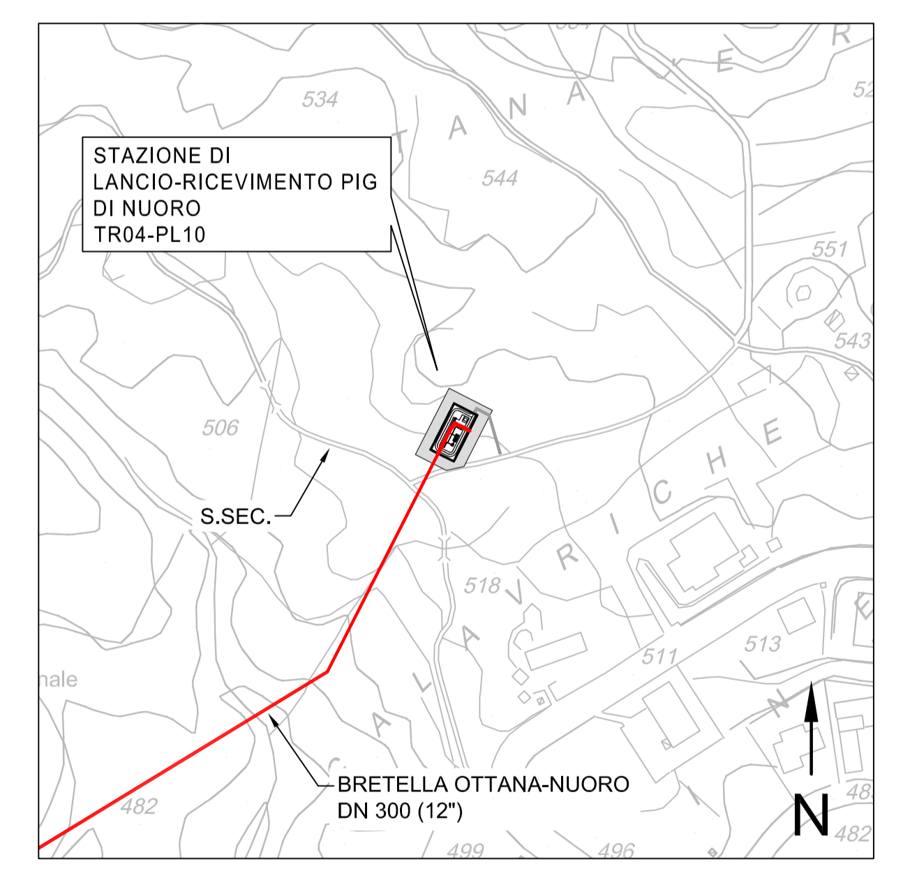
STRALCIO CTR 1:5000