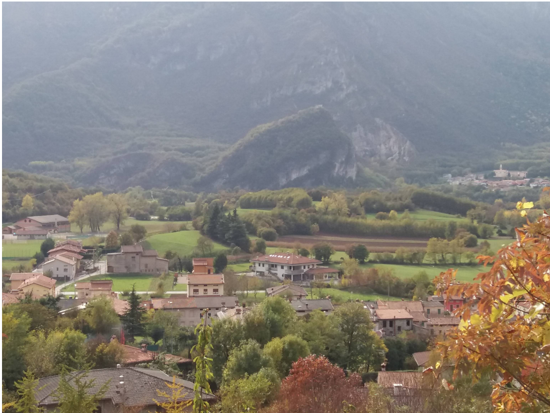
Foto 1 vista dal Campanile di Cogollo attuale