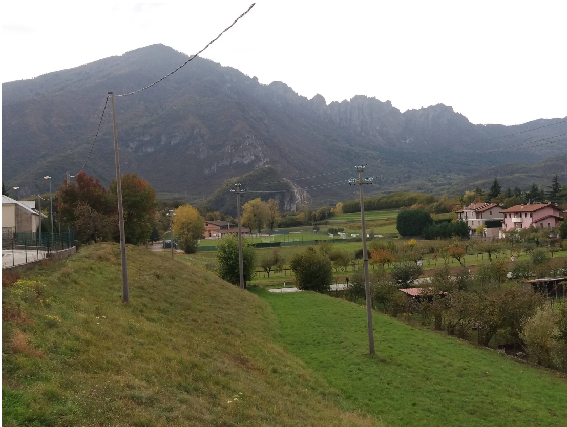
Foto 2 vista dalla strada di accesso al cimitero di Cogollo: attuale