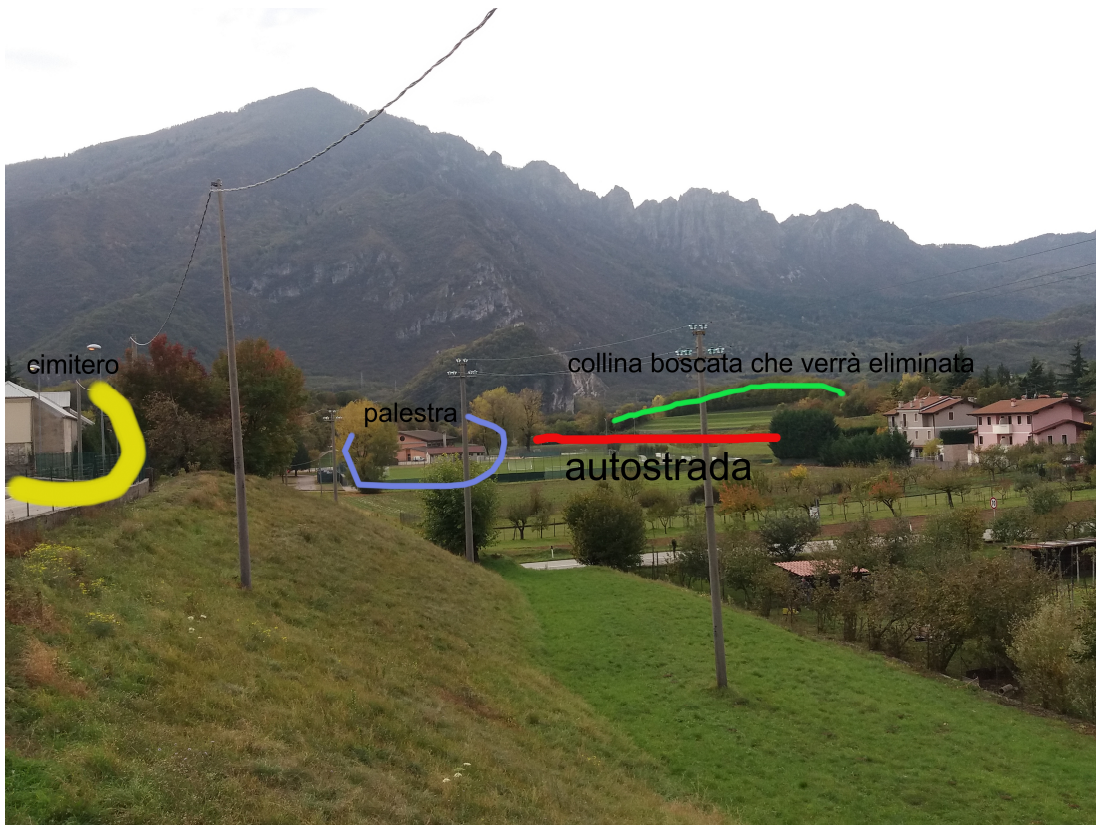
Foto 2 vista dalla strada di accesso al cimitero di Cogollo: "impatti"