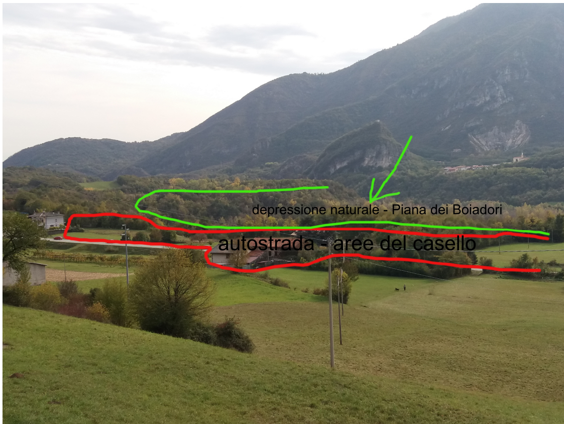
Foto 3 vista dall'abitato di Casale sopra galleria M. Cengio: "impatti"