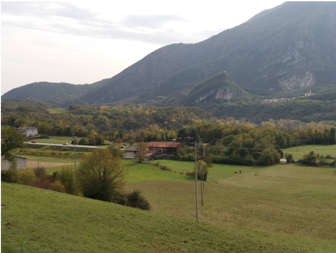
Foto 3 vista dall'abitato di Casale sopra galleria M. Cengio: attuale