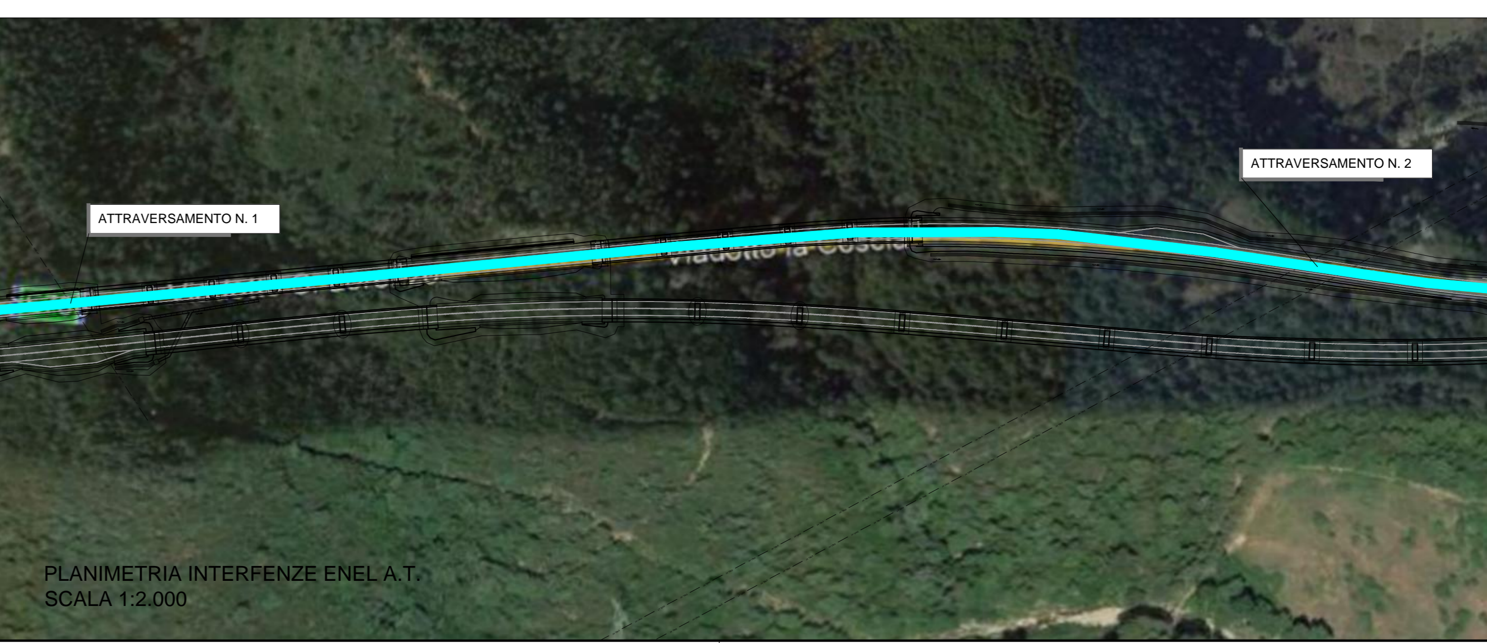
PLANIMETRIA INTERFERENZE ENEL A.T. SCALA 1:2.000