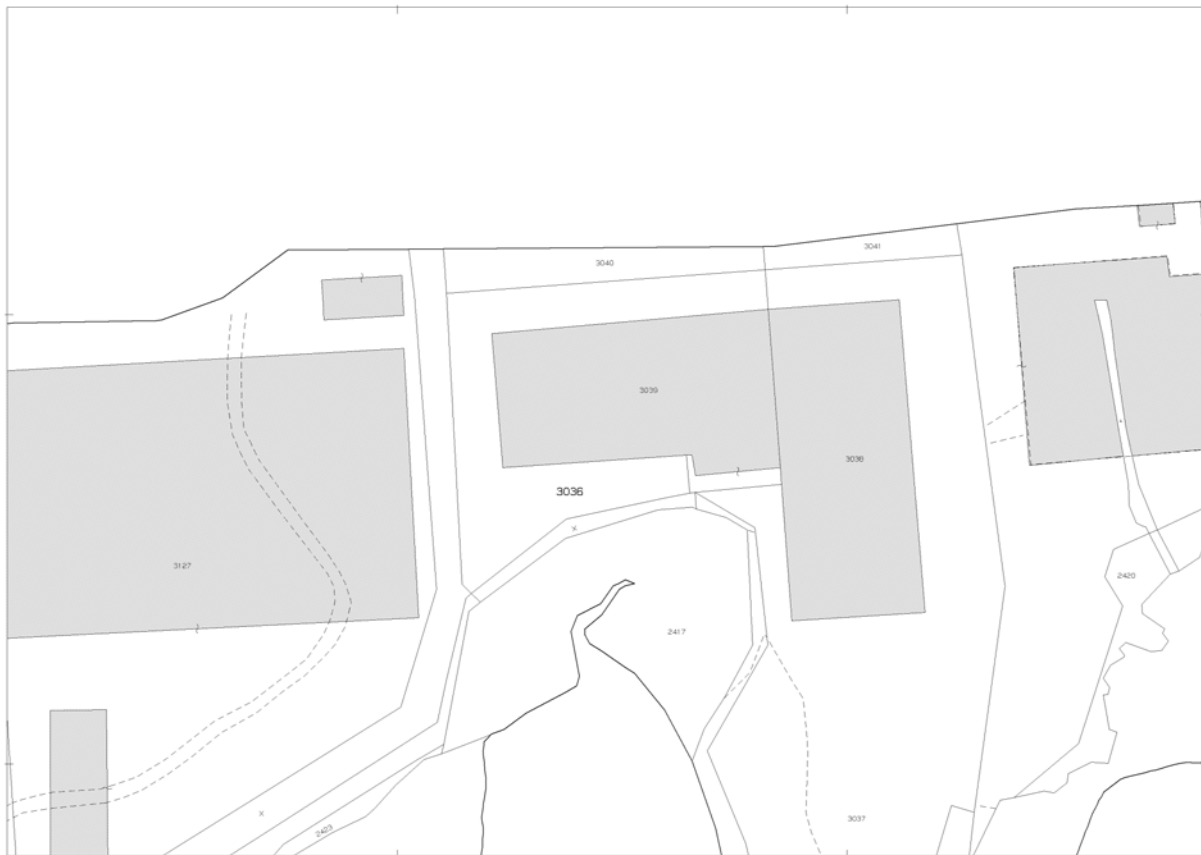
Estratto di mappa catastale