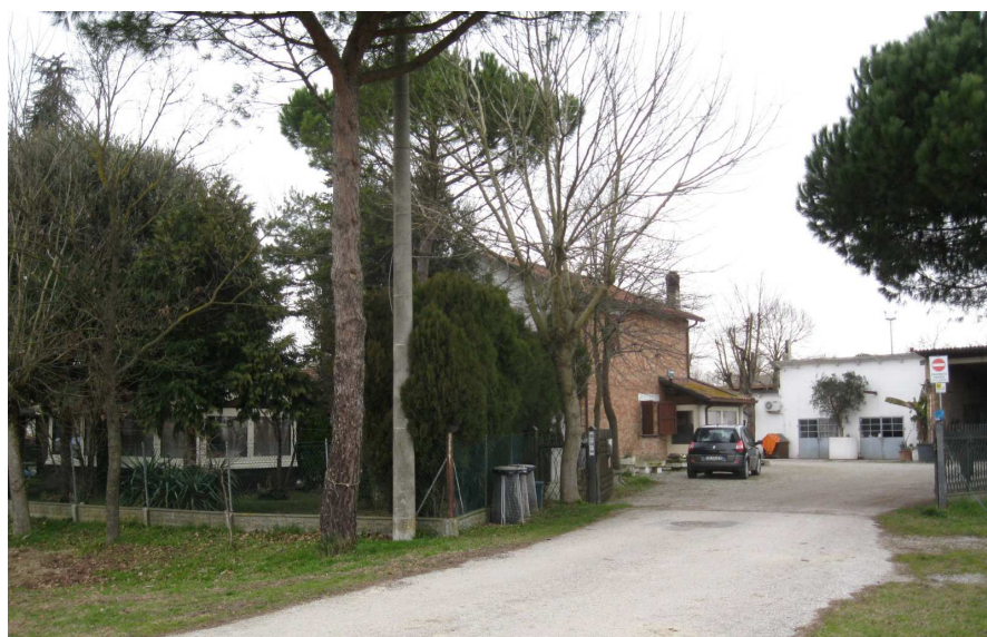
Foto 15: vista di un edificio esistente dalla strada sterrata di via Baronessa