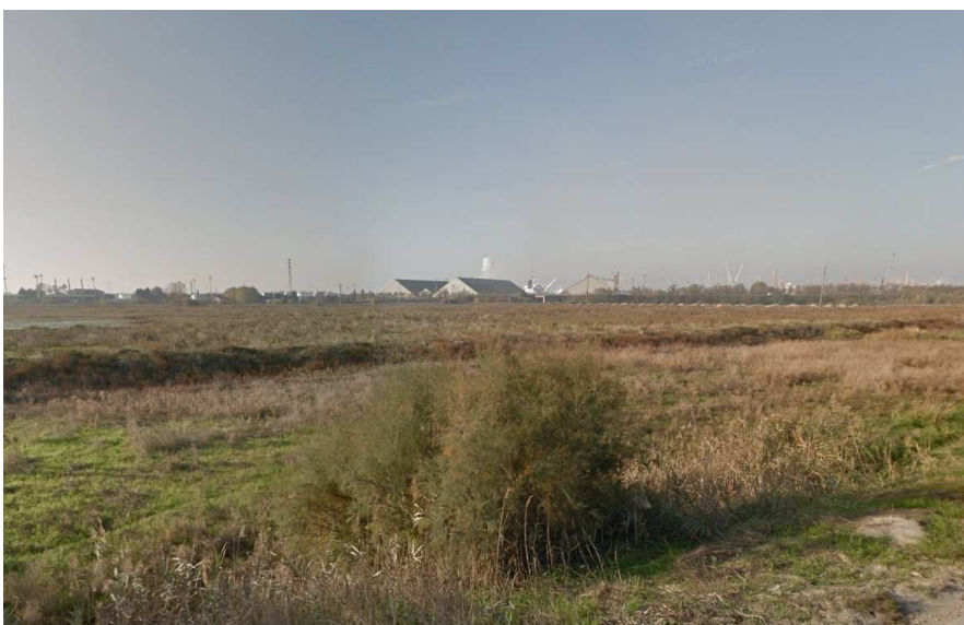
Foto 27: vista verso nord-ovest (verso i binari) da via Classicana