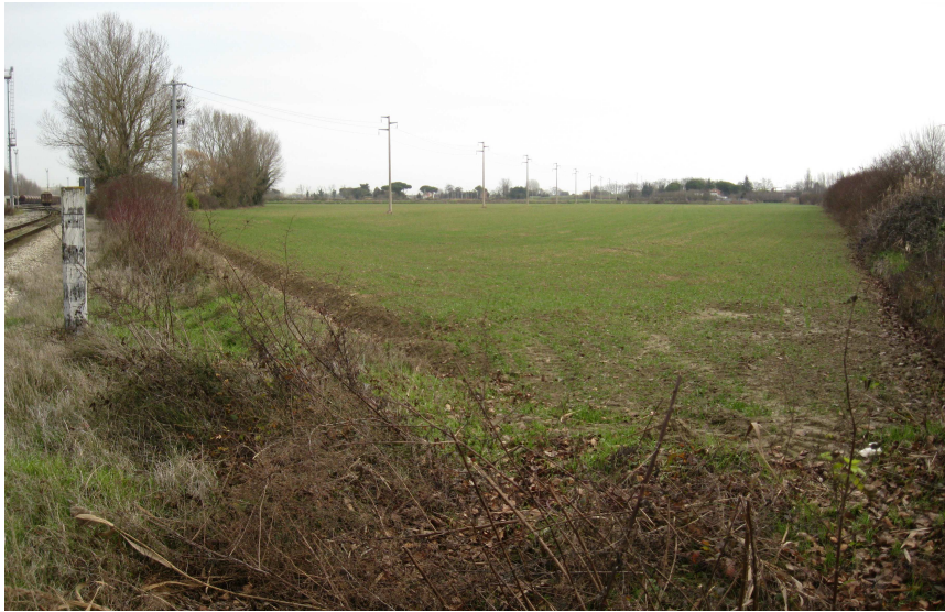
Foto 1: vista in prossimità del passaggio a livello su Circ.Canale Molinetto