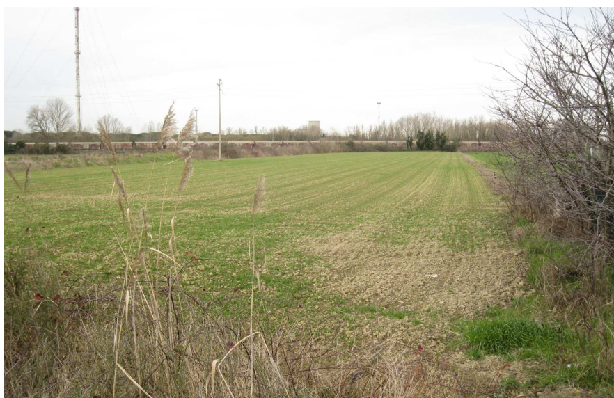
Foto 6: vista verso nord-ovest da Circonvallazione Canale Molinetto