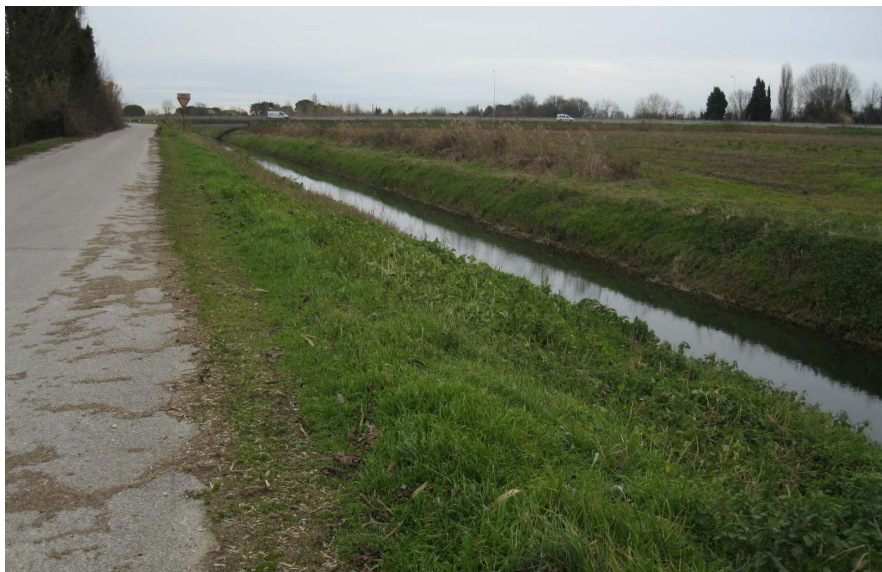
Foto 25: vista di via Vitalaccia e dello scolo Vitalaccia verso via Classicana