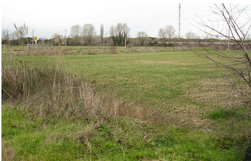
Foto 5: vista dell'area verso ovest da Circonvallazione Canale Molinetto