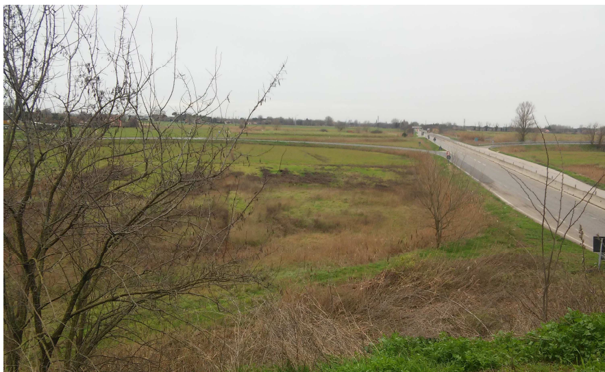
Foto 28: vista dal cavalcavia di v. Trieste su v. Classicana verso Ravenna