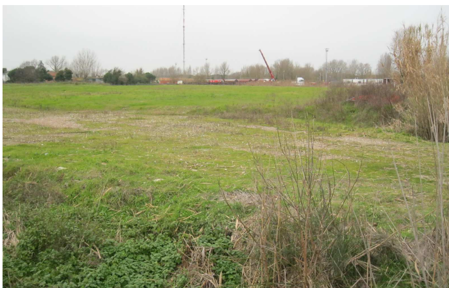
Foto 26: vista verso sud-ovest (verso i binari) da via Vitalaccia