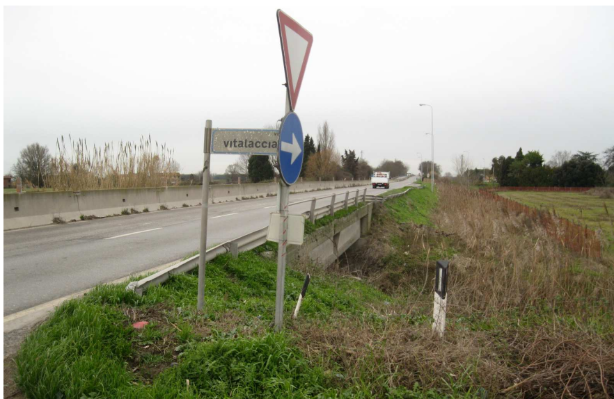
Foto 19: vista da via Classicana verso Ravenna in prossimità dell'incrocio con via Vitalaccia