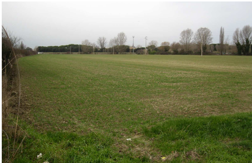
Foto 2: vista dell'area verso ovest da Circonvallazione Canale Molinetto