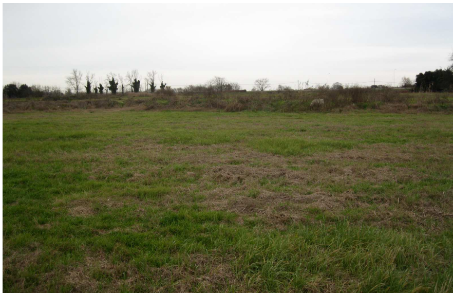
Foto 16: vista verso nord-est dalla strada sterrata di via Baronessa