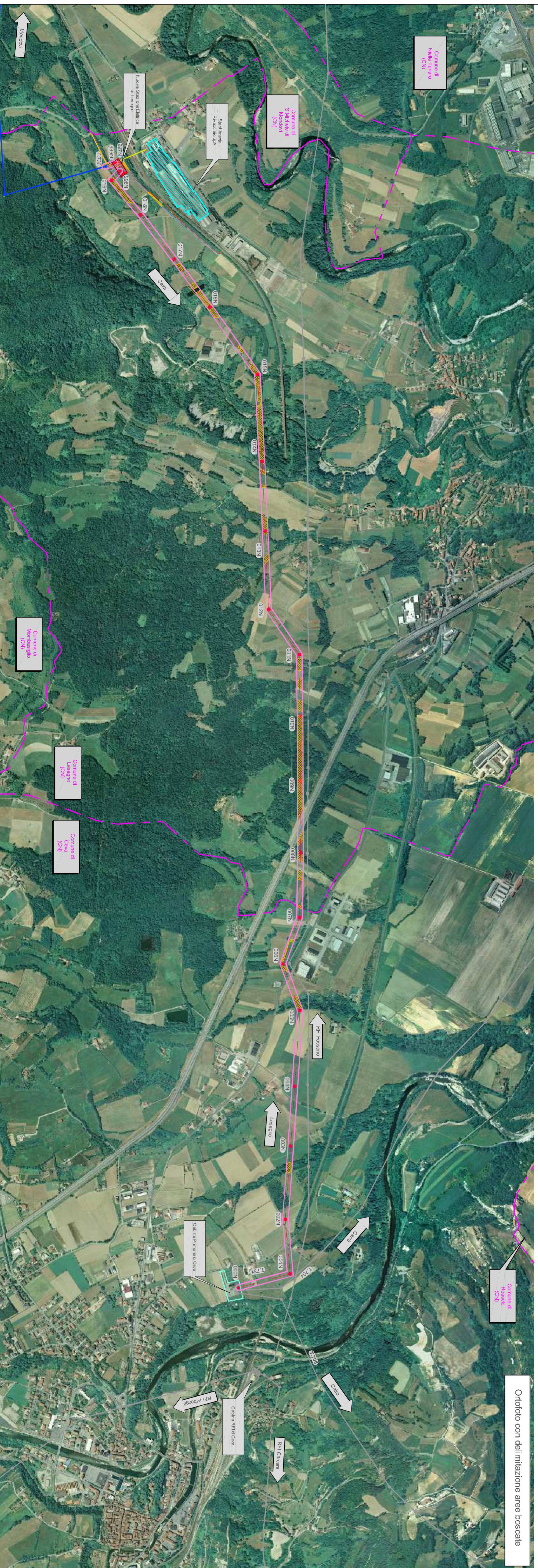
Ortofoto con delimitazione aree boscate